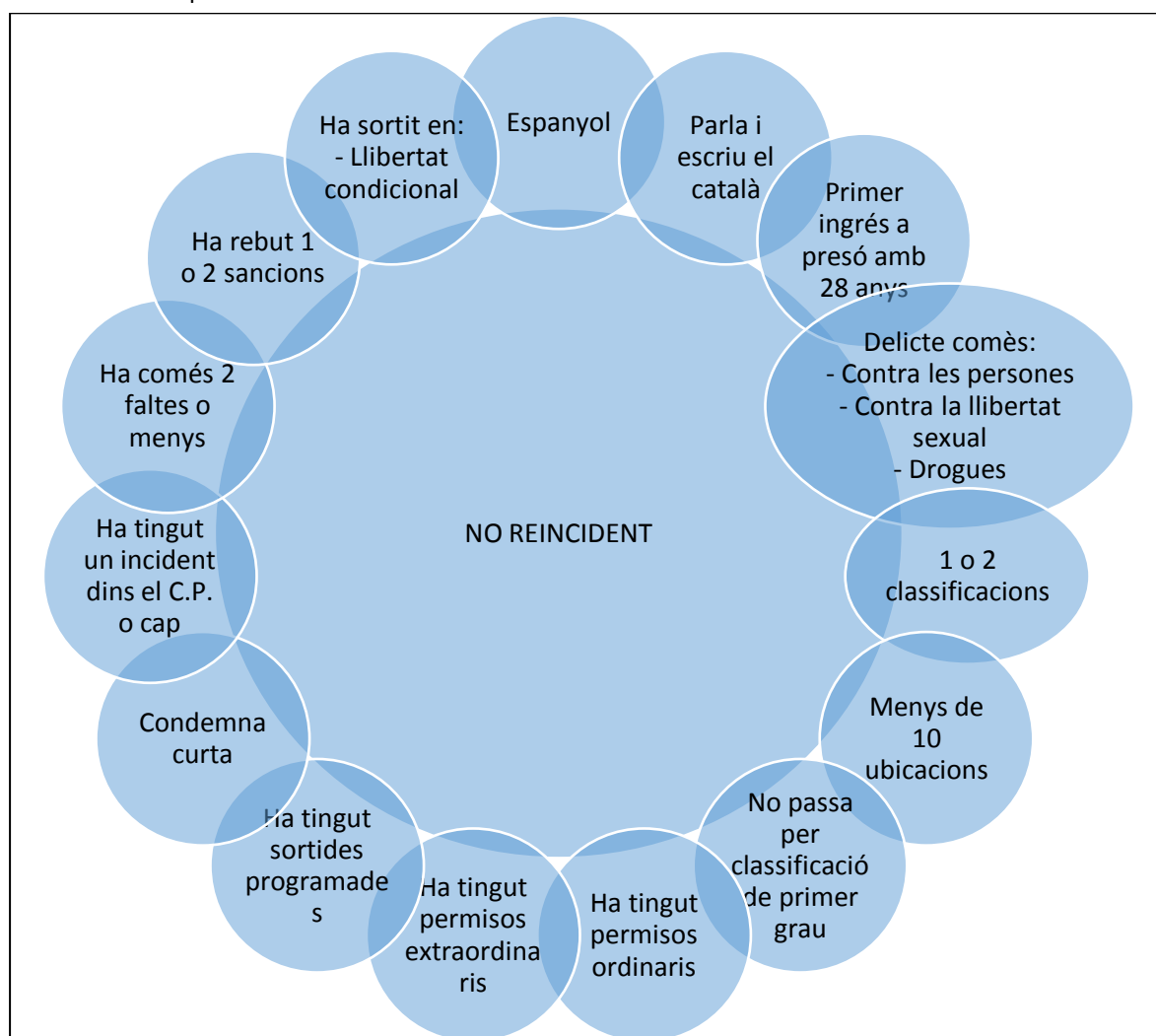
Gràfic 1 Factors que afavoreixen a la reinserció

Una condemna de 1159 dies de mitjana, també fa possible una adaptació progressiva de llibertats. La majoria de persones que sortiran i no reincidirán, han passat per 1 o 2 classificacions, i menys de 10 ubicacions, això significa que van entrar amb segon grau directament i només van passar al tercer, o bé que van passar de primer a últim, i això només es pot donar per una bona conducta i predisposició de l'excarcerat; fet que alhora es relaciona amb el baix nombre d'incidents i de les seves conseqüents sancions. El temps que es dedica a que un pres s'adapti al seu nou grau de llibertat és molt important, i per tant, és altament recomanable que la persona es trobi un temps en tercer grau i amb sortides i permisos a l'exterior, i properament passi a una llibertat condicional, que li acabarà permetent aconseguir la llibertat definitiva, però no de manera instantània.