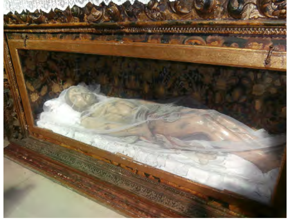
Cristo en la Cama , a sixteenth-century convent sculpture now used as a processional image.

A contemporary example might show how the political ‘turn’ of the 24 May 1766 procession might in fact be interpreted as part of a strategy of popular appropriation different to other forms of appropriative intervention only in the sense that it has such a strong social pertinence. Religious acts, like the saintly dresses and preciously crafted objects, were taking important risks in compromising a coherent visual ‘naturalism’, while they worked constantly at articulating a relationship with the image’s caretakers and the circle of the faithful. The audience discharges itself on the image’s very space of representation, instrumentalising it in its desire for a ‘real’ link. The faithful can be very dominant here: prolonged care for the image often means that new meanings accrete on top of older ones, moving from vestige to site, and from site to embellishment, as Louis Marin remarked in his analysis of the six tapestries of Saint-Gervais-saint-Protais. 17