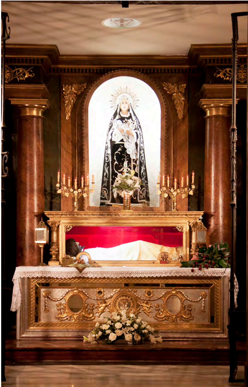
Cristo en la Cama in its current placement, church of Santa Isabel de Portugal y San Cayetano.