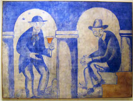
Xavier Nogués, detail of the mural at the cellar in the Galeries Laietanes, 1915, tempera on stucco. Barcelona, Museu Nacional d'Art de Catalunya, MNAC/MAM 42411.

who followed an abstract adscription, although they did share a taste for the popular character of these objects, their relative conciseness and their link to the society that produced them.