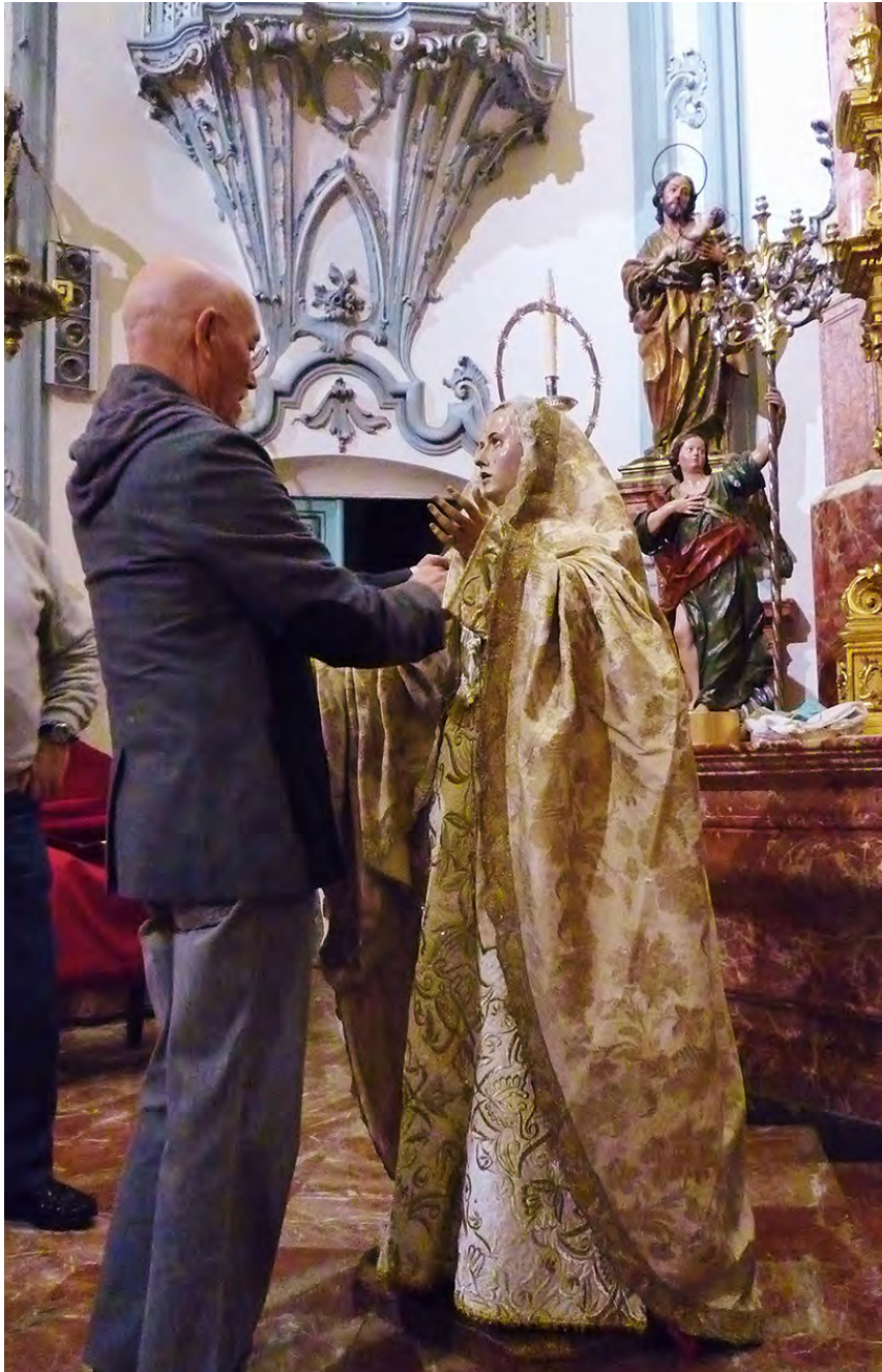
Changing dress for Nuestra Señora de la Luz en su Soledad , inside the eighteenth-century Church of San Juan de Dios, Murcia.