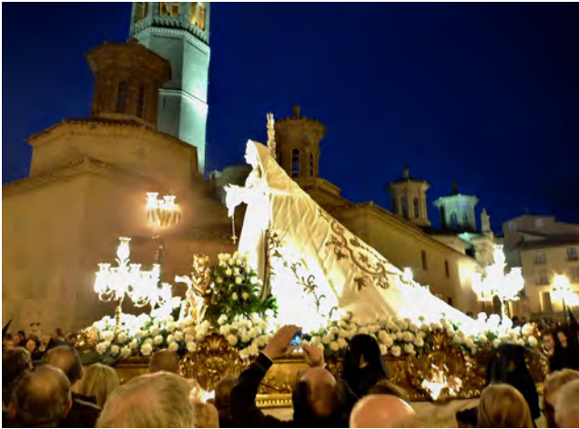
A nineteenth-century processional image that belongs to an all-women fraternity from 1866, the Congregación de Esclavas de María Santísima de los Dolores . The image is presented dressed and mounted on its float for Easter.

ed along with the image, visibly and noisily: they touched, spent time with the saint, dressed it up and felt pride even over what should, in terms of subject matter and style, humble, depress and disillusion. The finished image, provided with the sculptor's and painter's skills in naturalistic or animistic representation, may well be the beginning of a process of engagement, not the end.