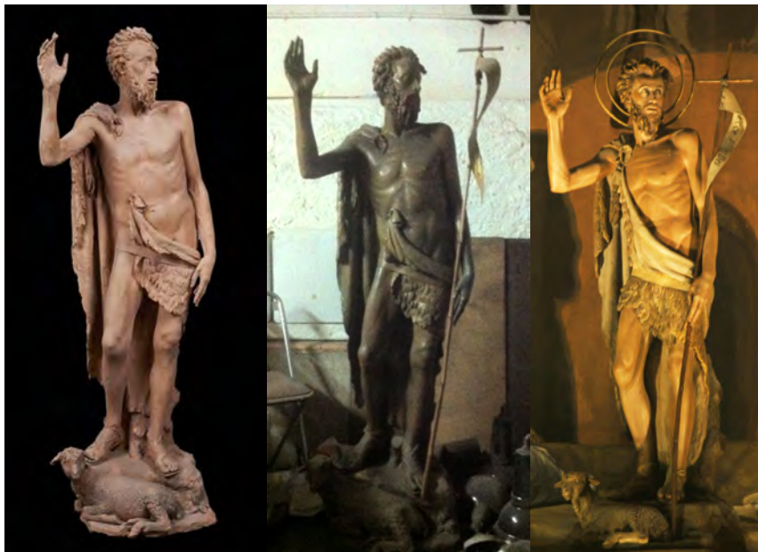
Imatge comparativa: guix al magatzem del Museu de Montserrat (esquerra); fusta al soterrani de Sant Miquel de Gràcia (centre), i fusta policromada a l'altar major de Sant Miquel de Gràcia (dreta).

haver de refer la draperia perquè cobrís les cames i part del cos. Aquesta peça havia estat qualificada per Adrià Gual com «una magnífica talla policromada que, siguiendo espontáneamente la tradición de nuestros imagineros, pone de relieve las cualidades heredadas de su casta de artistas, que sintieron a fondo el dramatismo con todos los matices de la elevación espiritual».