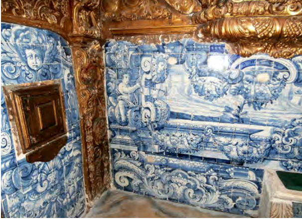
Interior of the Church of Jesus in the Dominican Convent of Aveiro, view of a blue-tiled wall underneath the organ.

agery is a part, including blue-tiled walls and images of saints surrounded by elaborate colonnettes, cornices and gilded, wood-carved and plastered frames, such as the Saint Dominic. The ensemble is devoted to occupying the eye, but the tenor of the encounter is playful and caressing rather than “shocking”. The furnished interior of a baroque church, as Helen Hills has argued in her analysis of space and gender in Neapolitan baroque convents,