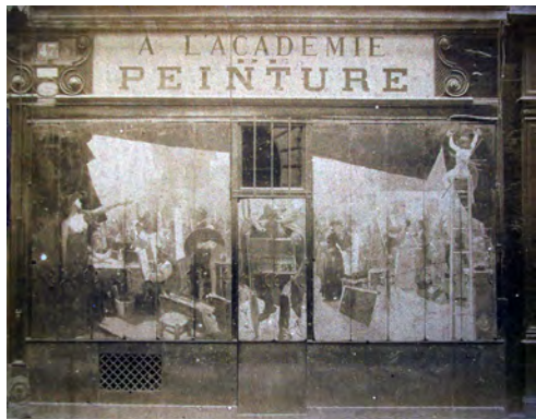
Vista del exterior de la Académie Julian, último tercio del siglo XIX.

tes, a acoger a cuatrocientos estudiantes en 1885 y a seiscientos en 1889. 18 Abierta también a mujeres, en un primer momento compartían espacio con los hombres, pero a partir de 1880 se separaron en talleres independientes. 19 El precio, en torno a los 20 francos por cuatro horas de trabajo, con oferta de 400 francos anuales por media jornada y 700 para la jornada completa en el caso de los hombres; y 10 francos por cuatro horas, 200 al año por media jornada y 300 por la jornada anual completa para las mujeres en la década de 1890, 20