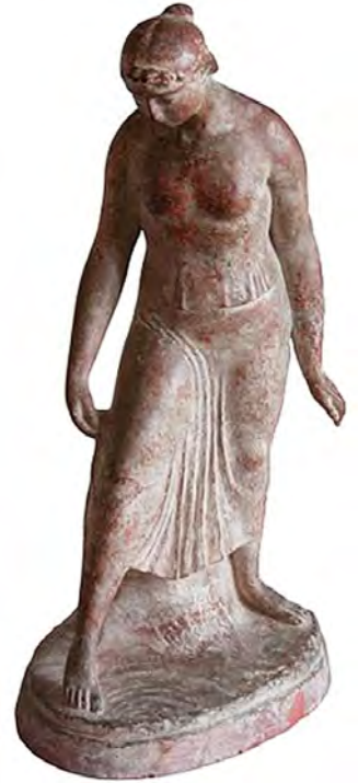
Joaquim Claret, Rhythm , terracotta with rose patina, 41.8 × 21.5 × 15.6 (base) cm. Private collection.

Despite this, there are other types of noucentista pieces that we might define as primitivist by following the various interpretations of the concept and therefore consolidating Noucentisme’s nexus between tradition and primitivism. In this case, we are talking about the sculptures commonly known as Tanagra , inspired by Archaic Greek figurines, which take their name from the towns of Tanagra and Myrina: two of the archaeological settlements at Boeotia in Greece where large quantities of small-sized terracotta pieces were found from the 1860s onwards, generally representing women or tunic-wearing divinities in various positions. These antiques began to