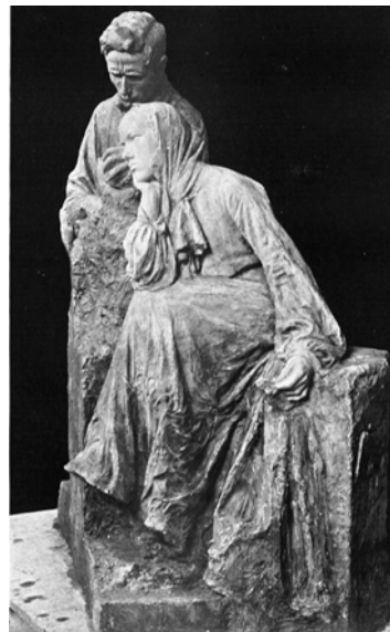
Una bona mostra de l'obra escultòrica de la primera etapa dels germans Oslé és La inspiració (1907), amb la qual van guanyar la primera medalla a l'Exposició de Belles Arts de 1907.

A les reserves del Museu de Montserrat, s'hi conserva una figura en guix d'uns 125 cm d'alçada que representa sant Joan Baptista, sen-