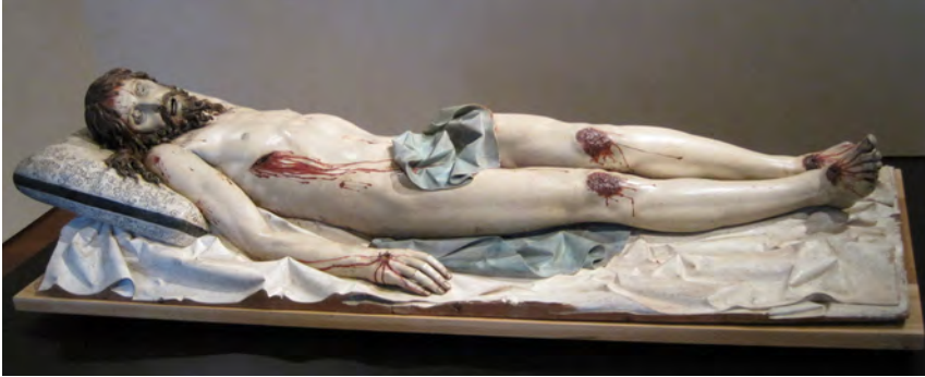
Gregorio Fernández, Cristo Yacente ("Depositioned Christ"), about 1625–1630. Polychrome wood, horn, glass and ivory or bone, W. 1.91 m, Museo Nacional Colegio de San Gregorio, Valladolid.

Checa and Morán assumed that the rich interior of the post-Tridentine church cancelled reason and appealed only to emotion. Yet between believing this to be true of the ecclesiastical interior as such and doing the same with, say, the 'presence' of Gregorio Fernández's Cristo Yacente , implies a certain slippage, not to say sloppiness, in our categories of stylistic discernment. To say about Cristo's displays of torn flesh and spectacular morbidity that they stretch the illusionist potential of sculpture seems fair; to say that it freezes out sound judgement from the operations of our mind in a single confrontation between image and beholder is, at best, an interesting assumption. We usually say that about them , the faithful. Moreover, the appearance of ecclesiastical baroque interiors is another matter entirely. In fact, the ostentation and decorative excess is a particularly tricky thing to reconstruct in an exhibition, and this is true as well for the reconstruction of Catholic experience achieved at The Sacred Made Real .