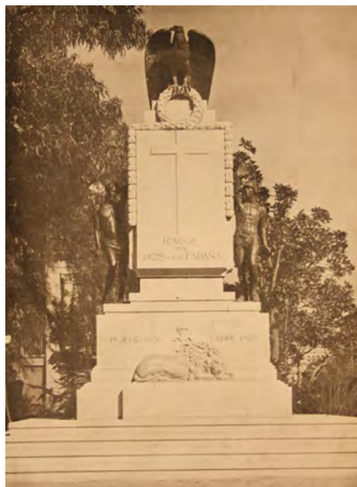
El monument als caiguts del Reial Club Deportivo Espanyol és un exemple de l'escultura monumental franquista de la darrera etapa dels escultors.