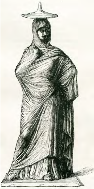
Anonymous, Woman with tunic , 340-320 bC, clay, 23.2 × 8.4 × 5.1 cm. Paris, Louvre Museum, MNB 576.

be introduced in France in the beginning of the 1870s and were considerably successful almost immediately, a fact which led to the appearance of collections and even fakes. 7