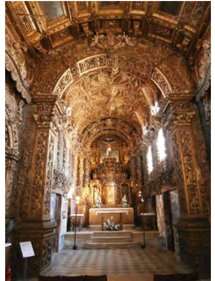
Interior of the Church of Jesus in the Dominican Convent of Aveiro, remodelled about 1700.

In the ornate interior, images proliferate in so many forms that they no longer confront much. A visitor to the Igreja de Jesus from 1690–1720 in the Dominican convent of Aveiro, in Portugal, with its well-preserved baroque interior, will be offered a multitude of surfaces of which im-