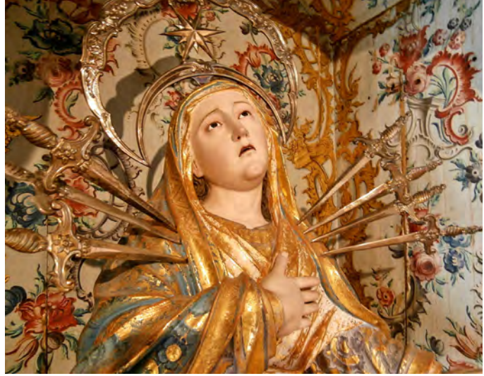
(On the left) altar with image of Our Lady of Sorrows, second half of the eighteenth century, Portugal. Upholstered and polychrome wood, glass, silver and gold leaf, Museum of the City of Aveiro. Photo by the author. (On the right) detail of the altar, Museum of the City of Aveiro. Photo by the author.

ties for conspicuous consumption to ostentatious investments in decorative paraphernalia, which were burning up resources that should be going to the rescue of a slumped agrarian economy. 14