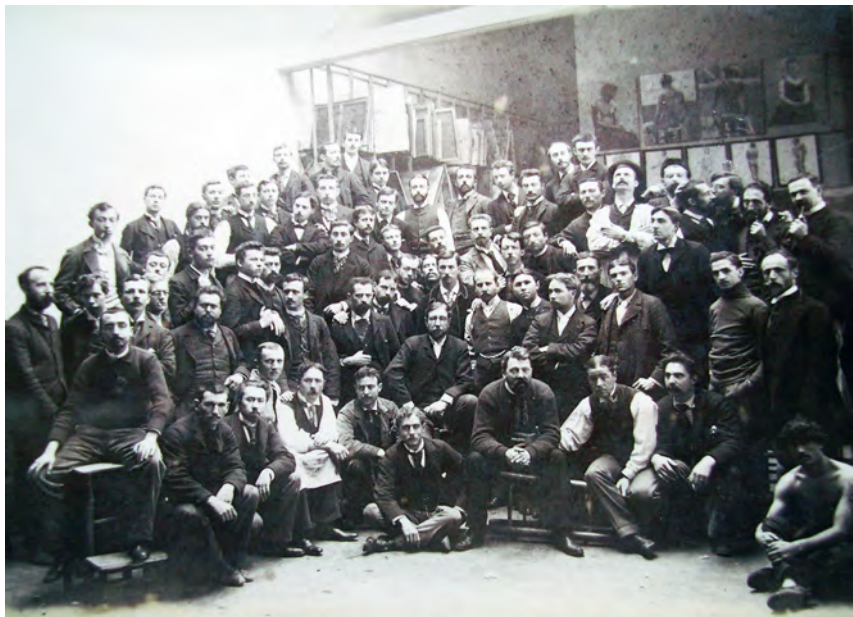
Alumnos en uno de los talleres de pintura de la Académie Julian, último tercio del siglo XIX. Colección André del Debbio, París.

elegían los modelos por voto, aunque, según Milner, fuera el propio Julian quien los seleccionaba cada lunes. 31