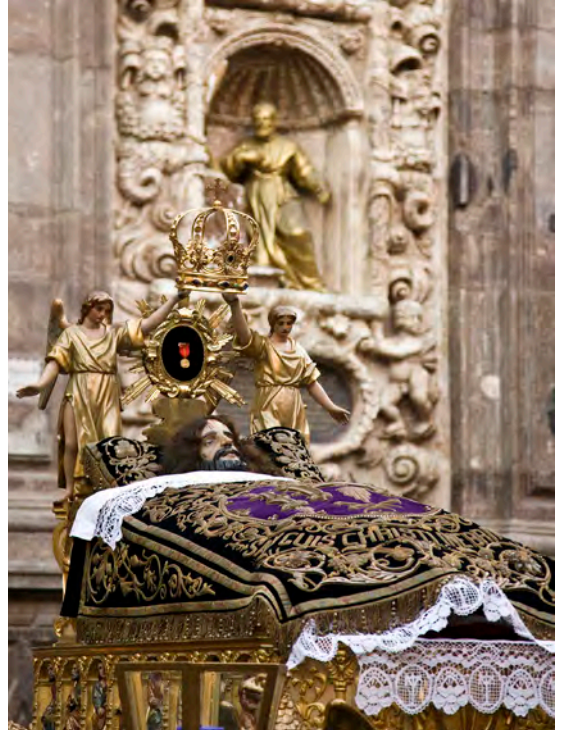
A procession of Zaragoza's Nuestra Señora del Rosario en sus Misterios Dolorosos , carried by a cofradía established under Franco's re-Catholicisation regime, in 1944.

Following Louis Marin, I think we must attempt a reading of the interpersonal bond that operated in baroque Spain, finding there, not in naturalism, the clues to the processional image's presence. We might go about setting this investigation up by looking around today, in contemporary Spain, between these effigies and the people who parade them during Easter, Whit Sunday (Pentecost), Corpus Christi and All Saints. Leverage for such an approach must come from disciples that examine memorial events rather than styles. But the scholar or observer must also be willing to go beyond the idea of universal responses to one of the psychological forms of engagement with the image in which contradiction is inevitable and constant.