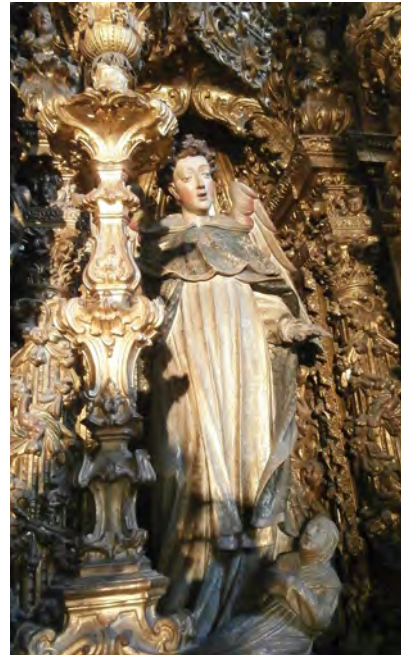
A youthful Saint Dominic at mid-height in the altarpiece of the Church of Jesus in the Dominican Convent of Aveiro.

De Tejada’s passage puts me in mind of a reading of devotional sculptures and paintings that lacks the formalism many of us in the field of art history have learned from a familiar ‘aesthetic’ stance. The richness of religious ‘gifts for the eye’ are in constant excess of what is needed to create ‘stunning’ simulacra, because the textured visual ensembles (polychrome processional body next to simpler images, next to rich ornamentation and architectural shape) were to be seen in their material presence as well. This is even true of the more pictorial among the sculptures. Facing Fernández’s Cristo Yacente , the believer might have counterbalanced the post-Tridentine spirit of desengaño del mundo (“removal of worldly deception”), where the mind struggles over the wounds of Christ, by a blissful thankfulness over the image’s patrons and carver, their magnanimous expenditure, and the good taste of the painter’s delicately painted mock-surfaces. 11 Indeed, the suggestion of fine embroidery