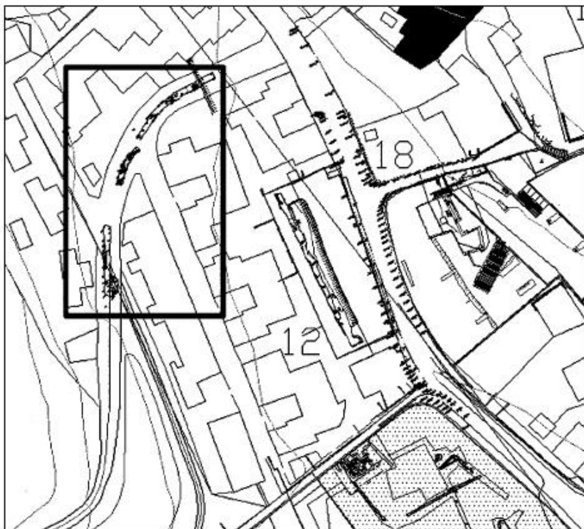
Fig. 3. Ubicación de las catas realizadas en la calle Barcelona

Algunos de los restos se encontraron mermados por toda una serie de riadas relacionadas con procesos post-deposicionales, así como por arrasamientos consecuencia de acciones antrópicas diversas (expolios, rebajes, nivelaciones, cultivos, etc.), acciones todas ellas cronológicamente posteriores a los niveles de abandono documentados para las distintas fases de ocupación.