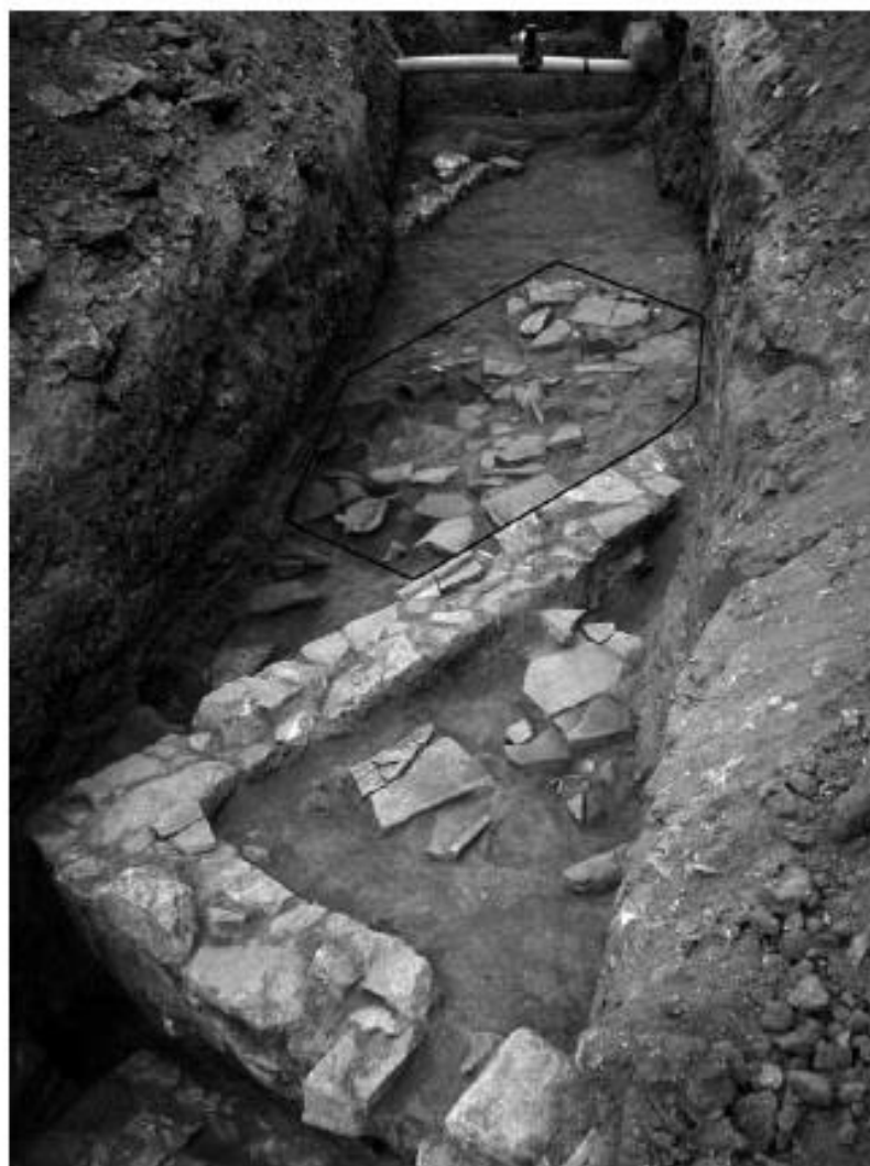
Fig. 5. Vista frontal de la cata y el derrumbe donde apareció la tapadera