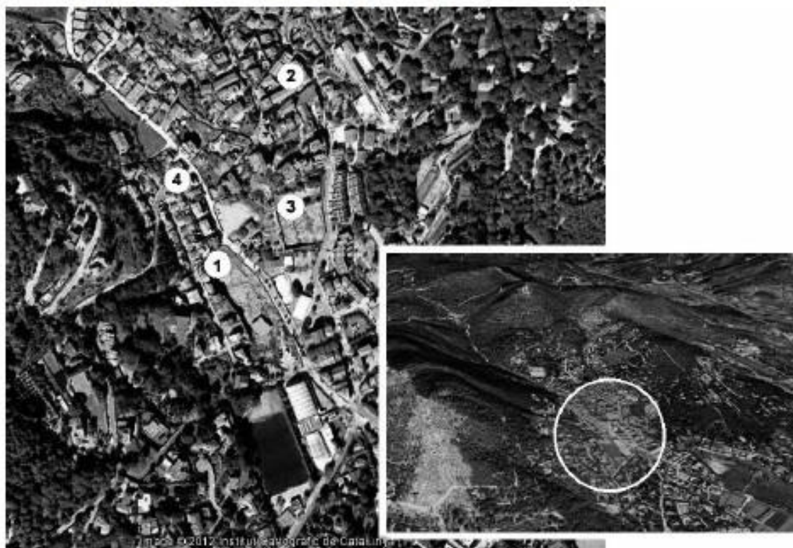
Fig. 2. Emplazamiento de la intervención en la calle Barcelona (4), en referencia a los principales centros productores próximos (1. Ca l'Arnau; 2. Can Pau Ferrer; 3. Can Rodon de l'Hort)