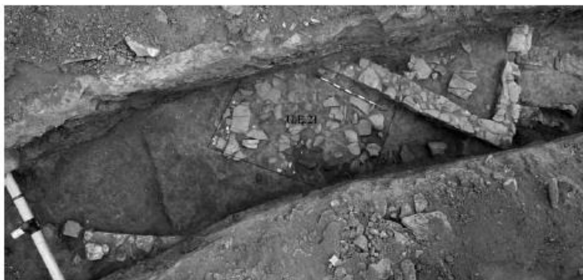
Fig. 4. Vista cenital de la cata y el derrumbe donde apareció la tapadera