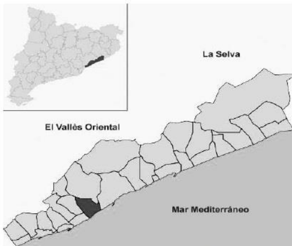
Fig. 1. Ubicación de Cabrera de Mar (en oscuro) en la comarca de El Maresme