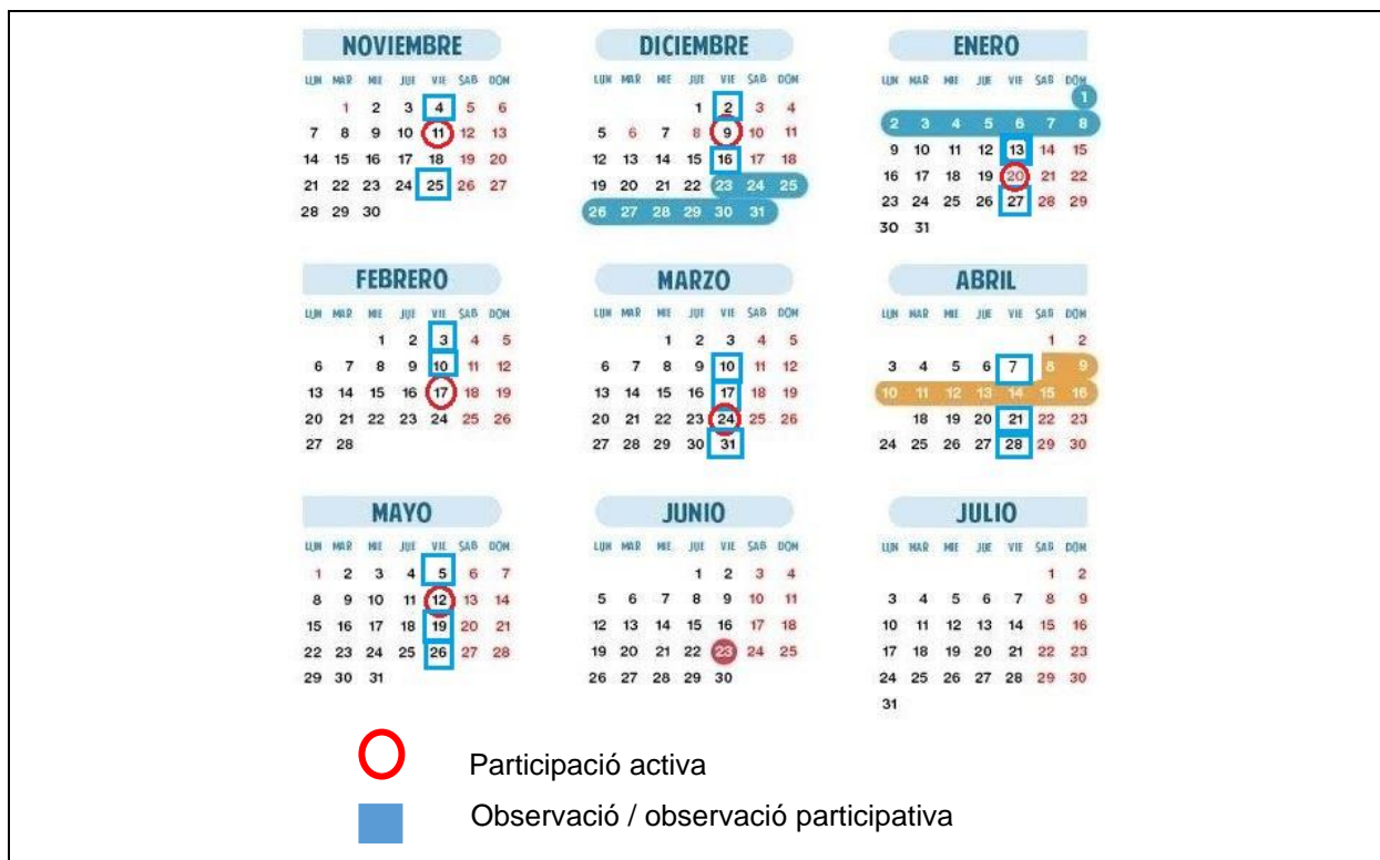
Figura 3. Calendari específic del procés d'observació per part de la investigadora.

Les participacions actives es pacten, amb antelació, amb la professional terapeuta i els membres del centre escolar. En aquest cas concret, els criteris que es van tenir en compte van ser: el benestar de l'alumna protagonista d'aquest estudi; el benestar de la resta d'alumnes; la compatibilitat horària; l'horari de les teràpies, així com la significativitat de les sessions. Aquest últim criteri de significativitat és el que més ha marcat les sessions, establint el següent calendari: