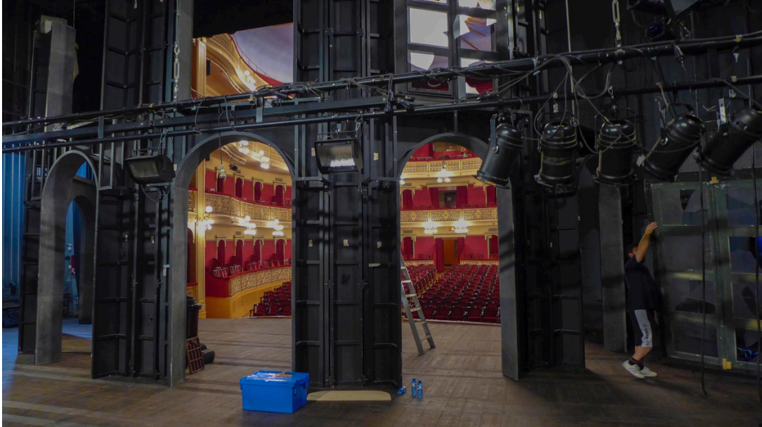
Constructores de mentiras efímeras, 2014

- Una fotografía desde el punto de vista opuesto, desde el punto central del foro 8 , en el interior de la caja escénica 9 , mostrando el trabajo de montaje o desmontaje y en un último plano la sala vacía.