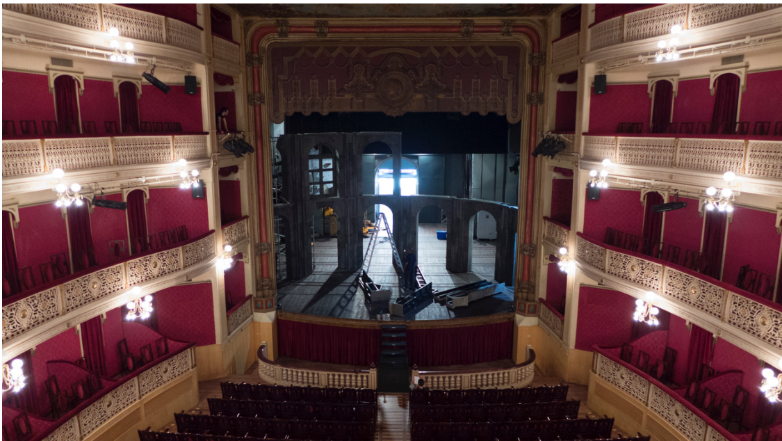
Constructores de mentiras efímeras, 2014

- Una fotografía mostrando todo el esplendor de la sala 4 , y en el escenario 5 el equipo técnico 6 realizando el montaje del montaje 7 o desmontaje de la escenografía o de las luces de el espectáculo.