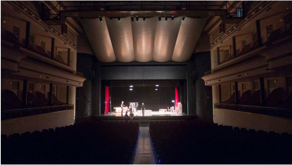
Teatro Jardí de Figueres, Ensayo técnico de “Infàmia” 2017

Durante el espectáculo, los técnicos de luces y sonido están en cabina tirando los efectos de la función. El regidor en el escenario coordinando el desarrollo del espectáculo. Lo que ocurre en el back-stage durante la representación del espectáculo es una función paralela a la que se representa en el escenario. La función complementaria que el publico no ve pero imprescindible para que el público pueda ver lo que está viendo.