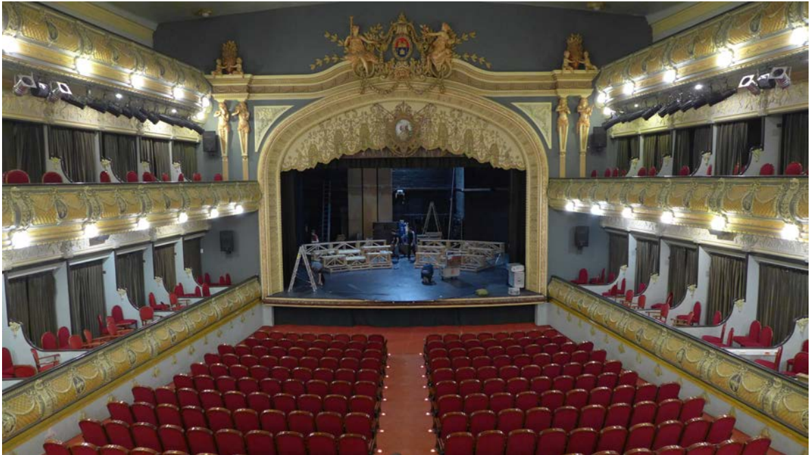
Constructores de mentiras efímeras, 2016

En mis imágenes muestro las butacas vacías. Las mismas butacas donde hacia apenas cinco minutos se sentaba un publico entusiasta aplaudiendo a unos actores reconocidos. Aunque en todas siempre aparece en la escena la representación paralela del montaje y el desmontaje. Un espectáculo que se inicia antes de que el primer espectador tome asiento o después de que el último espectador abandone la sala. Es entonces, cuando se vuelve a levantar el telón 10 y entran en escena un buen numero de trabajadores de diferentes rangos salariales y responsabilidades dispuestos a vaciar el escenario y cargar el trailer que transporta las escenografías en un tiempo record. A diferencia de los actores, que si tienen su convenio laboral establecido y se cumple a raja tabla, en el sector técnico el convenio y su cumplimiento es mucho más elástico, por decirlo de alguna manera. Será porque el público no los aplaude que la situación laboral en este sector es mas precaria?