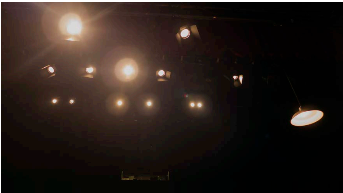
3 años, 4 producciones y 40 teatros. Luces y cabina técnica, 2017

Podría ser mucho más extenso y abarcar imágenes de las 26 producciones en las que he trabajado durante estos 17 años.