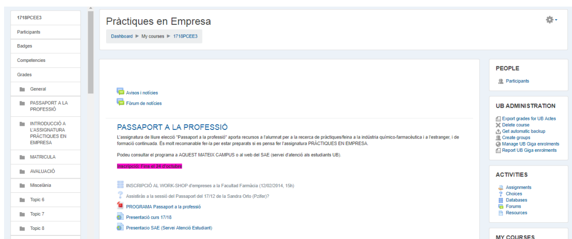
Imatge 1. Campus Virtual de l'assignatura Pràctiques en Empresa.