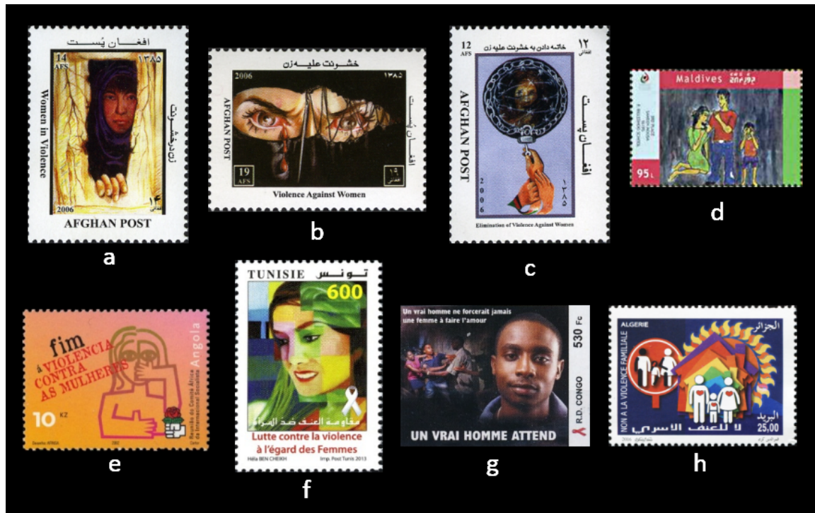
Figura 3. Sellos de Asia y África con imágenes de violencia contra las mujeres: a-c. Afganistán 2006; d. Maldivas 2010; e. Angola 2002; f. Túnez 2016; g. Congo 2005; h. Argelia 2016.