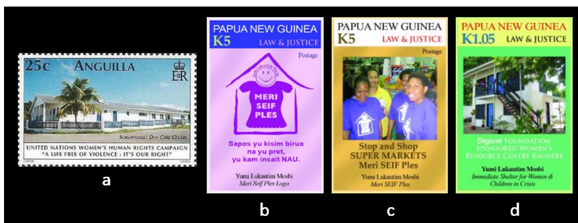
Figura 6. Sellos con recursos institucionales para la lucha contra la violencia hacia la mujer: a. Anguila 2001; b-d. Papúa-Nueva Guinea 2011.