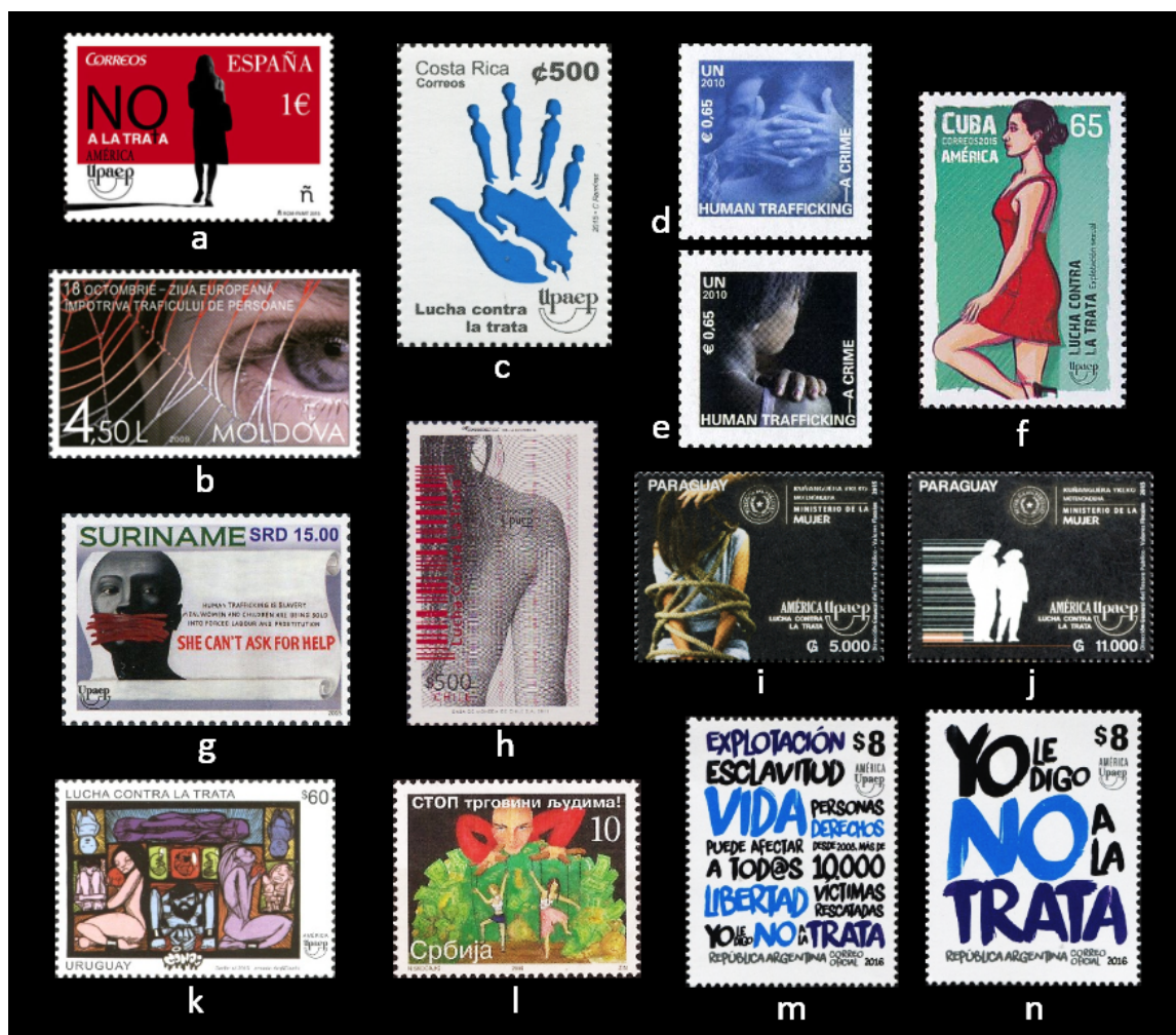
Figura 9. Sellos de trata de las mujeres: a. España 2015; b. Moldavia 2009; c. Costa Rica 2015; d. Naciones Unidas (Viena) 2010; f. Cuba 2015; g. Surinam 2015; h. Chile 2015; i-j. Paraguay 2015; k. Uruguay 2015; l. Serbia 2008; m-n. Argentina 2016.