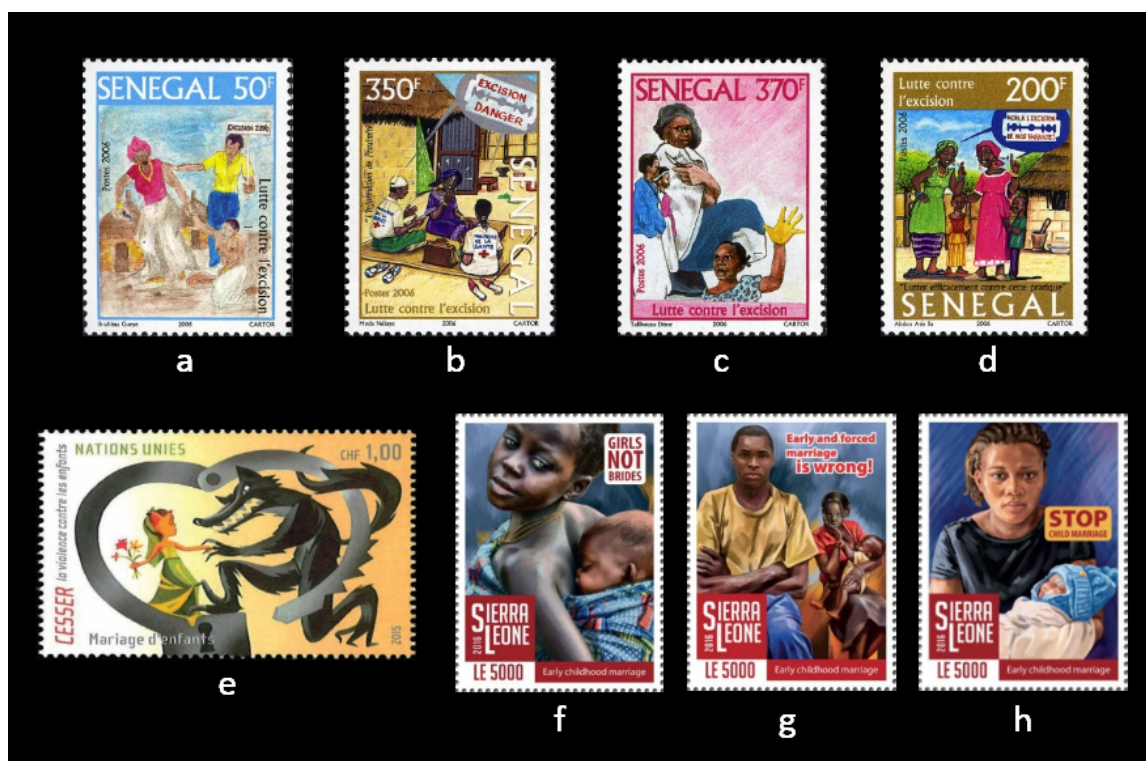
Figura 5. Sellos con escenas de la práctica de la mutilación genital femenina y el matrimonio precoz forzado: a-d. Senegal 2006; e. Naciones Unidas (Ginebra) 2015; f-h. Sierra Leona 2016.