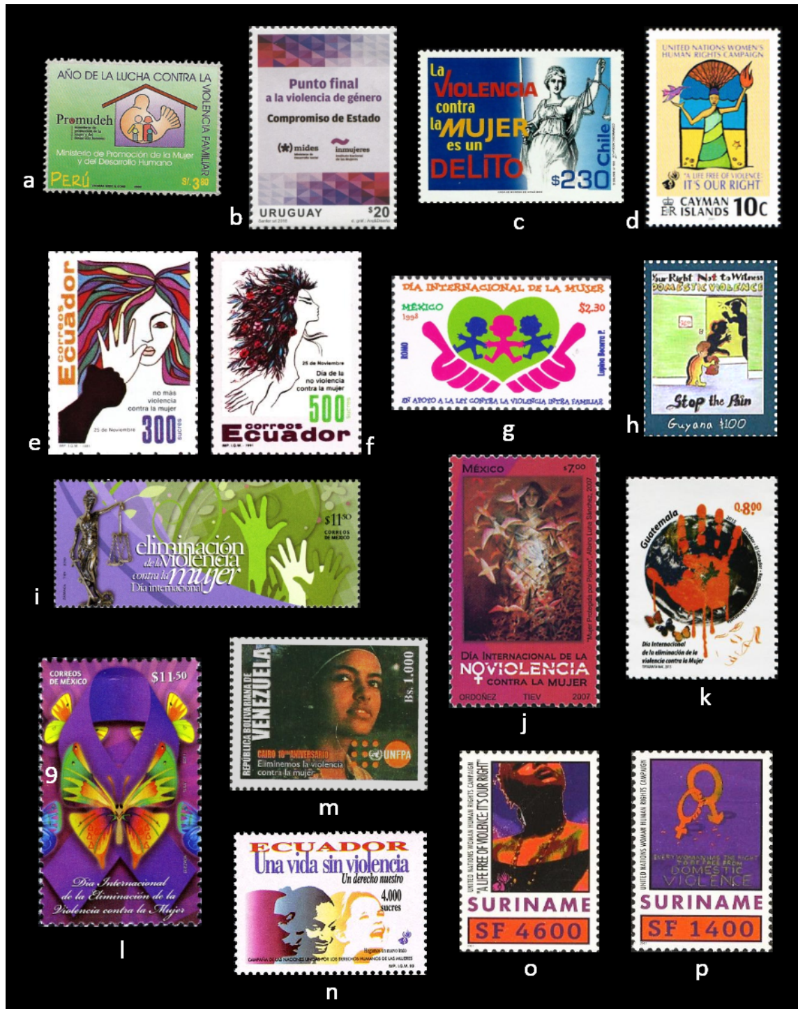
Figura 2. Sellos de América con imágenes de violencia contra las mujeres: a. Perú 2000; b. Uruguay 2016; c. Chile 2002; d. Islas Caimán 2001; e-f. Ecuador 1991; g. México 1998; h. Guyana 2010; i. México 2010; j. México 2007; k. Guatemala 2015; l. México 2011; m. Venezuela 2004; n. Ecuador 1999; o-p. Surinam 2001.