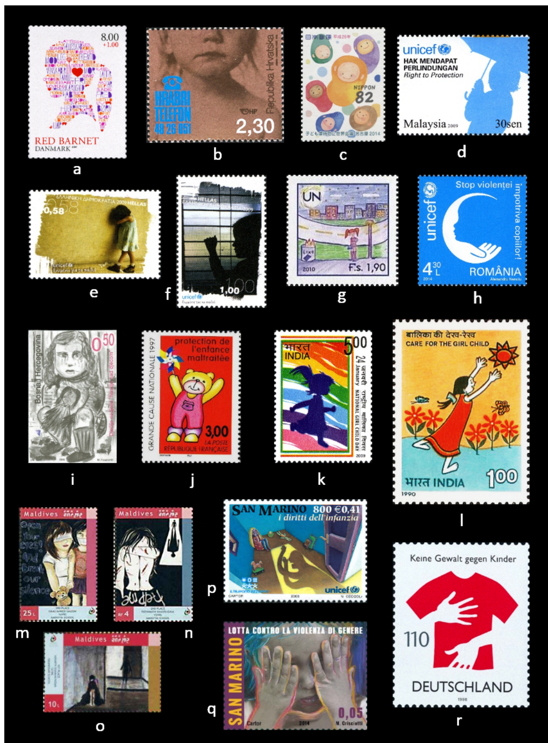
Figura 7. Sellos de Europa y Asia de violencia y trata infantil: a. Dinamarca 2013; b. Croacia 2001; c. Japón 2014; d. Malasia 2009; e-f. Grecia 2009; g. Naciones Unidas (Ginebra) 2010; h. Rumania 2014; i. Bosnia Herzegovina 2006; j. Francia 1997; k. India 2009; l. India 1990; m-o. Maldivas 2010; p. San Marino 2000; q. San Marino 2014; r. Alemania 1998.