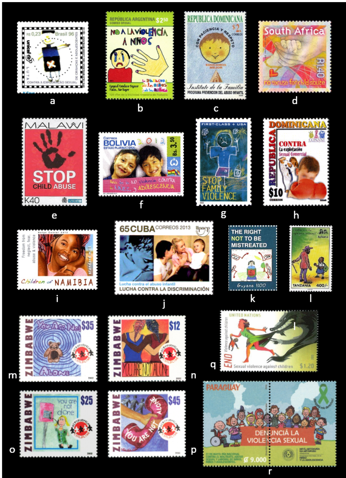
Figura 8. Sellos de América y África: a. Brasil 1996; b. Argentina 2012; c. República Dominicana 2000; d. Sudáfrica 2001; e. Malawi 2008; f. Bolivia 2012; g. Estados Unidos 2003; h. República Dominicana 2008; i. Namibia 2013; j. Cuba 2013; k. Guyana 2010; l. Tanzania 1998; m-p. Zimbabue 2002; q. Naciones Unidas (Nueva York) 2015; r. Paraguay 2016 (sello y bandeleta).