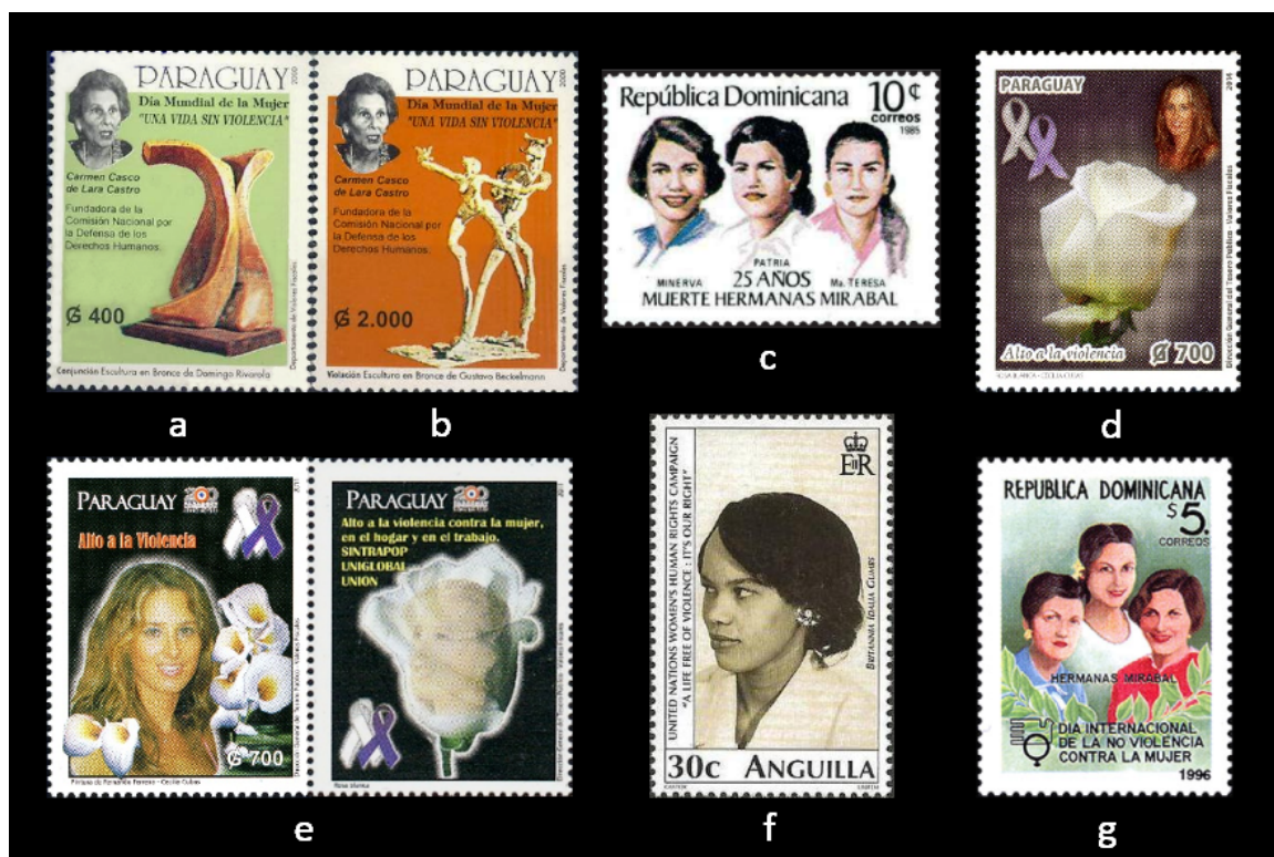
Figura 4. Sellos con personajes relevantes en la lucha contra la violencia hacia las mujeres: a-b. Paraguay 2000; c. República Dominicana 1985; d. Paraguay 2014; e. Paraguay 2011 (sello y bandeleta); f. Anguilla 2001; g. República Dominicana 1996.