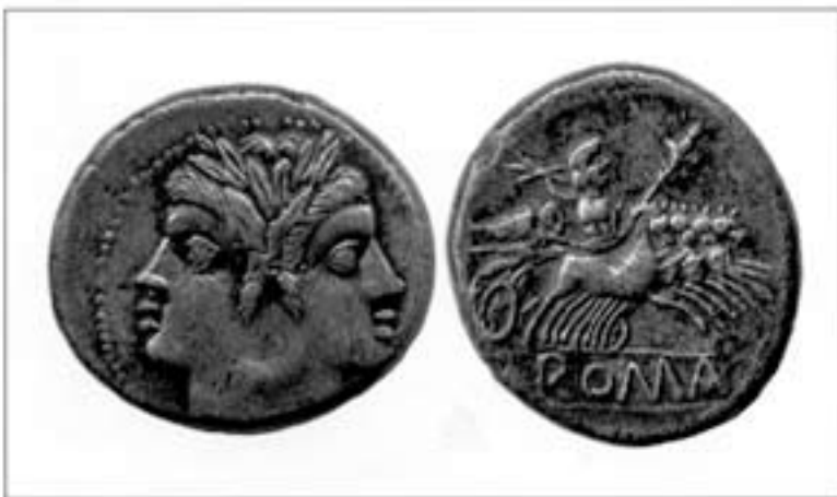
Figura 3. Quadrigat encunyat entre el 225 i el 212 aC recuperat a la Palma (l'Aldea, Baix Ebre).

Per una altra banda, les fonts escrites també mencionen una sèrie d'enfrontaments a la His-