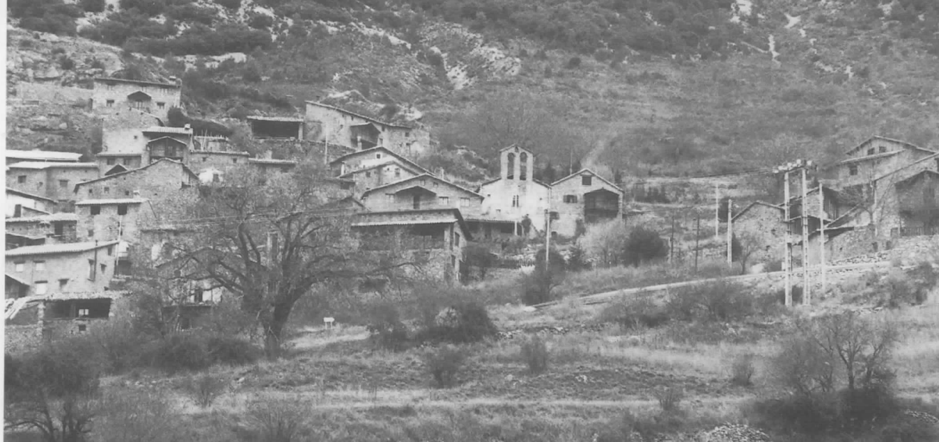
Vista general de Cornellana, amb l'església de Sant Pere.

petit. Ha anat disminuint en el curs dels anys, així l'any 1960 tenia 62 habitants. En 10 anys es redueix la població en un 42% -potser és la davallada més gran, en torna a perdre 5 durant els anys 70 i 4 més fins a l'actualitat en què trobem 17 habitants. És a dir, des de l'any 1960 ha perdut 1,2 habitants anuals. Alguns estiuejants han comprat i renovat cases velles.