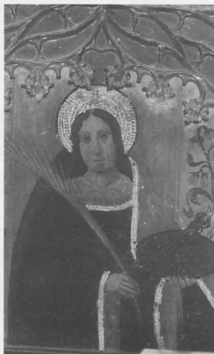
Santa Apol.lònia, a la part baixa del retaule.

Retaule de l'altar, dedicat a Sant Pere.