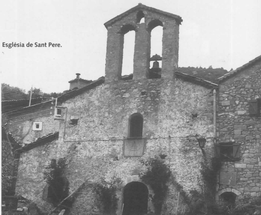
Església de Sant Pere.

En algun moment no determinat del segle XVII es construiria l'església actual, ja dins del poble, i es convertiria en parròquia, tot i que actualment depèn de la de Fórnols. De l'anterior se'n van