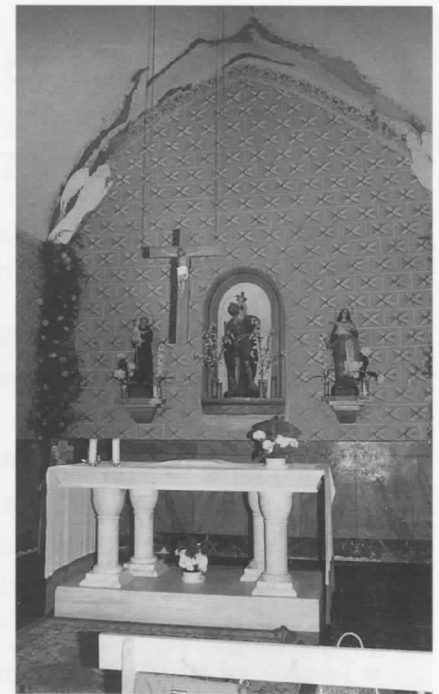
Interior de l'església

La parròquia de la Rabassa, junt amb les de Freixenet de Segarra, Sant Domí i Sant Guim de la Rabassa, són esmentades en documents dels segles XI i XII. La situació que en fa Gavín és: església sufragània (ES), 390 (mapa cadastral), 5°04:1”(latitud) i 41°38'50” (longitud). L'església, dins del poble, està dedicada a Sant Cristòfol i depèn de la parròquia de Santa Maria de Freixenet de Segarra, des del segle XVII.