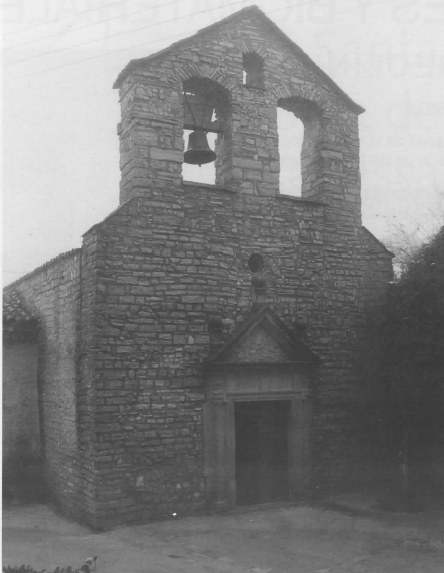
Façana amb el campanar

certs períodes inclou el terme de Palamós, d'entre elles gairebé tots els veïns eren pagesos. L'any 1900 n'eren 20, l'any 1920 n'hi havia 23, l'any 1930 en tenia 22, i actualment en són 8. Té un cens de 22 habitants, població que ha disminuït en el curs dels últims anys. L'any 1970 tenia 48 habitants i en 16 anys es redueix la població en un 54 %, és a dir, en aquest temps ha perdut 1,6 habitants anuals. Consten els noms dels 9 caps de família que tenien vassallatge l'any 1350: Romeu Ferran, Bernat Moragues, Arnau Mulet, Bernat Robiola, Arnau Sala, Pere Serralló, Jaume Simon, Mateu Tortosí i Ferrer del Vall. A Casa Sala s'hi conserva el Llibre de Comptes i Entrades i Eixides que diu: