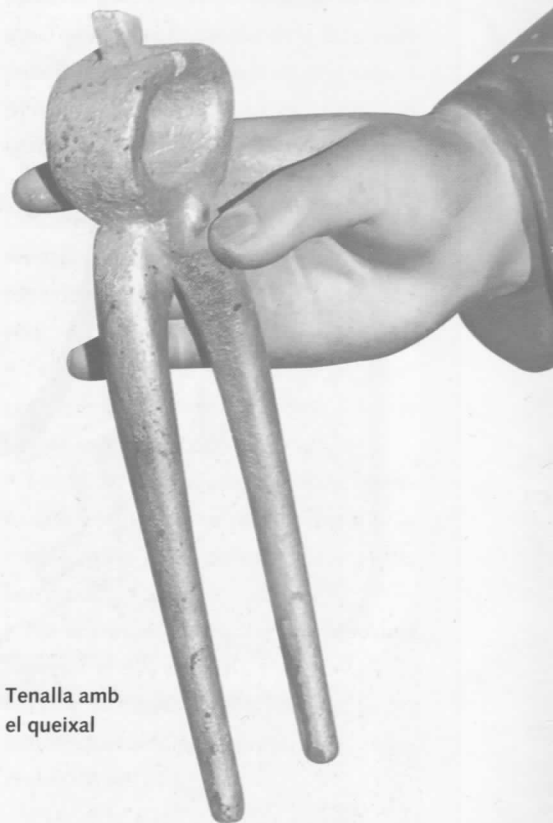
Tenalla amb el queixal