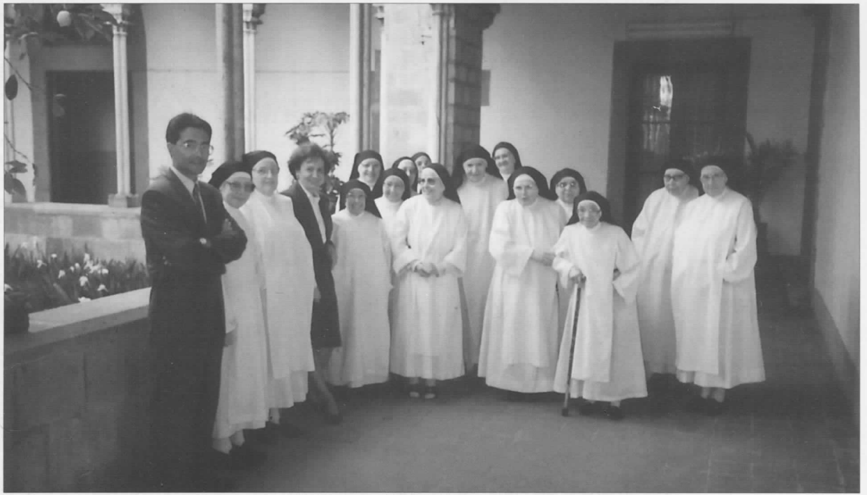
Les Germanes Dominiques amb la Presidenta d'Honor i el Confrare Major, al claustre del Monestir (1991).

cadores, dit de Sant Pere Màrtir, de l'Orde de "Santo Domingo" gràcies, entre d'altres, a qui arribaria a ser Cardenal l'any 1356, Fr. Nicolàs Rosell i al rei, Pere el Cerimoniós. Ell en va posar la "primera pedra", el dia 1 d'agost de 1351, a la zona del Mas d'en Bissanya, a les Drassanes, aleshores fora de la ciutat de Barcelona.