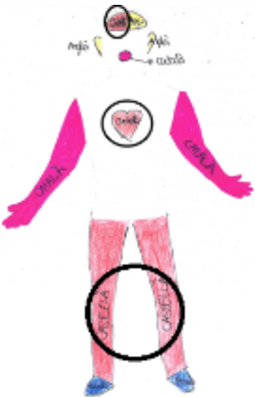
Fig. 6. Distribución de la L1 en el autorretrato lingüístico

Esto se plasma en la representación a través de la ubicación de la L1 en el corazón, la mente y en el centro. Estas creencias se relacionan con la CB 5 de la narrativa escrita, que habla de las diferencias entre los usos de la L1 y la L2.