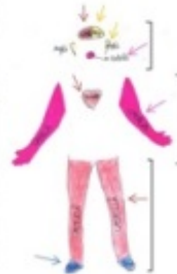
Fig. 3. Ejemplo de análisis de un aspecto de la narrativa visual