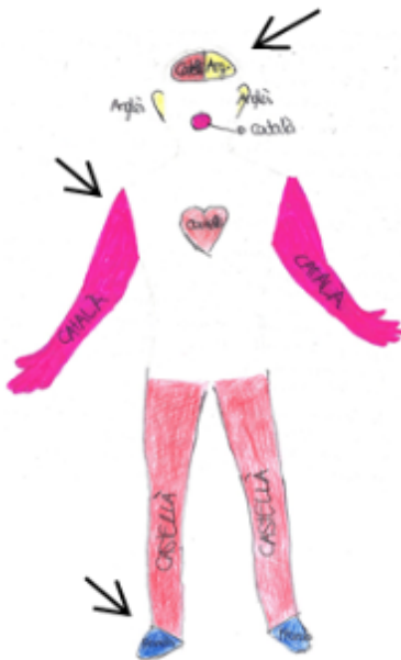
Fig. 5. Uso simbólico de las líneas para delimitar la extensión de cada lengua

En la narrativa visual se observa a través de las líneas divisorias que delimitan el abasto de cada lengua. Estas creencias se corroboran con la CB 2 del relato, en la que el sujeto manifiesta que en su futura profesión tendrá que ser un hablante ideal y una buena referente para sus alumnos. No obstante, se contradicen con la CB 6 de la narrativa escrita, porque en ella se afirma que una lengua es imposible de dominar por su extensa dimensión y su constante evolución.