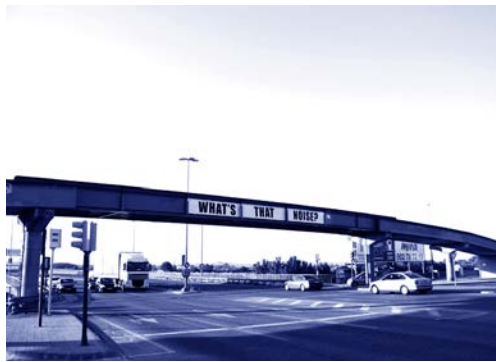
Alumnes de l'Escola Marina de Montgat La ciutat imaginada, Experimentem amb l'art, Barcelona, 2018