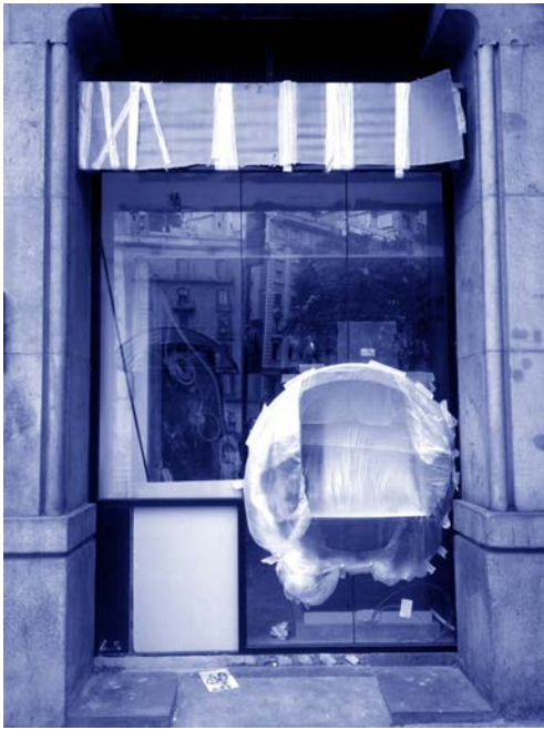
Font desconeguda Barcelona, 2018