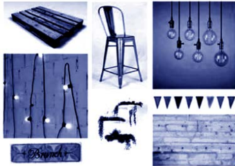
Museo De Los Desplazados ("Gentrificación no es un nombre de señora") Data i hora: 28 agost 09:06 ·