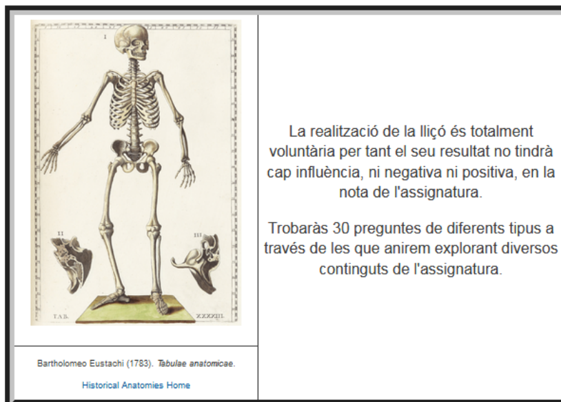
Fig. 3. Portada de la Lliçó corresponent al Bloc 3.