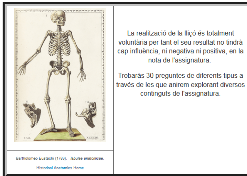
Fig. 1. Portada de la Lliçó corresponent al Bloc 1.

El curs acadèmic 2016/2017 s'implementà la Lliçó del Bloc 2 (fig. 2). Els estudiants van realitzar la Lliçó del Bloc 1, que havia estat implementada el curs anterior, i aquesta nova lliçó. En ambdós casos se'ls va donar accés a l'eina després d'haver vist la matèria en les classes presencials.