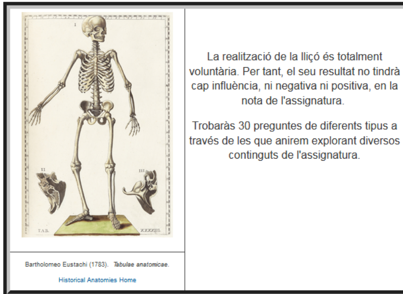
Fig. 2. Portada de la Lliçó corresponent al Bloc 2.

Per últim, el curs 2017/2018, s'implementà la tercera lliçó corresponent a Bloc 3 de l'assignatura (fig. 3). En aquest darrer curs els estudiants ja van disposar de les tres Lliçons corresponents a tot el temari de l'assignatura. Com en els cursos precedents, cada lliçó s'activa un cop vistos els continguts corresponents a l'aula presencial.