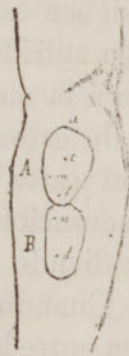
FIG. 52. — Dos círculos de sensacion contiguos segun Bernstein.

Se han ideado varias teorías para explicar la naturaleza del círculo de sensacion : segun unos, cada círculo está inervado por una sola fibra nerviosa, y ésta jamas traspasa la region á cuya sensibilidad preside. Esta teoría es inadmisibile, toda vez que un mismo círculo de sensacion cambia de extension en un individuo, segun esté distraido ú atento ; la atencion lo reduce y la distraccion lo amplía.