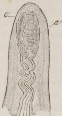
FIG. 49. — Corpúsculos de Meissner en una papila. — a , corpúsculos; b , entrada del nervio en la papila; c , su terminacion, no bien conocida.

corresponden á la palma de las manos y á las plantas de los piés, se encuentran unos corpúsculos ovoideos, estriados transversalmente, llamados por Wagner y Meissner, corpúsculos del tacto .