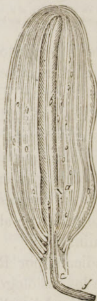
FIG. 50. — Corpúsculo de Pacini: a , cápsulas encajadas formando la base del corpúsculo; b , cápsula central, inmediatamente aplicada sobre el tubo nervioso, formándole una vaina eontinua con el neurilema del pedículo; c , d , pedículo del corpúsculo formado por un tubo nervioso y su neurilma; e , tubo nervioso que termina en el corpúsculo.

Ademas de los corpúsculos del tacto, se encuentran en algunos puntos del tejido celular subcutáneo otros abultamientos algo mayores, de tres ó cuatro milímetros poco más ó menos, llamados corpúsculos de Pacini , en cuyo interior se distribuyen los filetes nerviosos perdiéndose en una especie de esferilla de materia granulosa.