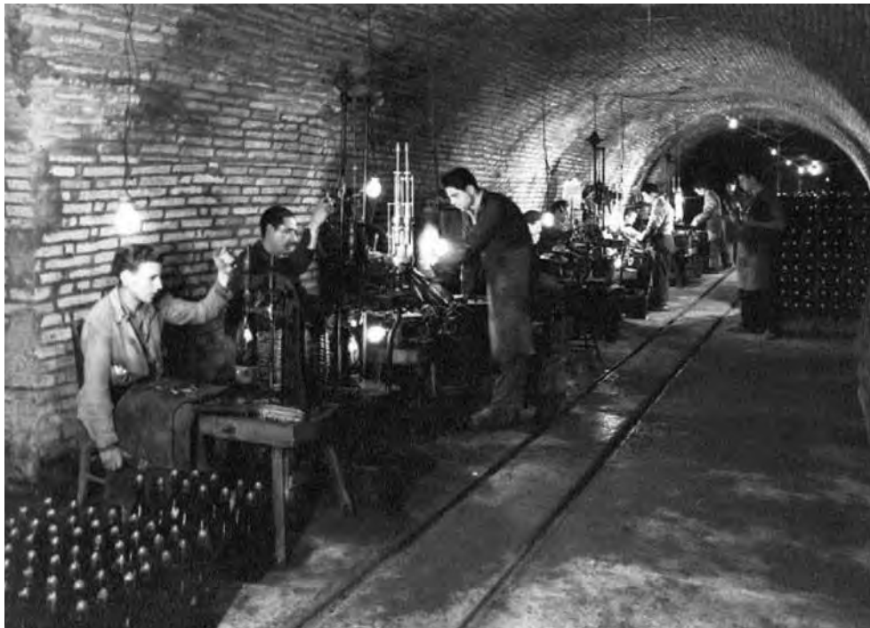
Figura 7. Interior de les caves Gomà.