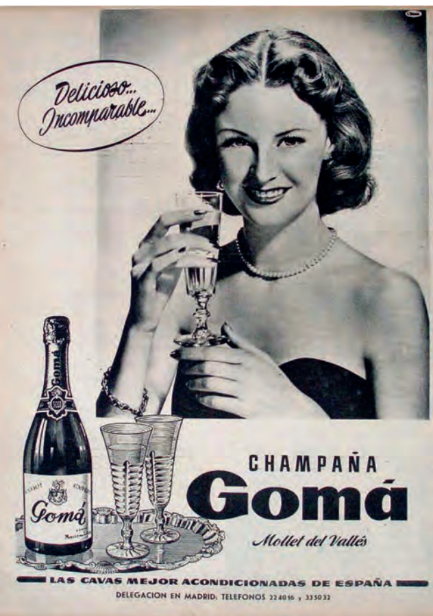
Figura 8. Anunci del xampany Gomà publicat a la revista Semana de Madrid el 7 de juny de 1952.