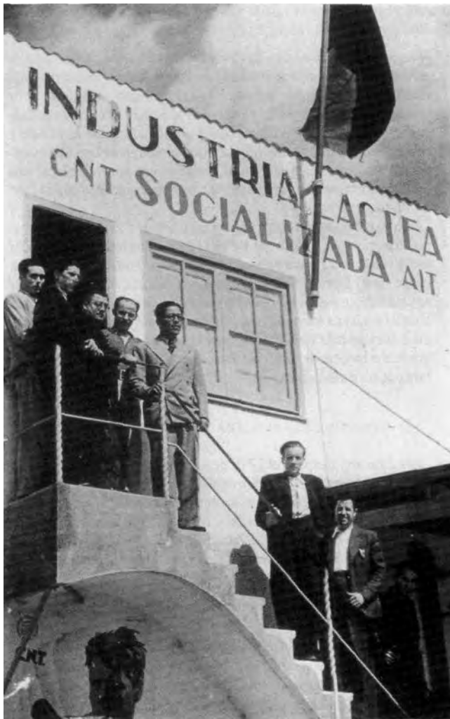
Figura 4. Visita del cònsol de Mèxic a la Central Lletera de Mollet del Vallès, el 13 d'agost de 1937 Foto: Pérez de Rozas. Arxiu fotogràfic de l'Arxiu Històric de la Ciutat de Barcelona, CG 1937-386

Durant la Guerra Civil, les empreses de Barcelona que tractaven la llet que venia de les zones productores properes van ser col·lectivitzades i van quedar fusionades en la Indústria Làctia Socialitzada. La seva unificació també va comportar la reorganització dels serveis de recollida i transport de la llet, i es van crear diferents centres de refredament, un d'aquests Mollet del Vallès. Va començar a funcionar el 8 de juny de 1937 i refredava 9.381 litres de llet diaris, procedents de 207 productors que, en conjunt, posseïen 2.364 vaques. A més de Mollet i Gallecs, aquest centre rebia llet de Parets del Vallès, Lliçà d'Amunt, Lliçà de Vall, Palau-solità, Santa Perpètua de Mogoda, Montcada i Reixac, la Llagosta,