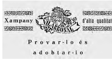
Figura 6. Etiqueta del xampany Vilarrosal.