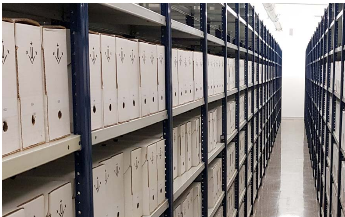
Mòduls d'emmagatzematge GEPA