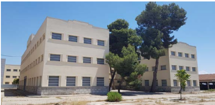
Edifici del GEPA