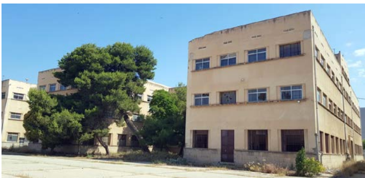
Edifici adjacent desocupat, amb les mateixes dimensions i estructura

Projecte d'ampliació del GEPA: caserna adjacent (Ajuntament de Lleida)