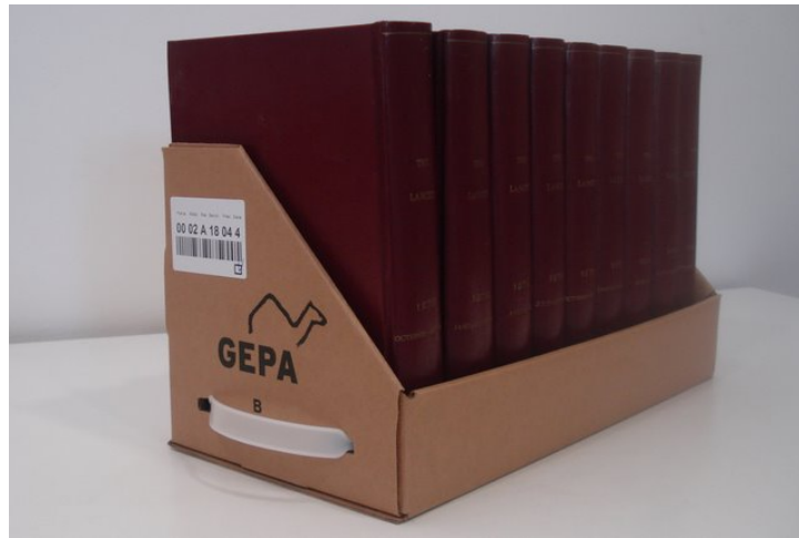
Emmagatzematge en compacte