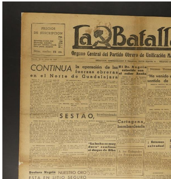
Exemplar del 25 de maig de 1937

A partir d'aquests fets, la persecució dels comunistes contra el POUM es va intensificar, amb molts dels seus dirigents i afiliats detinguts, incloent Andreu Nin, que va ser executat per la policia soviètica.