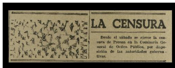
Anuncis de la censura governamental a 11 de maig de 1937