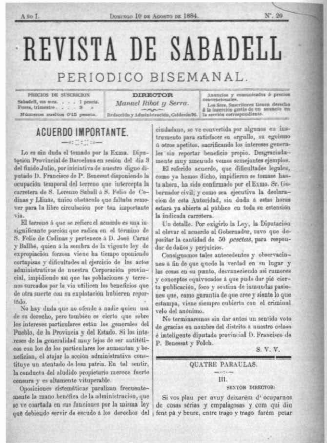
Figures 2 i 3. Los Desheredados (7.10.1882) / Revista de Sabadell (10.08.1884).

La resposta, en la meua opinió, l'hem de cercar en les direccions que assenyalen les dates de la primera aparició de la premsa sabadellenca. Així és com quan a partir de la segona meitat del segle XIX els diaris comencen a ser més extensibles: les noves tècniques d'impressió (les quals fan augmentar el tiratge i disminuir-ne el cost), la incorporació de la publicitat i l'acceleració de la distribució a partir de l'arribada del ferrocarril —en el cas de Sabadell, a partir de 1855— la velocitat de la informació a través del telègraf i a partir de 1900 el telèfon etc. En definitiva, el que seria l'inici de la premsa moderna fins als nostres dies i que el present catàleg evidencia amb la diversitat de capçaleres i fonts periodístiques d'una ciutat com Sabadell, tan propera a la capital.