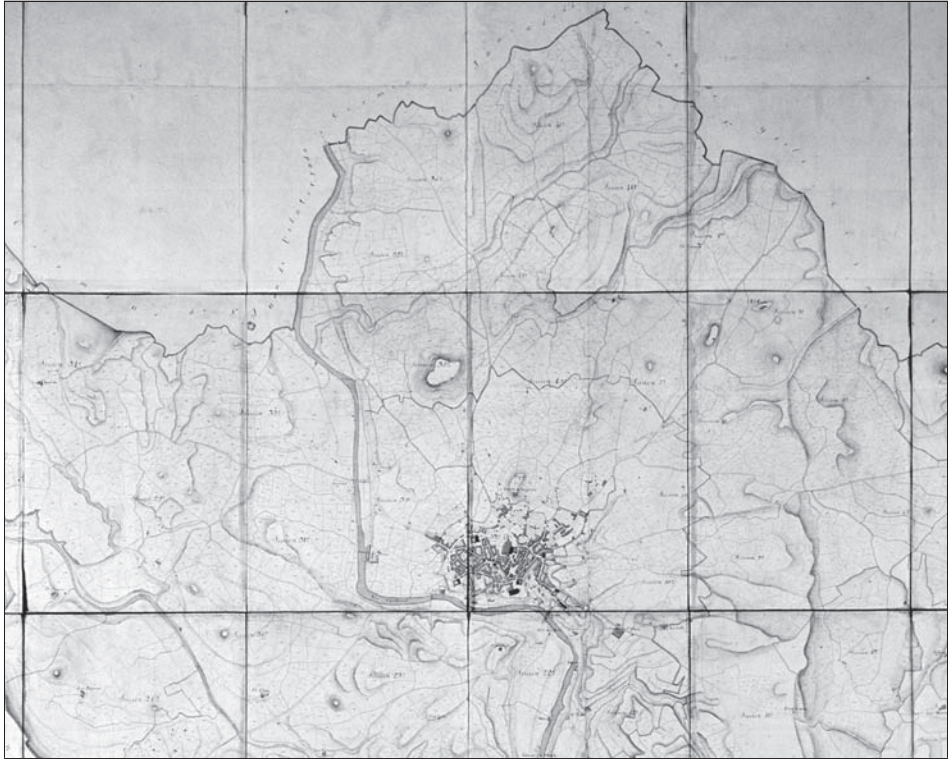
Figura 1 Fragment del [Plano geométrico del término municipal de Manresa, 1853]

La figura mostra la divisió del terme municipal en seccions cadastrals, corresponents a la seva part central i septentrional. Les 44 seccions d'aquest document resten numerades en el sentit de les agulles del rellotge. Entre els elements clarament visibles del plànol geomètric de Manresa destaquen el nucli urbà de Manresa, la divisió parcel·laria i el relleu amb normals, a més de la xarxa hidrogràfica i diferents elements planimètrics. Inclòs a Ayuntamiento de Manresa. Matriz primitiva de propiedades territoriales, urbana y ganadería de Manresa, 1853 . Arxiu de la Corona d'Aragó. Hisenda Ter-P nº 718.