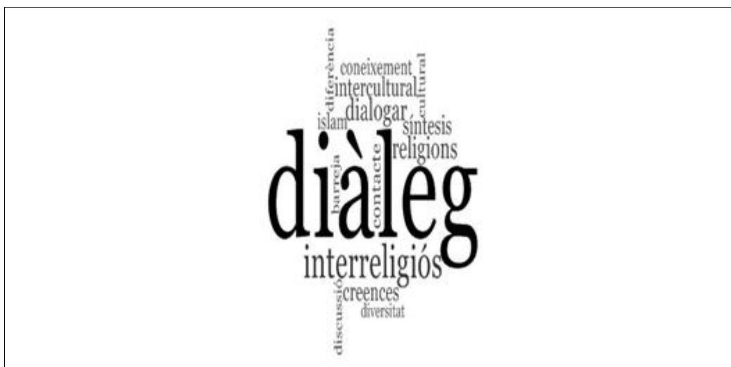
Figura 3. Núvol de paraules més rellevant de la definició de diàleg interreligiós

paraules amb les més rellevants per conceptualitzar i definir aquest concepte a les entrevistes (figura 3).