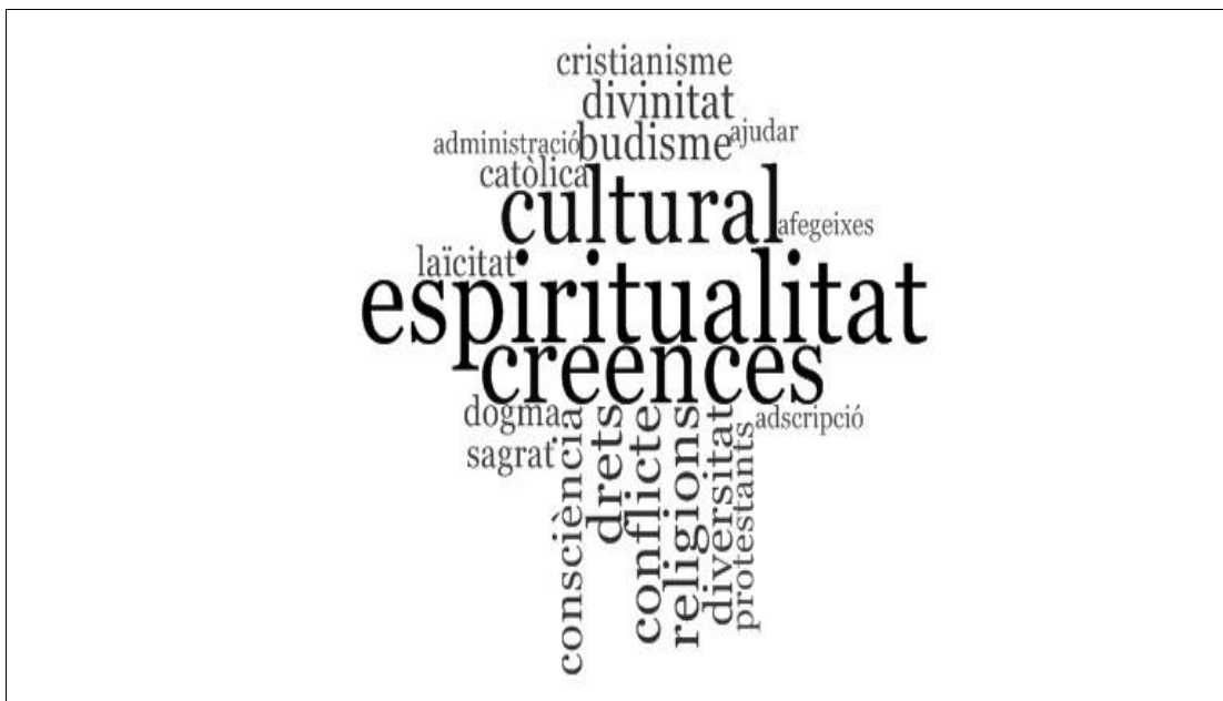
Figura 2. Núvol de paraules més rellevant de la definició de religió