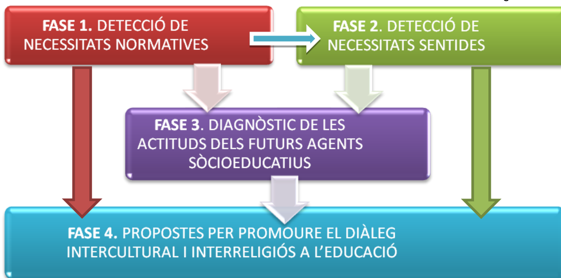
Fig. 1 Disseny metodològic

A continuació es desenvolupen els continguts de cada una de les quatre fases de la recerca: