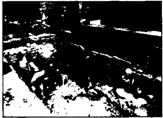
Excavació al Jardí de la Casa Balmes. 1984.

Excavació realitzada l'any 1984 al jardí de la casa situat arran de la muralla. Han aparegut estructures d'hàbitat corresponents als segles XVI i XVII. Donada la quantitat de sediments (uns cinc metres), cal esperar en properes campanyes restes medievals i potser romanes en els nivells inferiors.