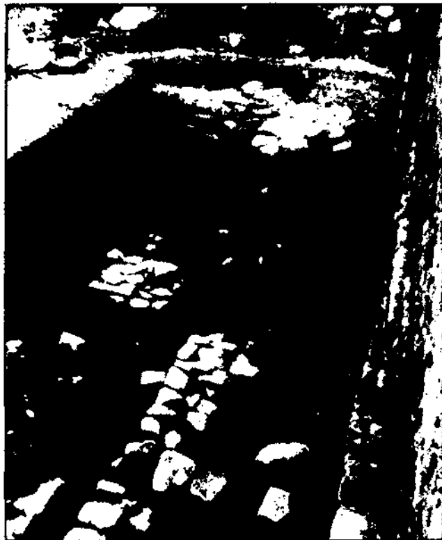
Casa Balmes, 1984. Nivells segles XVI-XVII en curs d'excavació.

L'excavació del carrer del pare Xifré (juliol-agost 1984), portada a terme d'acord amb la secció d'obres de l'Ajuntament, que havia de fer una nova pavimentació, ha permès recuperar els fonaments del mur frontal del peribol del Temple Romà. L'excavació de la Plaça de la Pietat proporcionarà, possiblement, la continuació d'aquest mur del pati que tancava el temple.