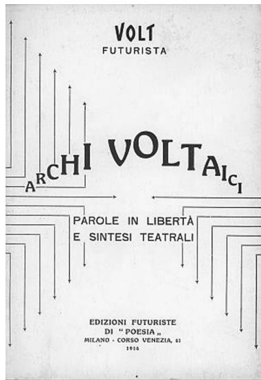
FIGURA 1. Coberta d' Archi Voltaici (1916) de Volt.

l'«analogia disegnatà» teoritzada per Marinetti. 7 També Salvat recorre a la disposició arquejant, però la icona presenta trets diferents: l'arc de Volt, culminant en la rodona de la O es conjuga, i alhora contrasta, amb l'efecte de trencament de la corba provocat per la disposició esglaonada de cada caràcter, que n'evidencia els trets cantelluts i la verticalitat dels pals, i és reblat per un fons de fletxes que formen angles rectes traçats l'un dins de l'altre. Salvat, en canvi, es decanta pel predomini del traç corb, en sintonia amb el dibuix de Miró que il·lustra la portada de la revista, i a més aprofita només el segon mot per compondre la meitat esquerra d'un arc. L'estètica del títol s'apropa més aviat a la coberta d'un altre llibre futurista, la de Ponti sull'oceano de Folgore.