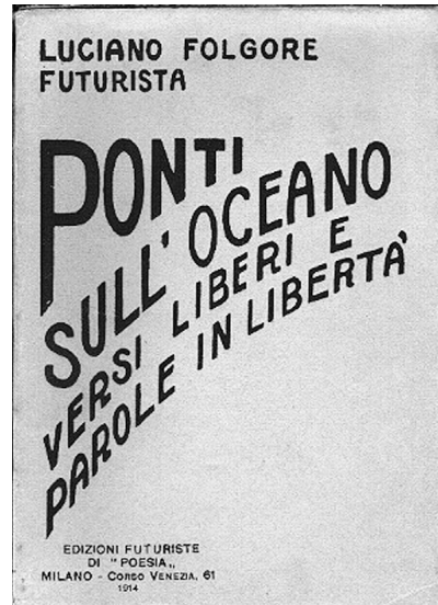
FIGURA 3. Coberta del llibre Ponti sull'oceano (1914) de Luciano Folgore.

l'«arc-voltaic» salvatià, és el guionet que uneix els dos mots i que sembla tenir sobretot una funció visual més que no pas sintàctica, ja que desapareix en reprendre la tradicional disposició lineal en el poema «Vespreja i neva» de L'irradiador . No és de més precisar que l'escriptura aglutinada, que Salvat prefereix a la forma canònica, separada, que fa servir per exemple Folgore en «Capvespre», per bé que recordi les paraules dobles teoritzades per Marinetti, no hi és pas assimilable, perquè aquest creava, amb guionets, parelles de substantius com a sistemes d'analogies immediates (com Salvat fa d'altra banda amb els «estels-oronells» del poema «Vibracions»), mentre que en aquest cas el guió fon el nom amb el seu determinant, de la mateixa manera que ho feia en l'expressió «Mots-propis».