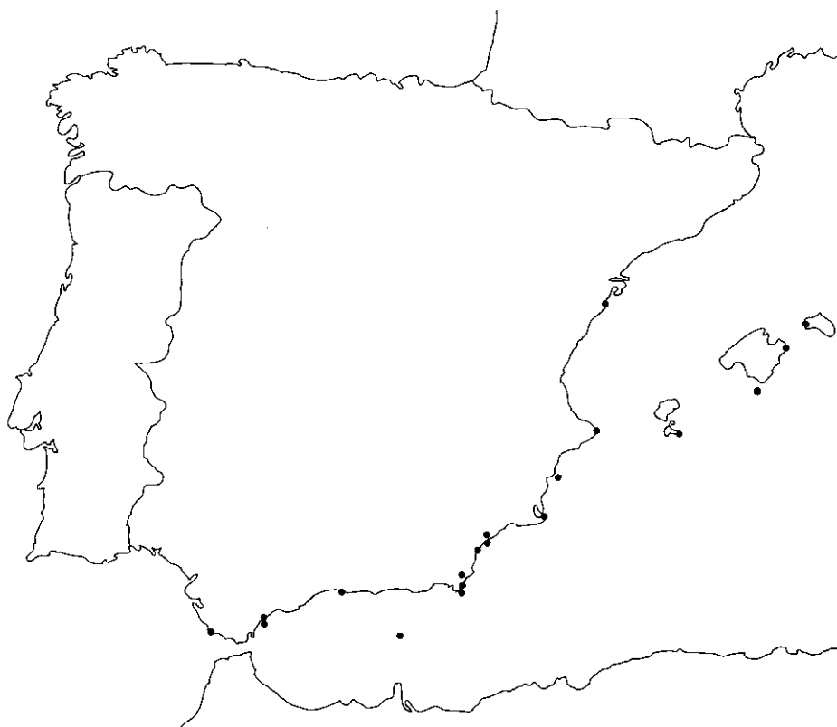
Mapa 3.—Distribución de Zonaria tournefortii en la Península Ibérica e Islas Baleares..