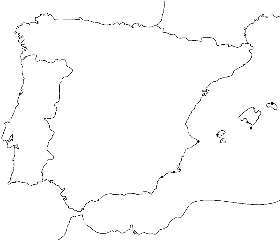
Mapa 1.—Distribución de Lobophora variegata en la Península Ibérica e Islas Baleares.

Map 1.—Distribution of Lobophora variegata in the Iberian Peninsula and Balearic Islands.