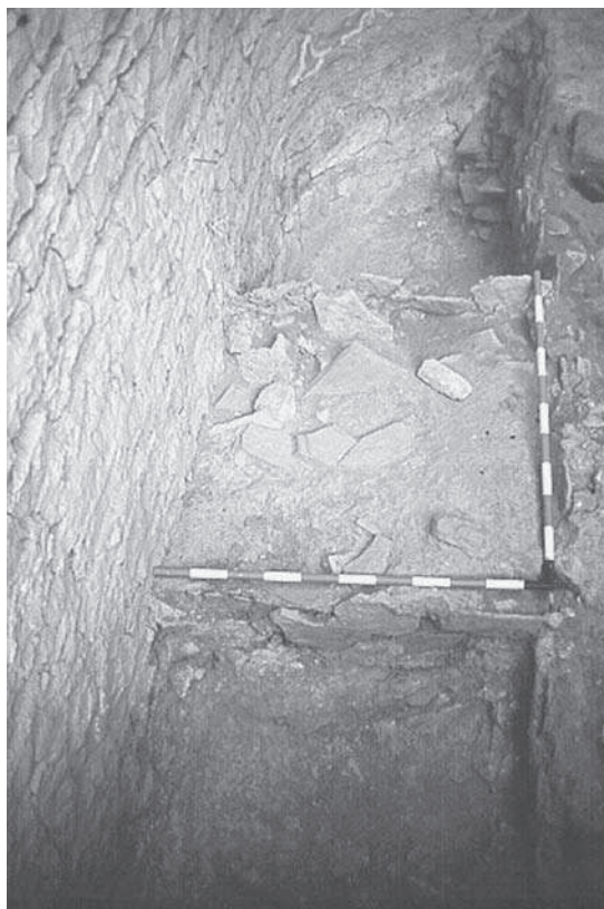
Figura 4. El graner del sector 500 en procés d'excavació.

ner i a l'altre. Al del sector 100 pràcticament no s'hi veu calç i la consistència és molt feble, fins al punt que no ens vam poder acostar als murets perquè eren molt fràgils. Els dipòsits del sector 500, al contrari, presenten una composició molt més rica en calç amb fragments de guix en estat mineral, la qual cosa els va fer més consistents, de manera que vam poder fer una excavació més completa consistent a buidar cada dipòsit gairebé del tot. 7 Com que no tenen cap orifici a la part baixa per facilitar-ne el buidatge, pensem que no devien estar més amunt d'1,5 m d'altura, la qual cosa devia permetre d'omplir i buidar els graners per dalt i, fins i tot, entrar-hi en cas de necessitat. Els arrebossats del fons i de les parets i el material amb què estan construïts devien assegurar les condicions òptimes d'humitat i temperatura per a la conservació del gra. Al sector 100, atesa la facilitat amb que s'inundava, hi ha un desguàs just abans dels dipòsits, els quals tenen la base en una plataforma de roca més elevada que no la cota de circulació del sector.