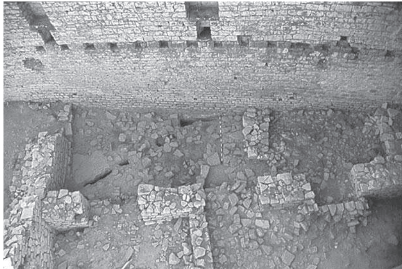
Figura 3. Vista dels sectors 300 i 400 des del camí de ronda. Es veuen els murs i els pilars que structuren aquest espai i els nivells d'enderroc del segle xv.