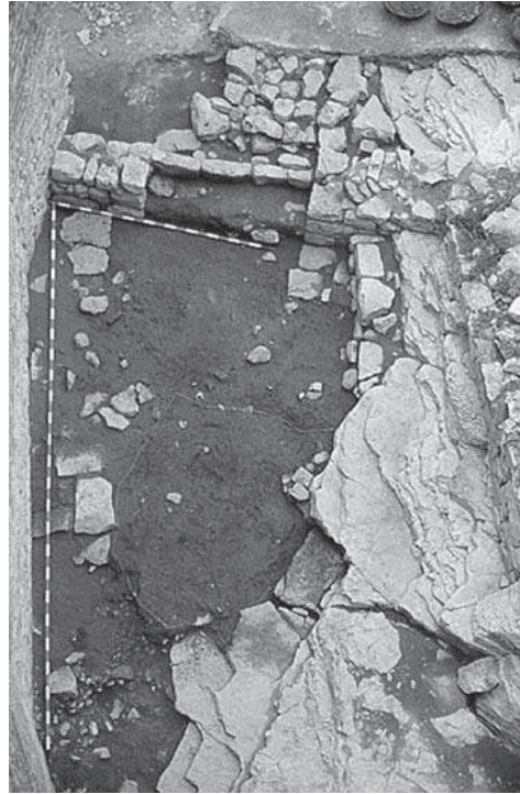
Figura 2. Vista general dels nivells d'ocupació del sector 100. Al fons es veu la porta una vegada aixecades les pedres que la tapiaven i les pedres del pati que situaven el nivell de circulació a l'altura de la roca.