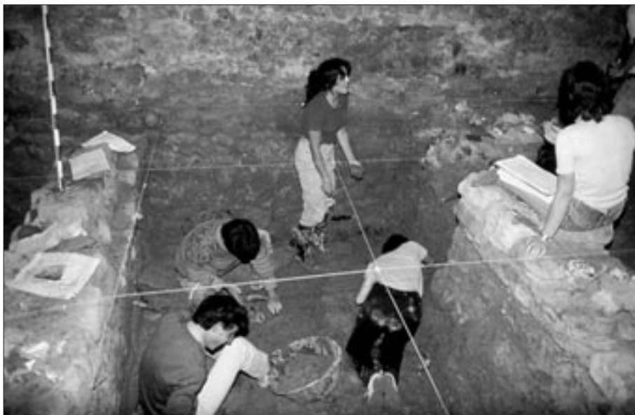
Primeres excavacions programades a Vic. Jaciment de la Taula, 1982-1983.

tat que els municipis respectius ho poguessin utilitzar per tal de respectar les restes. S'hi van acollir Girona, la Seu d'Urgell, Manresa i Vic, entre d'altres, cadascuna amb un equip universitari que hi treballava. 24 El resultat, memòries, plànols i mapes, fou entregat a l'Ajuntament de Vic el 1993 i està a la disposició de qualsevol ciutadà que ho vulgui consultar. 25 D'entrada, el PAU és una eina destinada a l'equip d'arquitectes, aparelladors i urbanistes que planifiquen la ciutat, de manera que es pugui consultar abans de realitzar qualsevol obra que afecti el subsòl. La decisió de si s'hi intervé arqueològicament o no és, doncs, en mans del consistori, però mai no es pot dir que s'ha trobat una resta inesperada enmig d'una obra situada i marcada al PAU, amb la consegüent paraltzació de les obres. Caldria fer sempre una intervenció prèvia, evitant així els inconvenients tant per a les empreses constructores com per als ciutadans, i salvant així la informació per a la ciutat. És evident que aquest programa afecta també les noves àrees de creixement urbà de Vic, sobretot la zona de Can Colomer Munmany, on hi ha prevista una urbanització sobre l'antiga necròpolis romana a la sortida sud de la ciutat.