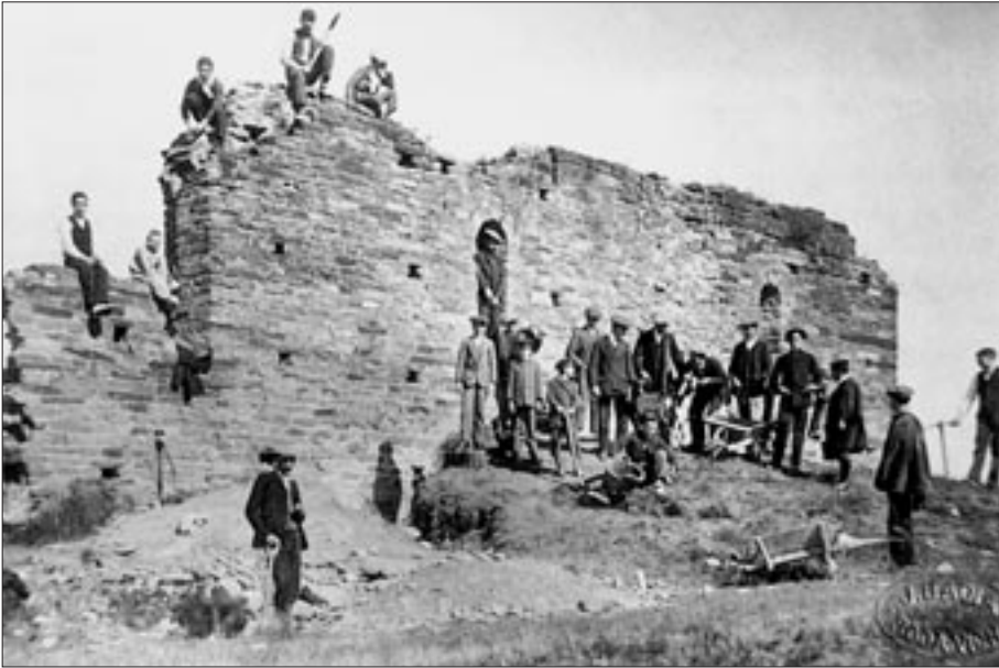
Un grup d'aficionats a l'arqueologia treballant a l'Esquerda l'any 1916.