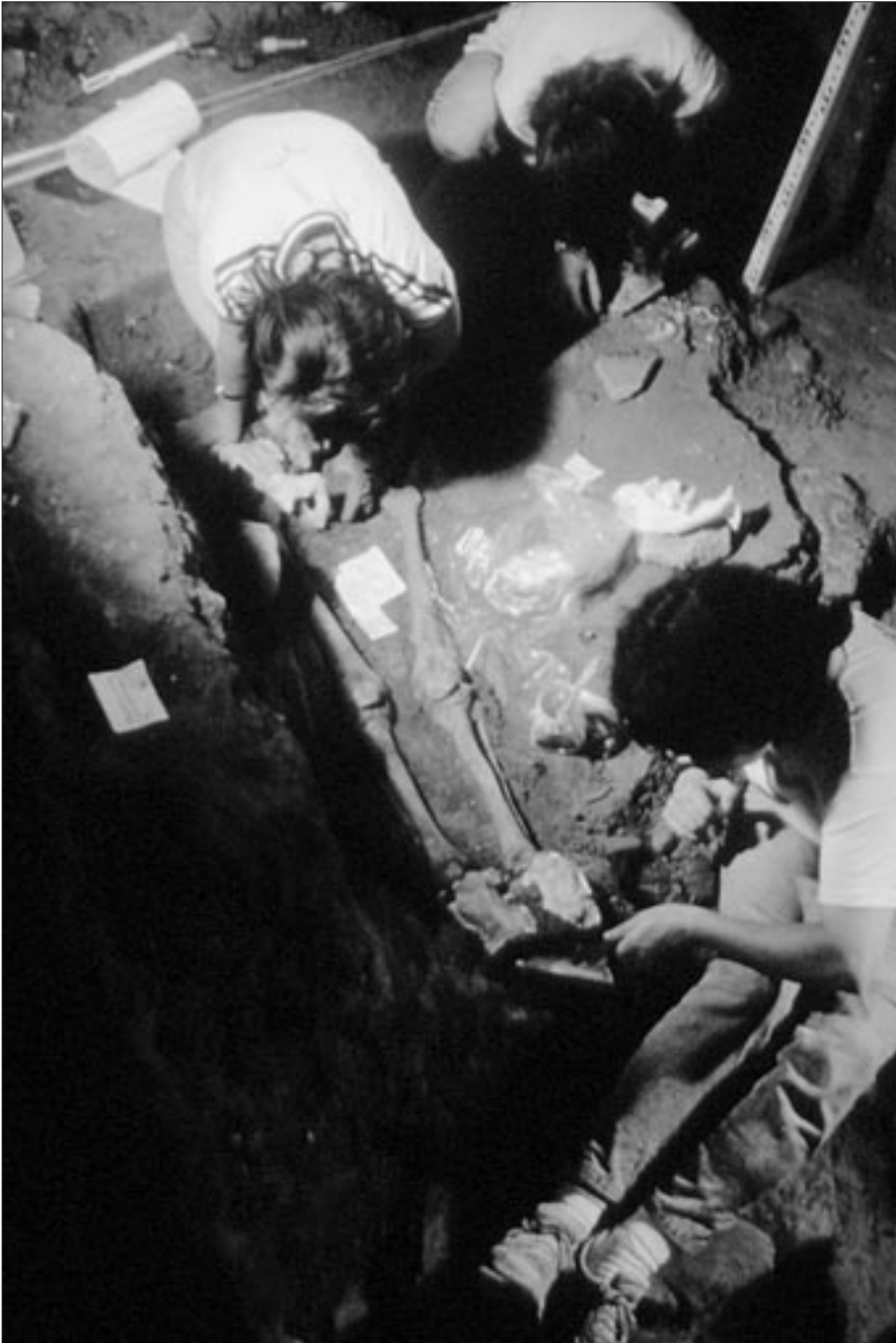
Campanya d'excavacions a la necròpolis de l'Albergueria, l'any 1990.