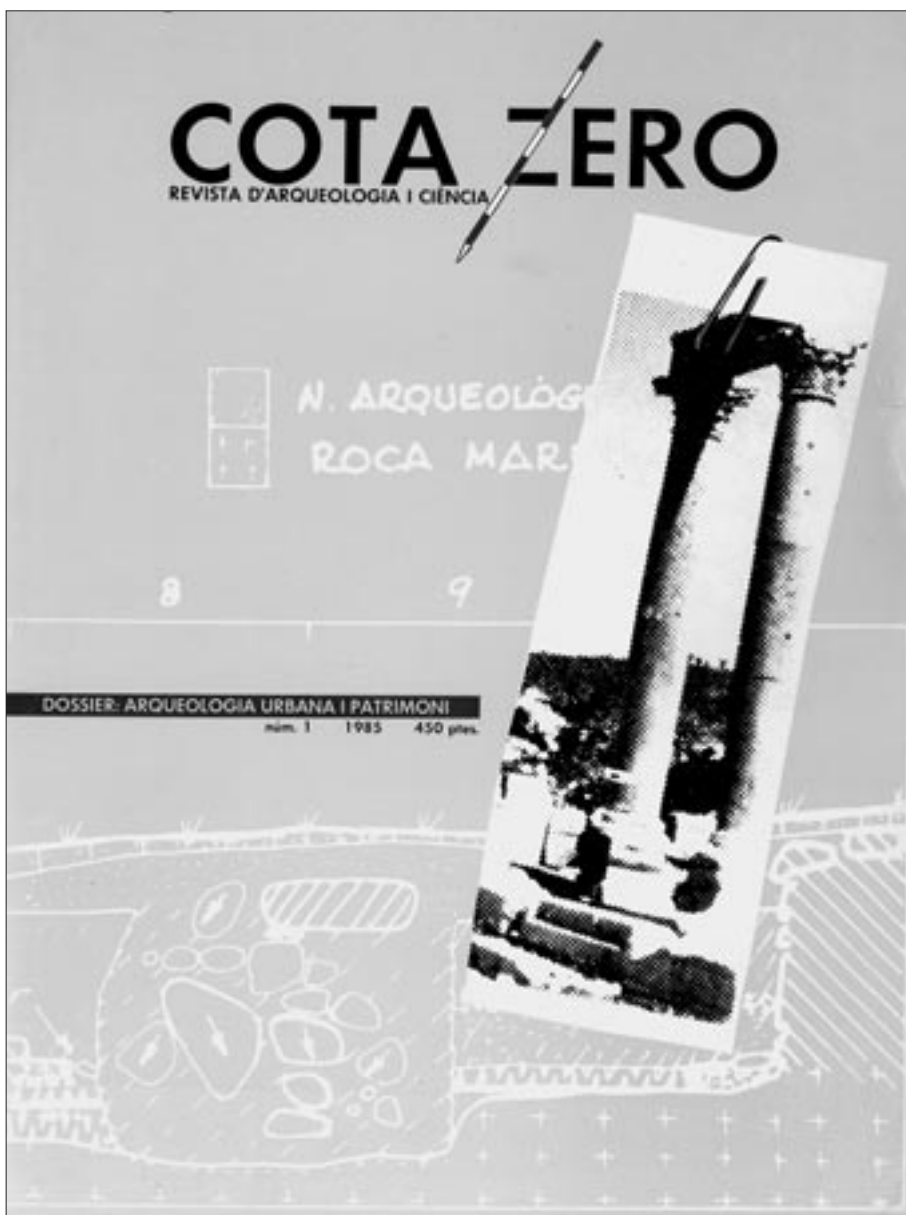
Portada del primer número de la revista CotaZero . Any 1985.