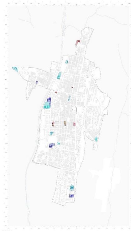
Font 4: Plànol d'Elaboració Pròpia Simplificat de la Ubicació d'Escoles de Granollers

El municipi actualment, compta amb deu escoles públiques, una d'elles municipals, i sis de concertades. Aquestes escoles queden repartides en diferents punts del municipi destacant un nombrós grup d'institucions a la part centre-oest de la ciutat. Observem que algunes de les escoles estan situades