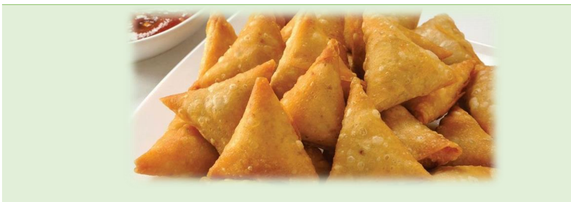
Recepta Pròpia