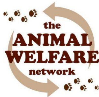
Font 1: Logotip de The Animal Welfare Network. Extret de: http://animalwelfarenetwork.com/

Un exemple fora del continent europeu és el projecte com el d'Animal Welfare Network, una xarxa de benestar animal fundada a Port Espanya a Trinitat i Tobago l'any 2000. El primer objectiu era ajudar als animals abandonats i maltractats de la població i aconseguir que aquest poguessin trobar una llar i poder ser adoptats. Des de l'any 2012 i amb l'aprovació del ministeri d'educació del País, AWN va llençar un programa d'educació per al benestar animal per a escoles d'educació primària en tres franges d'edat diferents: 5-7 anys, 8-10 anys i 11-12 anys on el director de cada escola podia decidir si aquest programa podia impartir-se al seu centre educatiu o no.