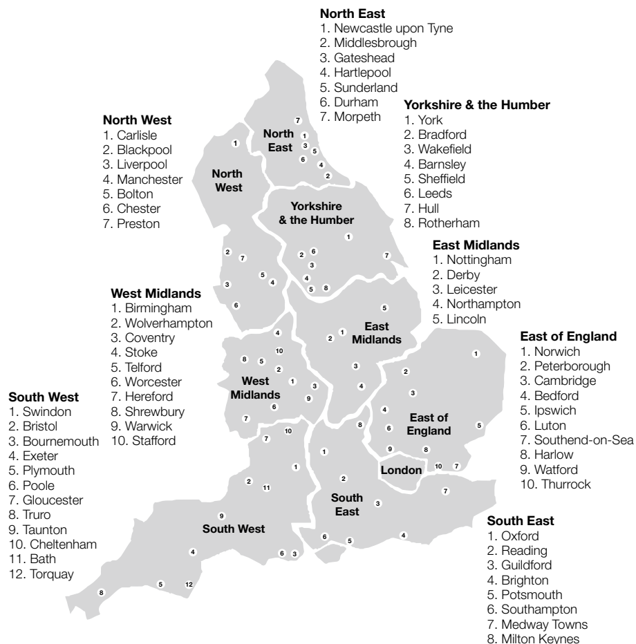
Mapa 1. Regiones de Inglaterra