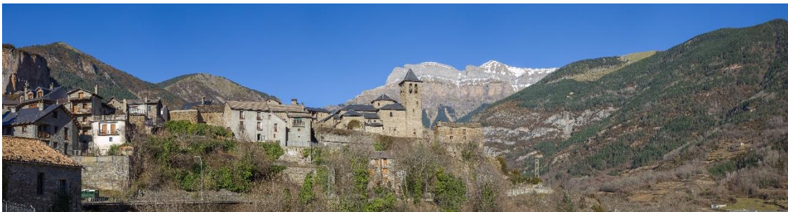
Imatge1 Torla.

El municipi de Torla conforma un espai ocupat en gran part per zones forestals i espais oberts. Les zones agrícoles són majoritàriament dedicades a pastures. Hi ha molt poques zones d'horticultura, quasi bé totes elles al voltant de nucli urbà. Gran part del territori municipal, 185 km 2 , és espai protegit i una part important del territori forma part de les reserves de caça i pesca.