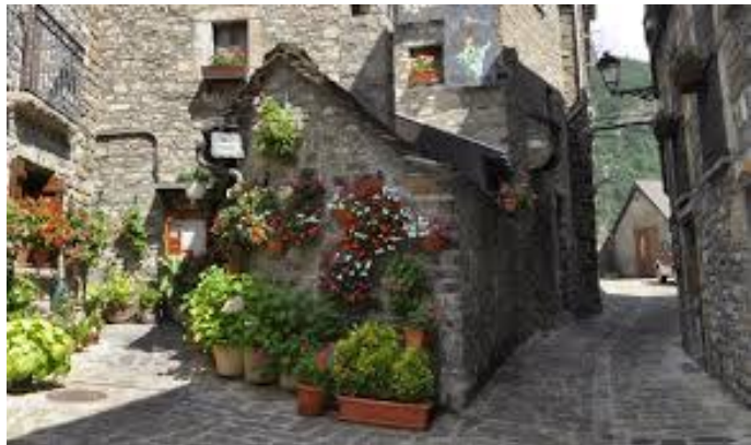
Imatge 8.Racó de Torla.

Les pràctiques dels veïns locals resulten condicionades per la demanda dels visitants urbans que són el que busquen poder fer aquest trànsit pels carrers fent servir les càmeres i poder representar la bellesa del seu viatge. El màrqueting turístic exerceix una forta pressió que provoca un notable impacte sobre les percepcions del territori i les pràctiques locals (Vacarro i Beltran, 2014).