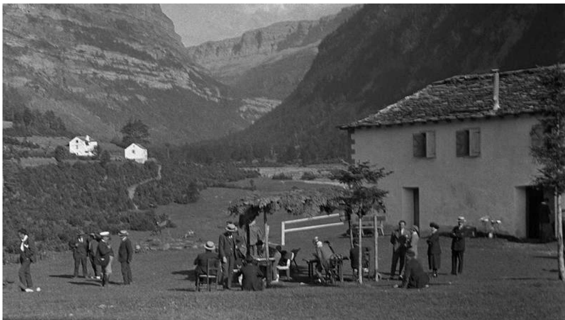
Imatge 3 Casa Oliven, Principis del segle XX a l'entrada d'Ordesa.

nucli del poble, acollia en aquells inicis de segle els viatgers i comerciants que travessaven per la zona (Briet 2001).