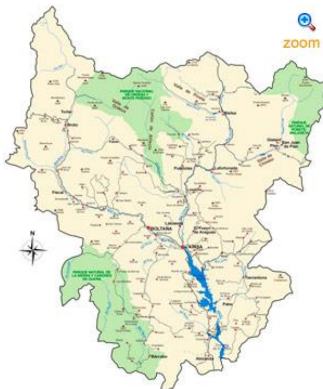
Imatge 2 Mapa de la comarca i espais protegits

El parc nacional d'Ordesa avui és el motor de l'economia local. La contemplació d'aquest paisatge és la principal mercaderia que Torla ofereix als visitants. L'existència del parc Nacional d'Ordesa ha tingut efectes dissuasius i ha exercit un fre per la intervenció de capital extern en infraestructures o en l'explotació del territori. No s'han construït vies de comunicació, més enllà de les sendes i camins i pistes, amb la part nord del Pirineu, fent d'aquest final de vall un espai d'accés restringit als caminants i vehicles autoritzats. El riu Ara, també, ha esdevingut un dels pocs rius de la península que manté el curs lliure de modificacions producte de l'acció humana 2 .