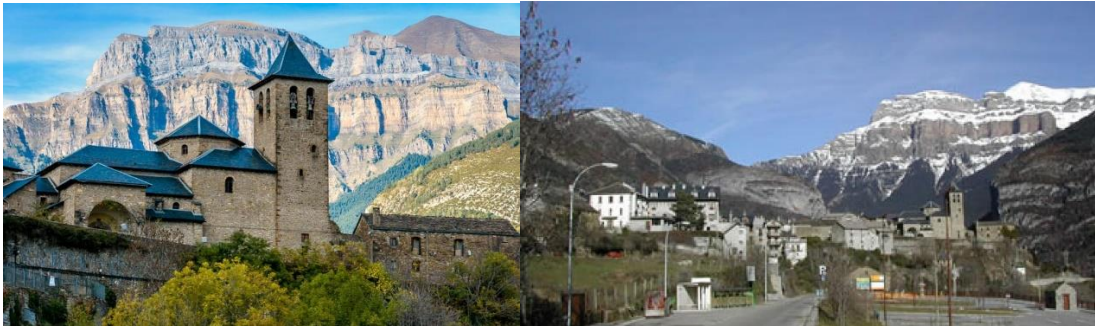
Imatges 6 i 7: Església i poble als peus dels massís de Mondarruego

Torla també es veu representada per la seva imatge de la torre de l'església al peu de la muntanya de Mondarruego. Jesús ens diu que és el DNI del poble. A aquesta imatge icònica del Pirineu s'hi han anat afegint moltes altres, producte especialment del descobriment dels turistes i la incorporació pels locals de la necessitat de mostrar el poble, els seus carrers, els seus racons com a productes per ser admirats i fotografiats. Quan arriba la primavera la majoria de les cases del poble pengen de parets, finestres i balcons geranis i altres flors per engalanar el poble. Embellir el poble per mostrar-lo als visitants i, per moments, Torla sembla un gran aparador.