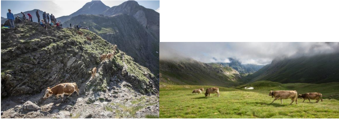
Imatges 4 i 5 Bernatuara. Trànsit dels ramats i excursionistes que observen la travessia dels ramats. Vaques pasturant a la cara nord del Pirineu.