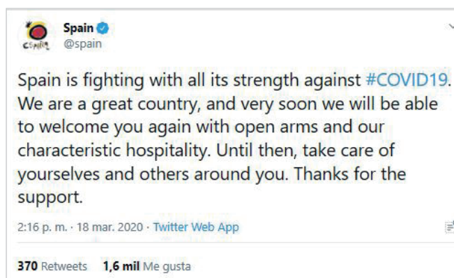
Figura 5. Único tweet de la ONT española sobre Covid-19. https://twitter.com/spain/status/1240265806832979969

Los recursos interactivos y gráficos (figura 6) son los más utilizados por ambas ONTs para difundir los contenidos en Twitter (en más del 90% de los tweets). En los recursos gráficos predomina el texto con foto y en los recursos interactivos prevalecen los hashtags y los links. Por otra parte, se identifica que los recursos audiovisuales (solo en el 5% de los tweets), son los que las ONTs utilizan menos para comunicar los contenidos en la plataforma.