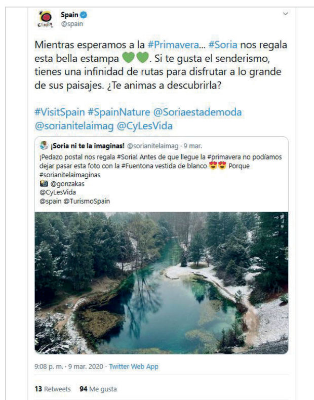
Figura 2. Contenido de promoción turística de la ONT española. https://twitter.com/spain/status/1237108122294136833

platos típicos de ciudades españolas, planes sobre qué hacer en algunas ciudades, recopilación de leyendas o historias de diferentes lugares, guía de los miradores más impresionantes de España, información sobre servicios de transporte para poder viajar, información sobre el mar Mediterráneo o sobre el entorno natural de España (figura 2).