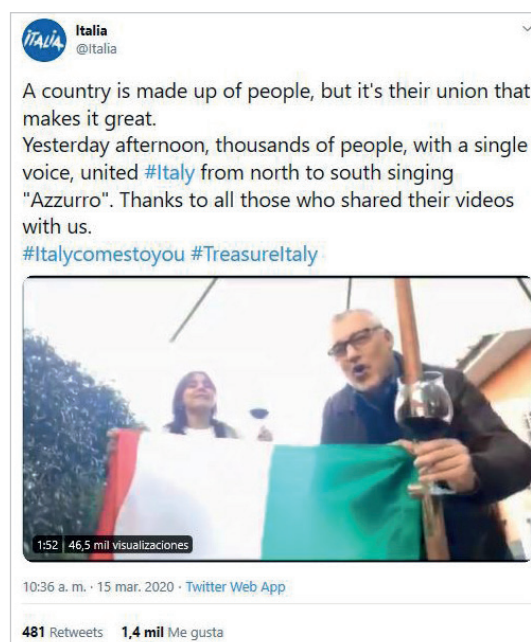
Figura 8. Tweet de ONT italiana más apoyado y compartido por los seguidores. https://twitter.com/italia/status/1239123413836410881

En el segundo tweet con mayor número de 'me gusta' (n=992) entre los seguidores, la ONT de Italia lanza simbólicamente una moneda en la Fontana de Trevi expresando el deseo que los turistas puedan regresar cuanto antes, solicita que los usuarios cuiden de su salud respetando el confinamiento y ofrece una pieza audiovisual con espectaculares imágenes para suavizar el confinamiento: