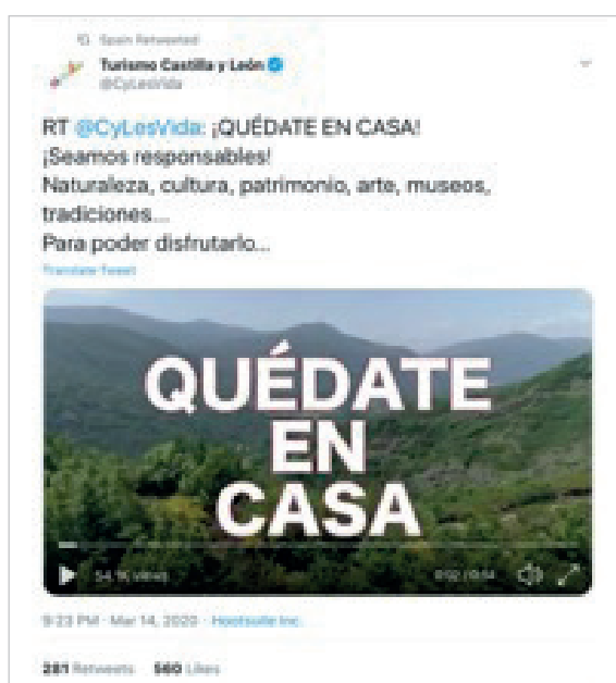
Figura 3. Primera comunicación de la ONT española vinculada a la crisis de la Covid-19. https://twitter.com/spain/status/1239254521739644928

El análisis del timing (PI2) muestra que las ONTs publicaron tweets a ritmos distintos a partir de la detección del primer paciente en cada país. En el caso de España, el primer caso positivo apareció el día 31 de enero, sin embargo, el primer tweet que la ONT de España publicó al respecto no apareció hasta 43 días después. Lo hizo mediante un retweet de la Oficina de Turismo de Castilla y León , en el que se aludía a la crisis de manera indirecta solicitando a los seguidores a afrontar la situación con responsabilidad, evitando la movilidad y practicando el confinamiento (figura 3).