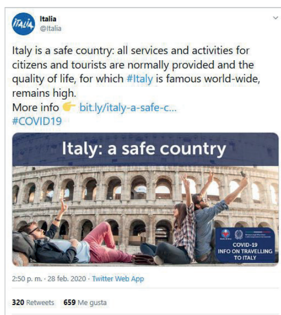
Figura 4. Primer tweet de la ONT italiana sobre Covid-19. https://twitter.com/Italia/status/1233389065724186624