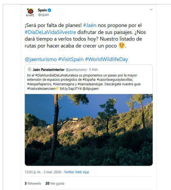
Figura 6. Ejemplo de formato gráfico de ONT España. https://twitter.com/spain/status/1234796416570142721