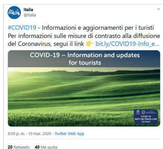
Figura 7. Tweet de la ONT italiana con #COVID19. https://twitter.com/italia/status/1237437935399710721

Si se consideran los recursos como los hashtags y las etiquetas, los que la ONT España más utilizó fueron #visitspain, #livespain, #spainnature, #spaingastro, #spainexperience y #ingreenspain, que aluden a contenidos de promoción turística. En contrapartida, utilizó una única vez #COVID19, #desdecasa y #yomequedoencasa, que son los hashtags más vinculados directamente con la crisis (figura 5).