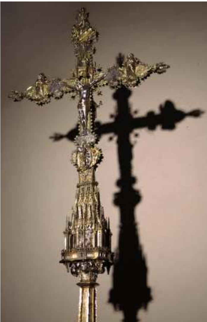
Fig.1.- Creu processional major de Traiguera

Aquesta realitat es transparenta clarament en l'estudi de l'argenteria. Els punxons que es troben o estan documentats a les peces de les esglésies de la diòcesi de Tortosa són diversos: a les parròquies de més al nord en van arribar algunes d'obrades a Lleida; de vegades hi ha notícia sobre contactes amb centres aragonesos; la presència al bisbat d'alguns eclesiàstics d'importància en època del Cisma d'Occident va possibilitar que centres urbans relativament petits posseïssin peces, de plata o ivori, procedents del nord d'Itàlia o del sud de França; i les manufactures de Barcelona –a la part catalana– i de València –a la valenciana– hi van ser relativament abundants. Però les obres i els documents mostren que, des del darrer terç del segle XIV, especialment des dels volts del 1400, van ser Morella –i, en menor mesura, Sant Mateu– per a la part sud del bisbat, i Tortosa, per a la part nord –les Terres de l'Ebre–, els obradors que en major mesura van proveir de peces les institucions civils i eclesiàstiques d'aquest territori. I també mostren que aquests centres van estar íntimament vinculats i van compartir mestres, formes i models de referència. 29