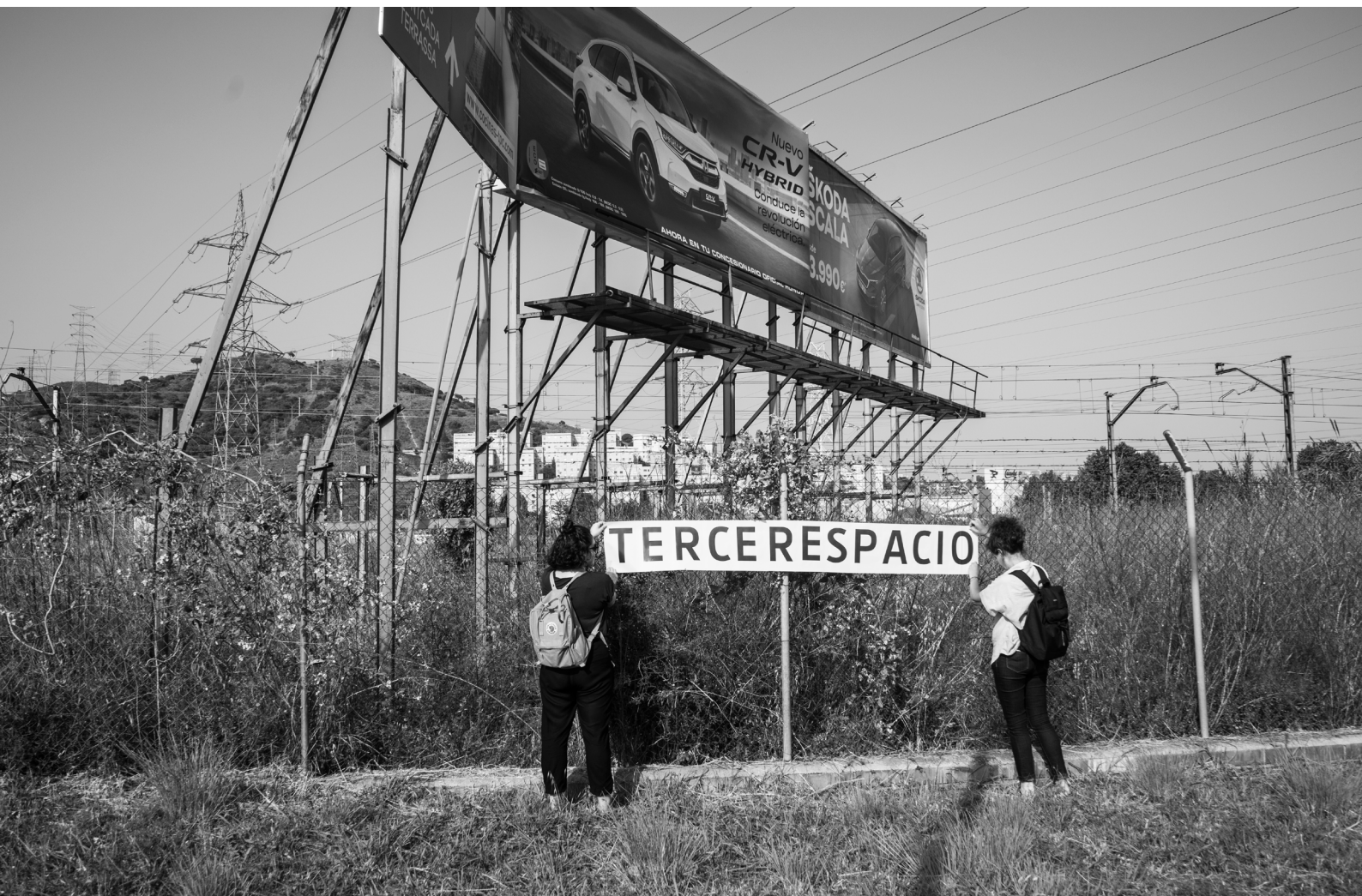
ASIMETRÍAS. Residencia de investigación y vivero de procesos. Un proyecto de Idensitat para Fabra i Coats Fàbrica de Creació de Barcelona, 2019