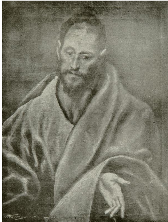
[Fig.4.1] El Greco: Apòstol Santiago el Menor (Col·lecció particular). Imatge publicada al llibre de Miquel Utrillo Domenikos Theotokopulos (El Greco)

Aquesta compra no feia més que certificar l'interès de Deering pel Greco. Passió que feia anys que durava. Tenim constància que des d'abans de 1905 era propietari d'un Apòstol Santiago el Menor , tal i com recull una de les làmines que il·lustrava el volum que Utrillo dedicà al pintor cretenc dins la Colecció de Vulgarisació «Forma» [Fig.4.1]. 524 A més, el 1906, havia format part del grup d'empresaris de Chicago que intervingueren en la compra al francès Durand-Ruel de l' Asunción de la Virgen (1577), procedent de Santo Domingo de Toledo. 525 Seguint l'estela d'altres prohoms, influït per les directrius exposades per Bion J. Arnold l'any 1868, 526 no dubtà en exercir de mecenes