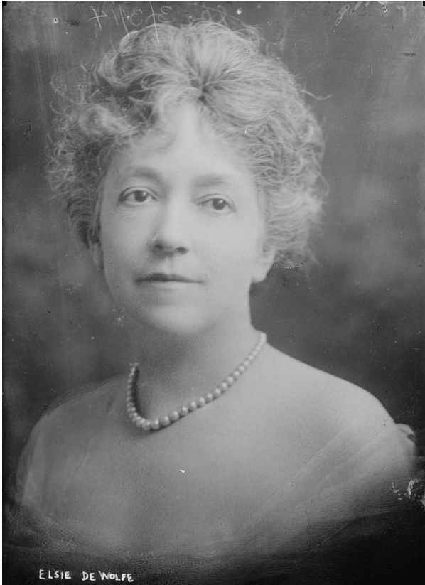
[Fig.4.8] Elsie de Wolfe cap a l'any 1914. Library of Congress Prints and Photographs Division, núm. reg. LC-B2-3020-5. Llicència Creative Commons

Tot i treballar en equip, les discrepàncies entre Deering i Utrillo per la orientació del projecte cada cop eren més notòries, i Casas, que no volia posicionar-se a favor de cap dels dos, decidí traslladar-se a París i establir-se al 3bis de la Rue Clément Marot. Allí aprofità per contractar set retrats de nens, que tot i els beneficis econòmics i el prestigi que li reportaren, per ell foren un veritable càstig i una constant font de problemes. Segurament, les obres li foren demanades per la soprano Christine Nilson (1843-1921), casada en segones núpcies amb el comte de Vallejo y Miranda, que llavors figurava a les guies de París empadronada en l'esmentada direcció. 571