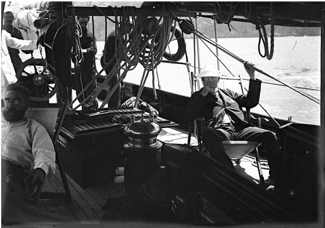
[Fig.4.14] Charles Deering i Ramon Casas de viatge en vaixell cap a Formentera (1915, detall).