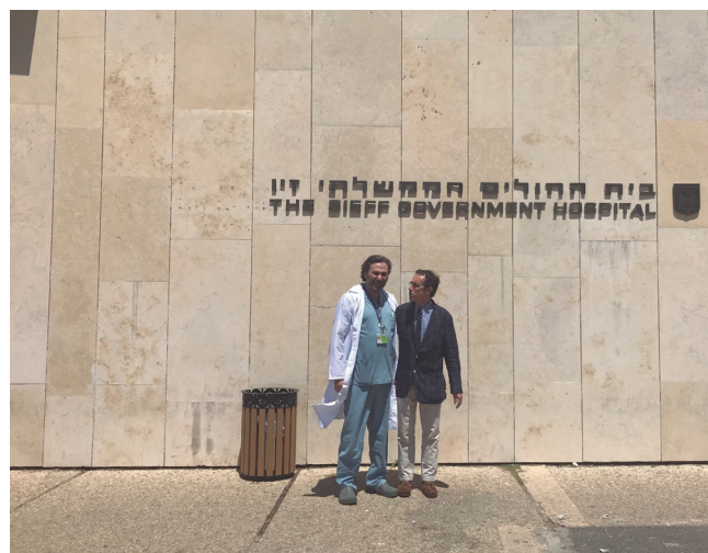
Fig. 1. Hospital Ziv en Safed, Israel.

Una parte de los pacientes son de edad pediátrica y el hospital ha construido una nueva área infantil para que sean