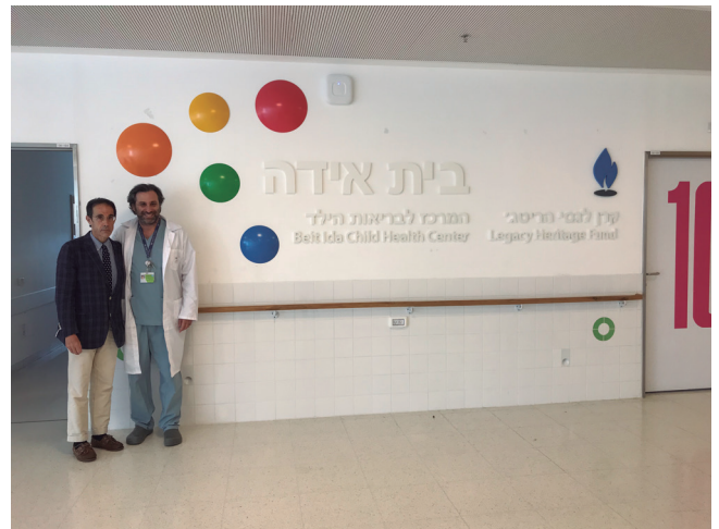
Fig. 4. Área pediátrica del Hospital.