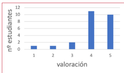
Figura 3. Resultados de la pregunta: «¿Piensas que este modelo de compactación ayuda a una mayor inmersión en la asignatura?».