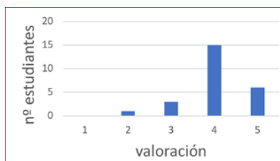
Figura 2. Resultados de la pregunta: «¿Cuál es tu valoración general de haber compactado la asignatura?».

Ahora bien, teniendo en cuenta los resultados de la encuesta de satisfacción de los estudiantes, sí se puede concluir que, por un lado, estuvieron contentos con el modelo de compactación porque creen que les ayuda a una mayor inmersión en la asignatura y, por el otro, valoran que la metodología del aula inversa utilizada les ayuda a una mayor comprensión de la asignatura y a mejorar su aprendizaje. Los resultados de dicha encuesta se presentan a continuación (la escala del 1 al 4 equivale de menor a mayor satisfacción):