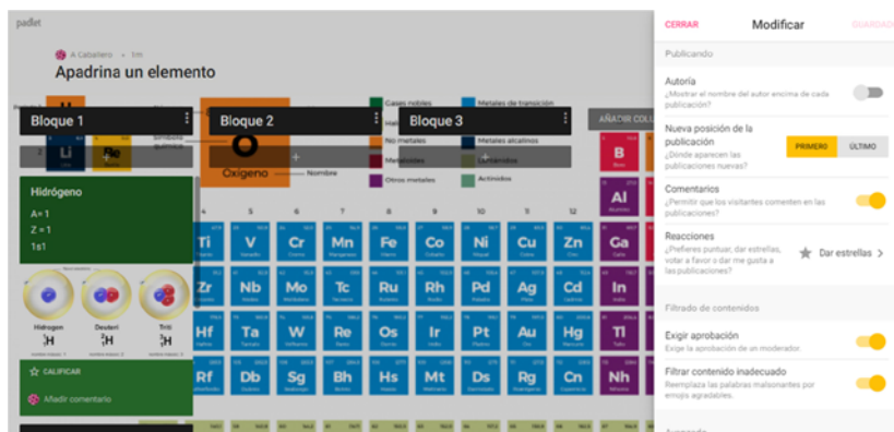
Figura 1. Creación de una tabla periódica virtual con Padlet. Las publicaciones se distribuyen de la misma forma que lo hacen los elementos químicos en la tabla periódica, es decir, por bloques y grupos.

En la figura 1 se muestra una aproximación inicial del muro virtual de la tabla periódica.