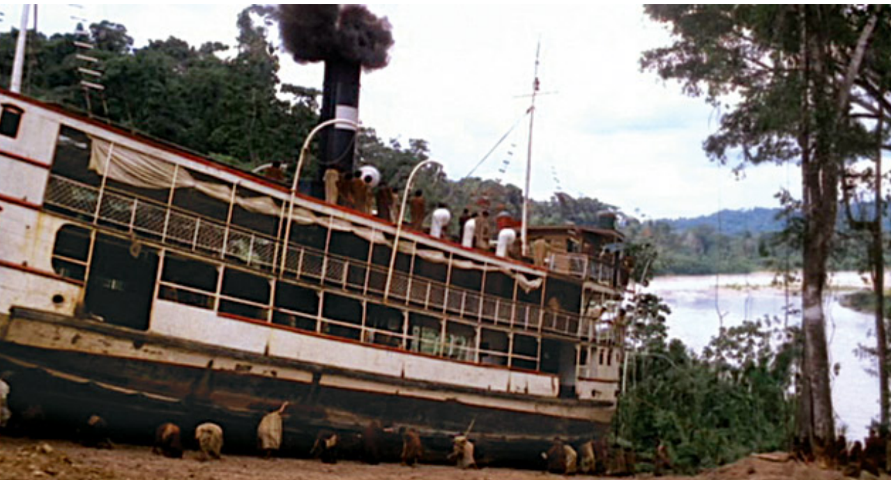
Fitzcarraldo (1982) Werner Herzog.

Richard Sennett fa un paral·lelisme, al llibre El Artesano (2009), que em sembla apropiat comentar, entre el disseny assistit per un ordinador i el dibuix a mà.