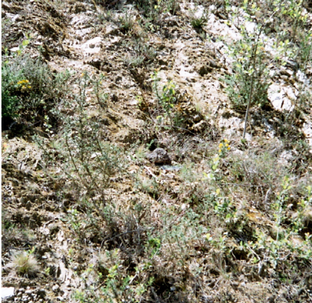
Pedra volcànica original.