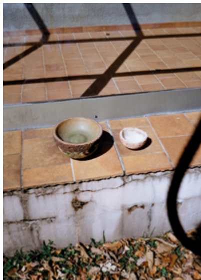
Bols fets per Claudi Casanovas mesclant diferents argiles.