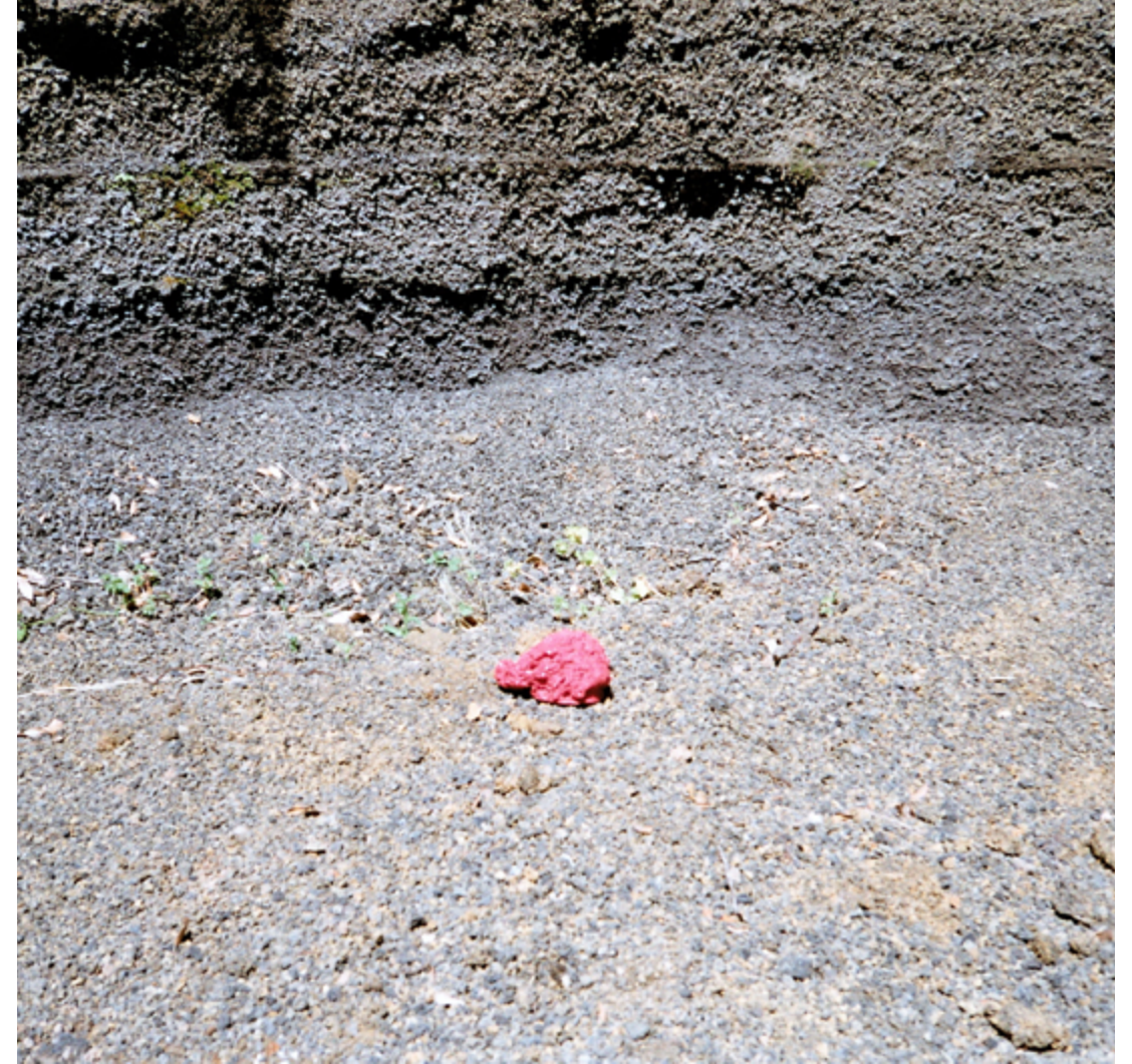
Còpia de la pedra volcànica.