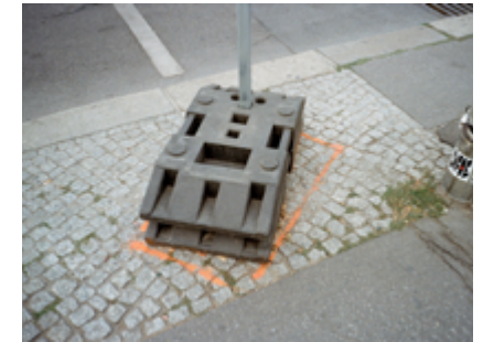
Detall d'un desplaçament mínim trobat a Berlín el 2017.