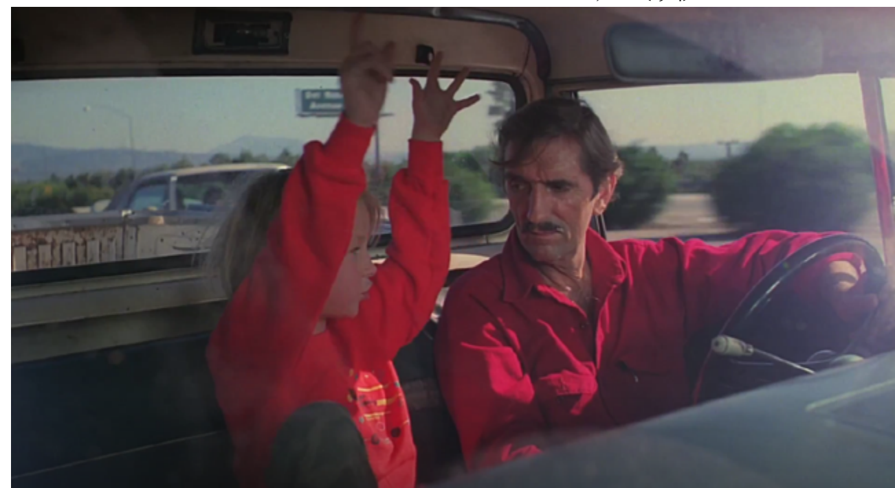
Paris, Texas (1984) Wim Wenders.

H: So there were see animals. Then under the water: volcanoes. Then Psssh!!! And the hot lava hit the water and formed the rocks to make the land. 4