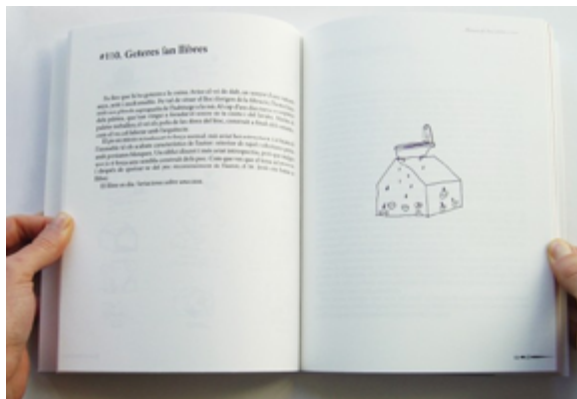
Maneres de (no) entrar a casa (2011) Alicia Kopf

A Maneres de (no) entrar a casa (2011), l'artista Alicia Kopf proposa pensar sobre el fet de marxar de casa quan ets jove en un context de crisi arran de la bombolla immobiliària. Si la paràbola de la joventut en aquell moment era haver passat de no poder entrar a una casa pròpia per no poder assumir el cost econòmic a no poder sortir de la casa familiar, avui, el gest comú per intentar combatre la precarietat juvenil passa per marxar a viure lluny. És per això que ens trobem amb un augment exponencial de les relacions a distància. En aquest context de distància s'activen petits gestos per combatre-la. He recollit quatre d'aquests gestos que han tingut lloc al llarg dels últims dos anys, dins una petita publicació titulada Maneres d'apropar-nos tot i estar a distància .