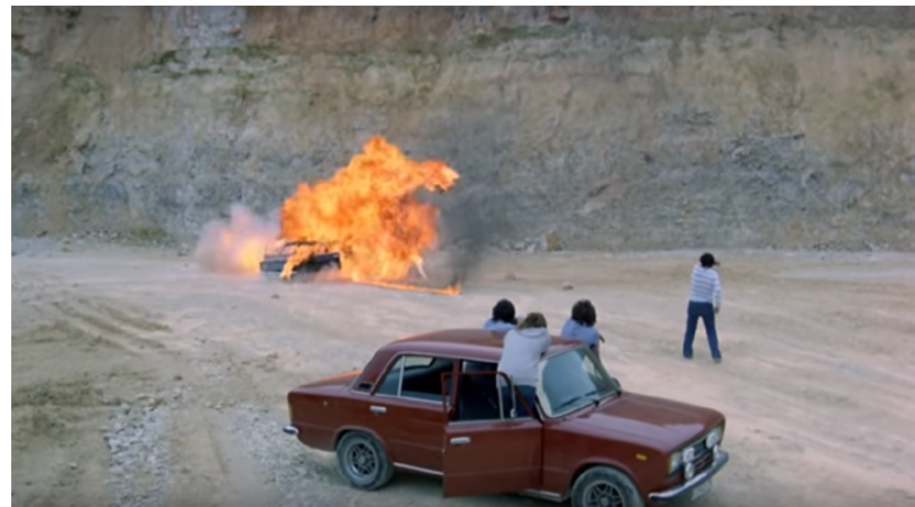
Deprisa, deprisa (1981) Carlos Saura.