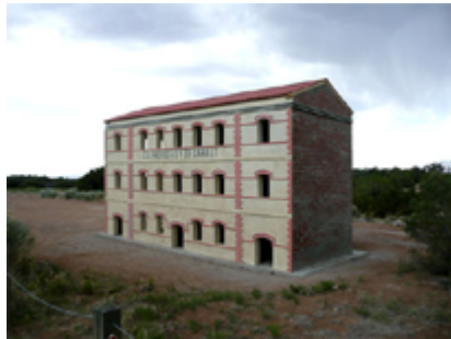
Fotografia de la fàbrica construïda a Santa Fe (2009) Martí Anson

L'artista també explica que aquest no és el primer cas de trasllat d'un edifici. El 2007 es va dur a terme el trasllat, peça a peça, de la casa Yin Yu Tang des de la província oriental d'Anhui fins al Museu D'Essex a Massachusetts. Es van empaquetar i traslladar 700 blocs de fusta, 8.500 rajoles i més de 500 pedres. (Anson, 2009).