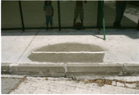
Rellenar los huecos con nata montada (2008) Fermín Jimenez Landa

Relaciono aquest desplaçament físic i de sentit del material natural amb l'obra Els Estats de la Matèria (2013) de Pauline Bastard. L'artista va adquirir una casa en ruïnes a la muntanya i la va derruir poc a poc, amb les seves pròpies mans i l'ajuda d'amigues i familiars. Pausadament va anar retornant al bosc els materials que formaven la casa, reconfigurant així, el paisatge natural. "La tranquil·litat d'aquest gest paradoxal ens acostava a certa idea de ritual de purificació, de reassignació de l'ordre natural en clau no antropocèntrica" (Kopf, 2017, para. 2).