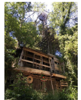
L'única torre que ara segueix dempeus.

Més endavant, diverses circumstàncies del moment el van dur a repetir el gest de Bastard, ell mateix va desmuntar i retornar al bosc els materials utilitzats. Un estira-i-arronsa constant entre ell i la institució el van portar a muntar i desmuntar fins a tres vegades el poblat laberíntic. 1 Actualment, les Cabanes d'en Garrell són una mena de runes on passejant-hi pots imaginar-te o recordar com era tot allò en la seva totalitat.