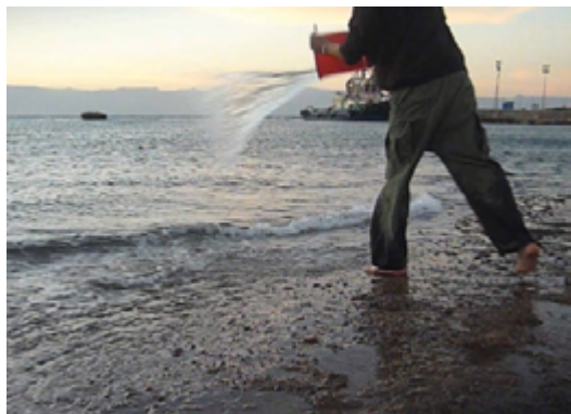
Watercolor (2010) Francis Alÿs