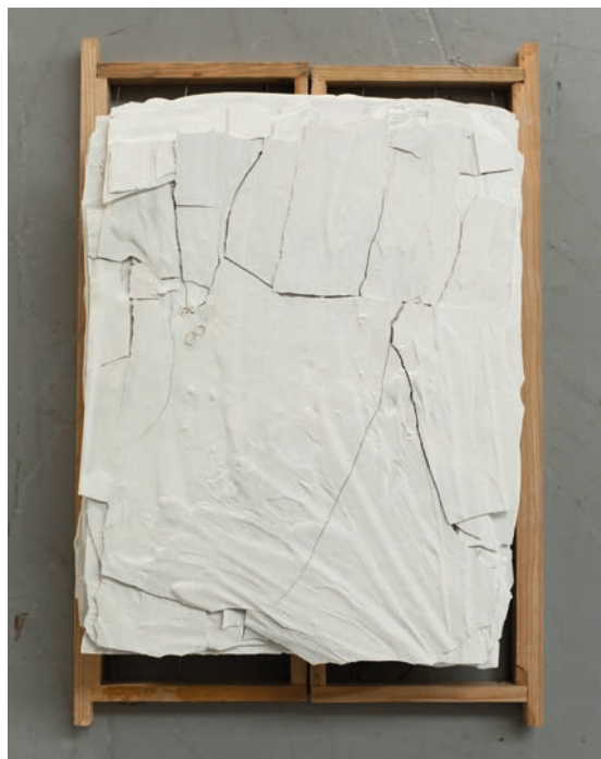
El més calent és a l'aiguera. Exposició