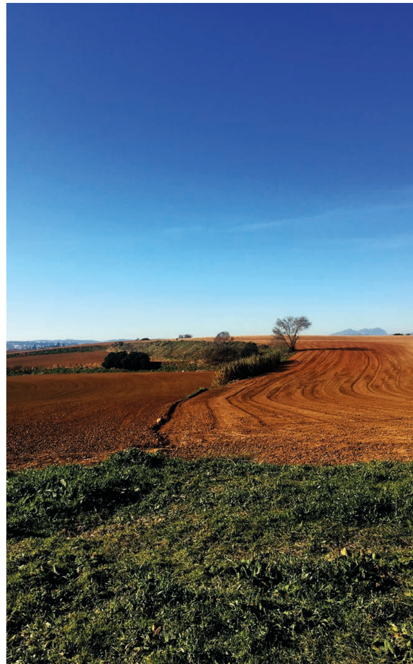
Fundació Felícia Fuster Barcelona