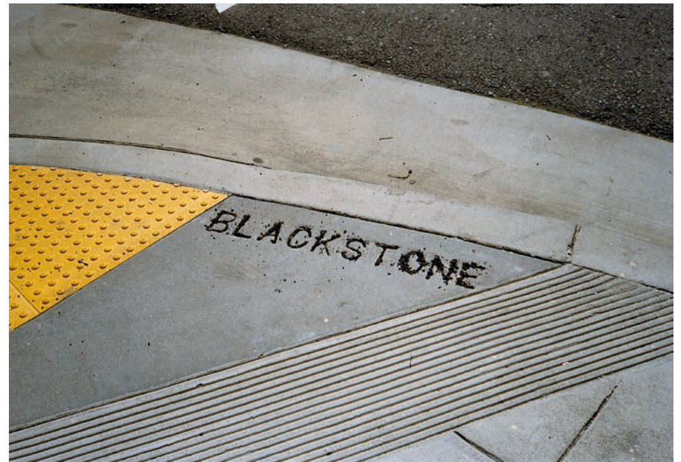
Fundació Felícia Fuster Barcelona