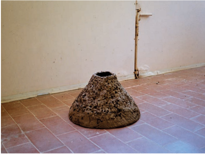
El més calent és a l'aiguera. Exposició