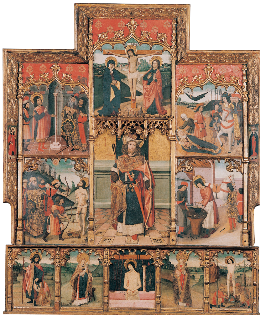
Retaul de sant Sebastià i sant Eloi, que fins al 1879 ocupava una capella lateral de l'església de Sant Esteve de Granollers, i que va ser venut juntament amb el retaul de sant Esteve.

Sancto, segons diuen els textos públics, y algunes de les quals sorprén no trovar en el de Granollers, com també falten plafons del bancal. 46 Donat el desenvolup de l'absis de l'iglesia parroquial de Granollers, quedaria un retaul migrat, sols amb les pintures existents. Les dels Profetes estaven potser