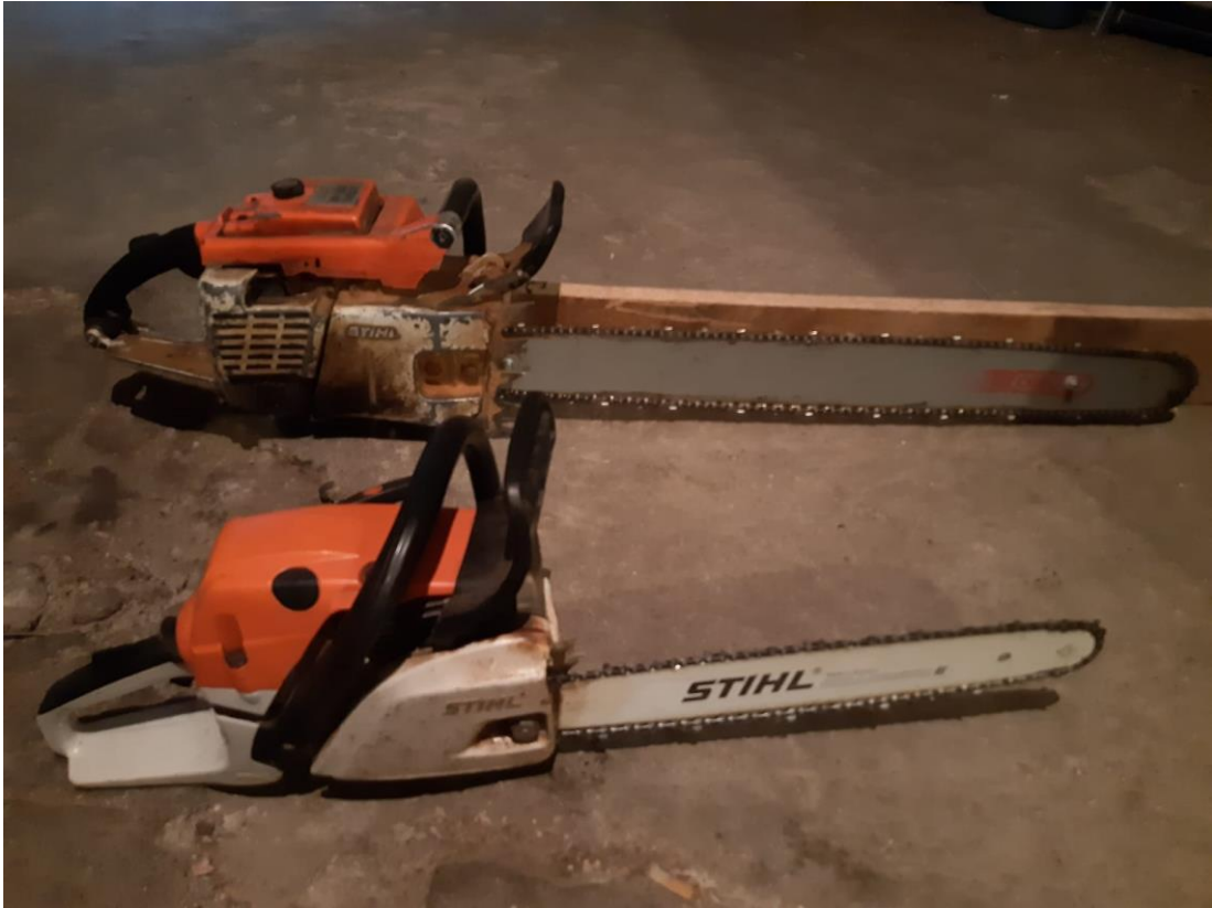
Imagen 1. Sierra mecánica de los años ochenta frente a una actual