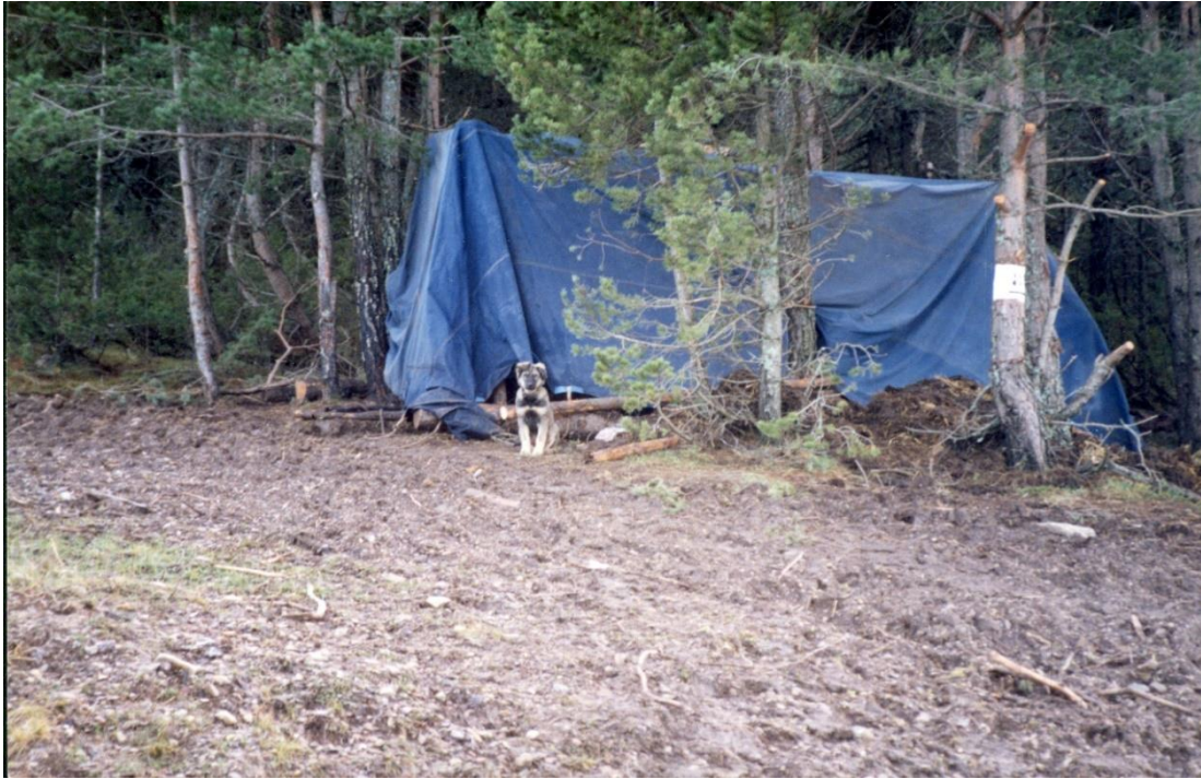
Imagen 4. Barraca de trabajadores bosque de los tres comunes año 1994