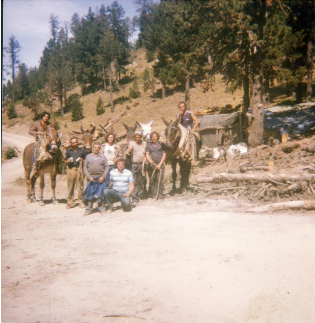
Imagen 3. Colla de trabajadores bosque de los tres comunes año 1980