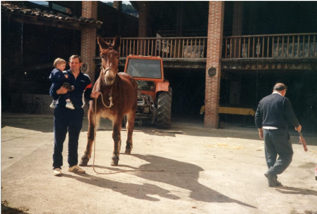
Imagen 2. Rematante haciendo gala de sus herramientas de trabajo año 1991