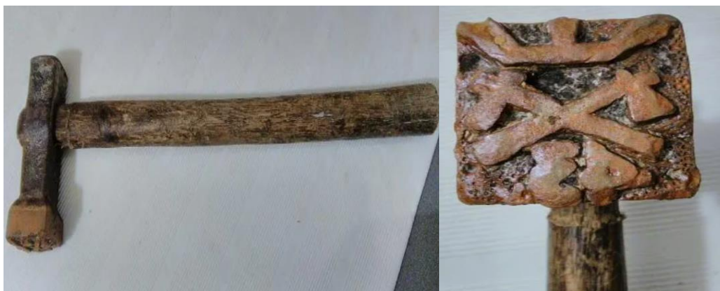
Imagen 6. Martillo forestal de marcaje ICONA año 1940