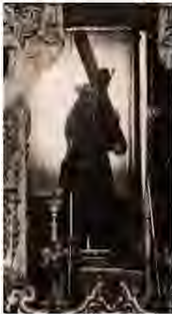
Antigua imagen de Jesús Nazareno articulada en Castro del Río

Antigua imagen de Jesús Nazareno articulada (realizaba la caída y bendición mediante mecanismo), destruida en 1936, durante los trágicos sucesos de la guerra civil.