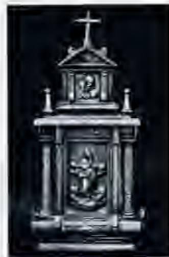
Imagen perdida del Portapaz