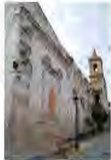
Remanente de convento (Restos de Santa Coeli)

EL CONVENTO CONTIGUO AL QUE DESPUÉS SE UNIRÍA LA IGLESIA, INICIARÍA SU CONSTRUCCIÓN HACIA 1615-1618 Y TRECE AÑOS DESPUÉS SE ENTREGARÍA A LAS MONJAS DE LA ORDEN DE CLAUSURA DE LAS DOMINICAS. ESTAS TENÍAN SU SEDE EN LA IGLESIA DE MADRE DE DIOS, DEPENDENCIAS QUE SE LES HABRÍAN QUEDADO INSUFICIENTES.