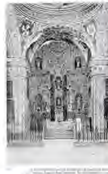
Lámina del Retablo de la Virgen del Rosario

Restos del convento de Santa Coeli. La fotografía data de (2019).