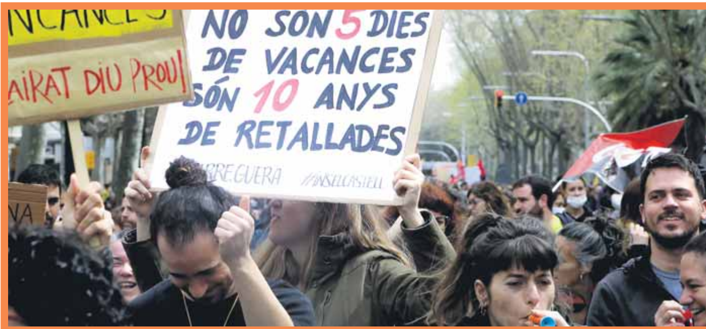
Manifestació a Barcelona, convocada pels sindicats d'educació el 29 de març. ORIOL DURAN