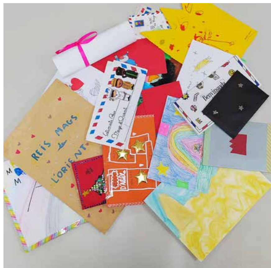
Mostra de les cartes d'Alella del Nadal de 2020.

procés a partir de la comparació de cartes recollides entre els anys 1921 i 1925, amb unes altres d'actuals recollides amb la col·laboració d'ajuntaments locals i escoles. Les primeres amb el regust amarg dels convulsos anys 1920; les segones escrites en plena pandèmia de coronavirus. I és així com ha pres vida el projecte Cartes als Reis Mags, que preveu confrontar les dues col·leccions i investigar qüestions tan variades com: qui eren els nens que escrivien als Reis fa cent anys i qui són els d'avui? Els infants més pobres ens han deixat cartes o només conser-