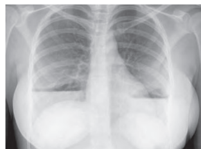
Figura 2. Radiografía de tórax que muestra los implantes mamarios bilaterales y niveles hidroaéreos en su interior.