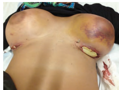
Figura 1. Exposición parcial de los cuerpos extraños implantados a través de las incisiones submamarias.

Mujer de 23 años remitida desde el aeropuerto a urgencias, custodiada por agentes de la Policía Nacional, por sospecha de transporte intracorporal de sustancias ilícitas. La paciente refería el antecedente de intervención quirúrgica reciente en forma de implantes protésicos mamarios bilaterales, realizada en su país de origen (Panamá). A la exploración destaca tumefacción mamaria bilateral con hematomas cutáneos en fase de resolución y dehiscencia incompleta de las cicatrices quirúrgicas submamarias, con exposición parcial del material implantado (Figura 1). La radiografía de tórax evidencia cuerpos extraños en ambas mamas, con nivel hidroaéreo en su interior (Figura 2). Se confirmó la presencia de metabolitos de cocaína en el análisis de orina. Se procedió a la retirada de los