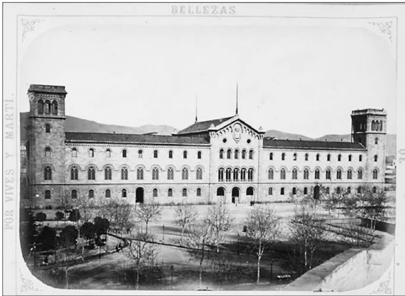
Joan Martí Centelles. Fotografia de la façana de la Universitat de Barcelona. En primer pla, les restes del baluard de Tallers. Bellezas de Barcelona: Relación fotografiada de sus principales monumentos, edificios, calles, paseos y todo lo mejor que encierra la Antigua capital de Principado , Barcelona, Vives, 1874.

contingents de soldats que s'havien concentrat a Catalunya en ocasió de la Tercera Guerra Carlina (iniciada l'abril de 1872). En el moment de començar les classes, una part del flamant edifici acadèmic era ocupada per la tropa, cosa que amenaçava de dilatar sine die la seva obertura com a universitat.