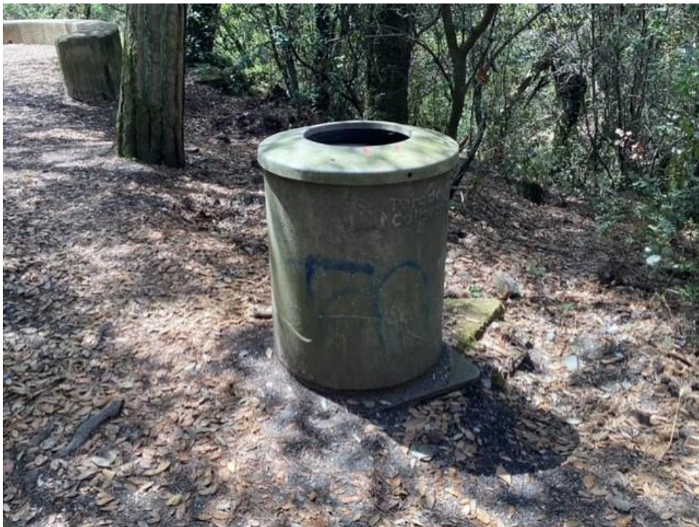
Fig. 11. Cestas de basura especiales “anti-jabalí” en Baixador de Vallvidrera