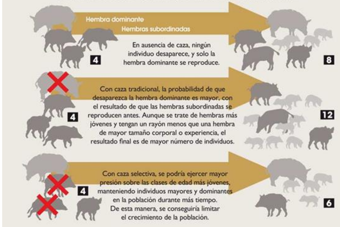
Fig. 3 Caza Selectiva

Representación gráfica de una posible explicación al hecho de que las poblaciones de jabalí continúen en aumento a pesar de permitirse su caza sin límite de capturas. Una modelización teórica del efecto de la caza indica que la caza selectiva de los individuos jóvenes sería más efectiva que la caza tradicional –no selectiva– para limitar el crecimiento de la población.