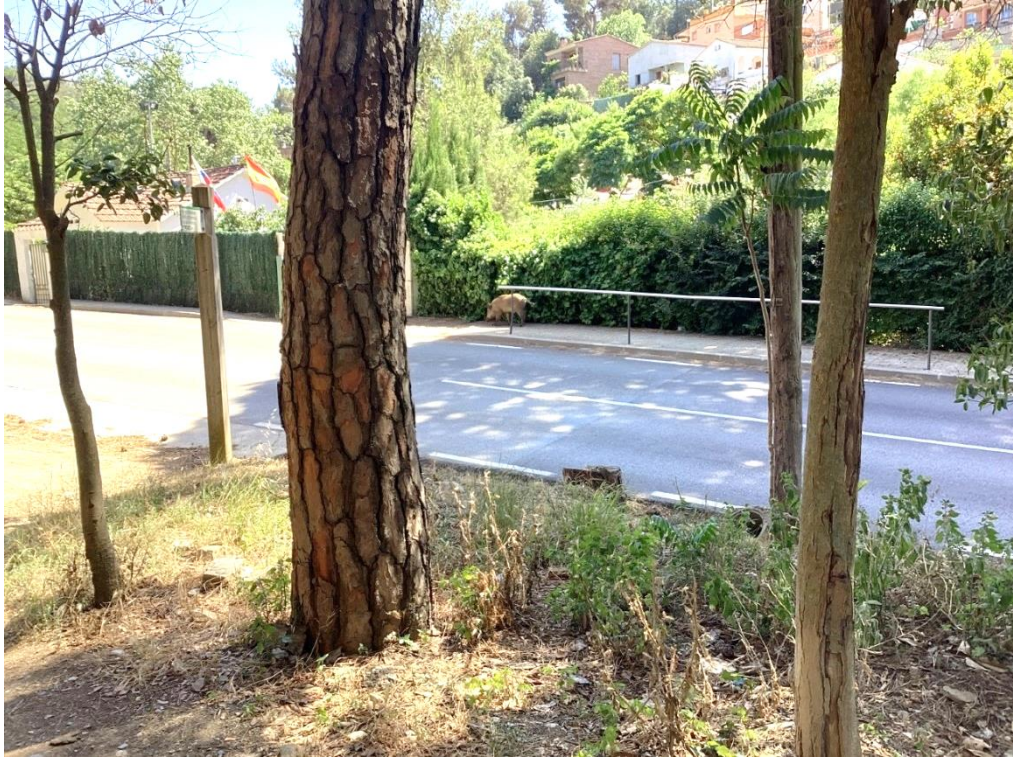
Fig. 17. Los jabalíes cruzan frecuentemente la Carretera de Vallvidrera a Les Planes.