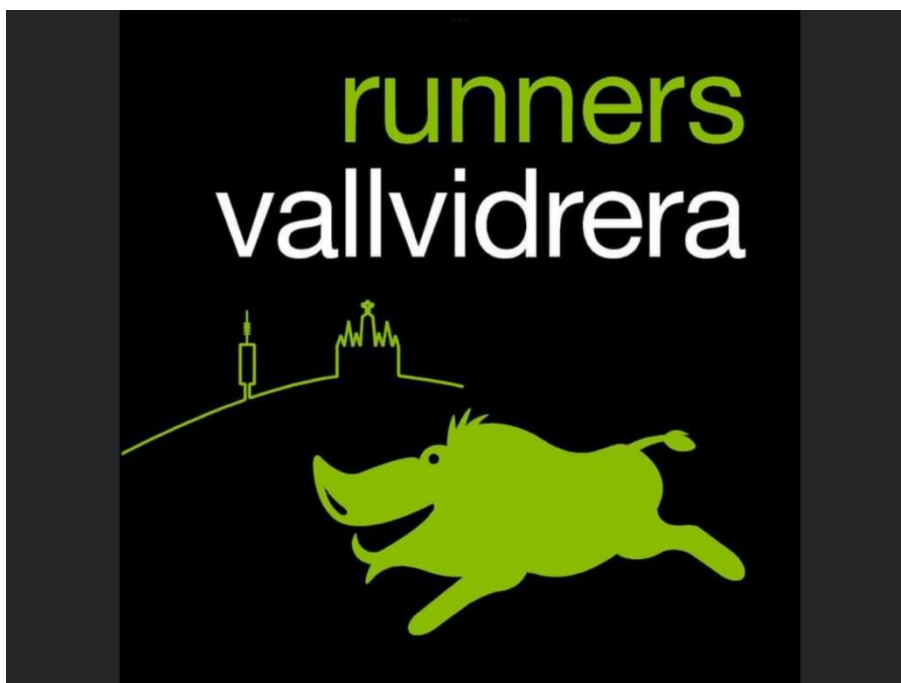
Fig. 5. Runners Vallvidrera grupo de Facebook para correr por Collserola.