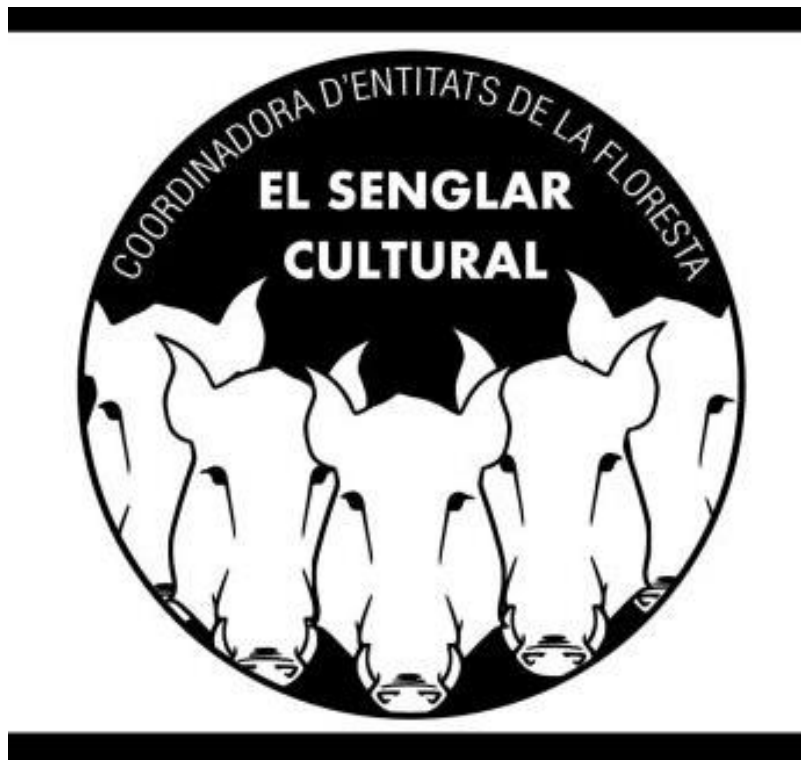
Fig. 4. El Senglar Cultural tiene como objetivo impulsar actividades culturales en La Floresta.