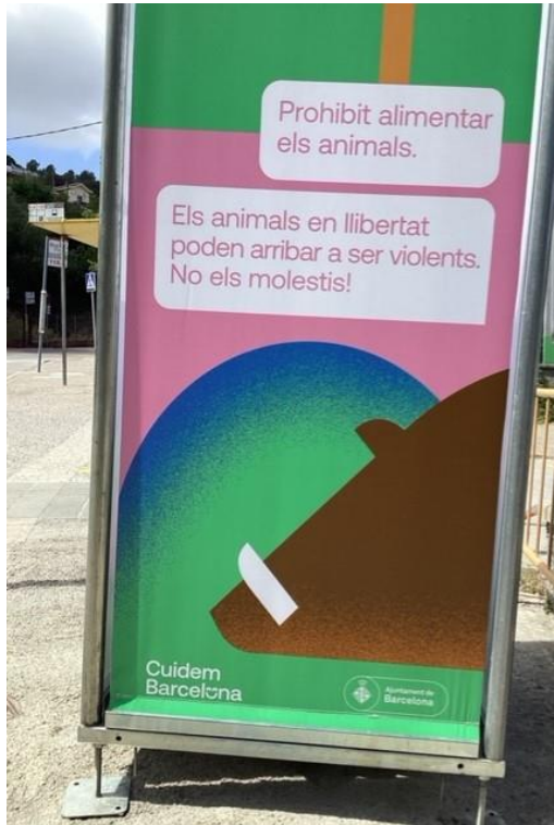
Fig. 8. Cartel informativo del Ayuntamiento de Barcelona en la salida de la parada de tren Baixador de Vallvidrera