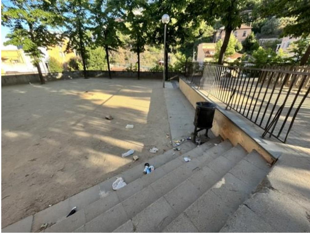
Fig. 10. Cestas de basura que los jabalíes han girado para comer.