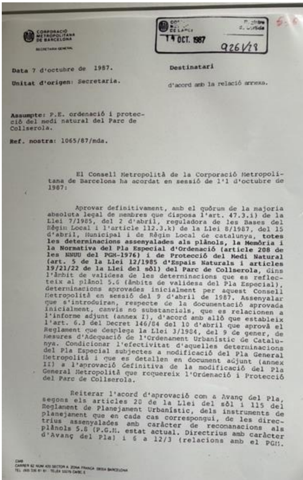
Fig. 12. Documento original del Plan Especial de Ordenación y Protección del medio natural del parque de Collserola. 1 octubre de 1987.