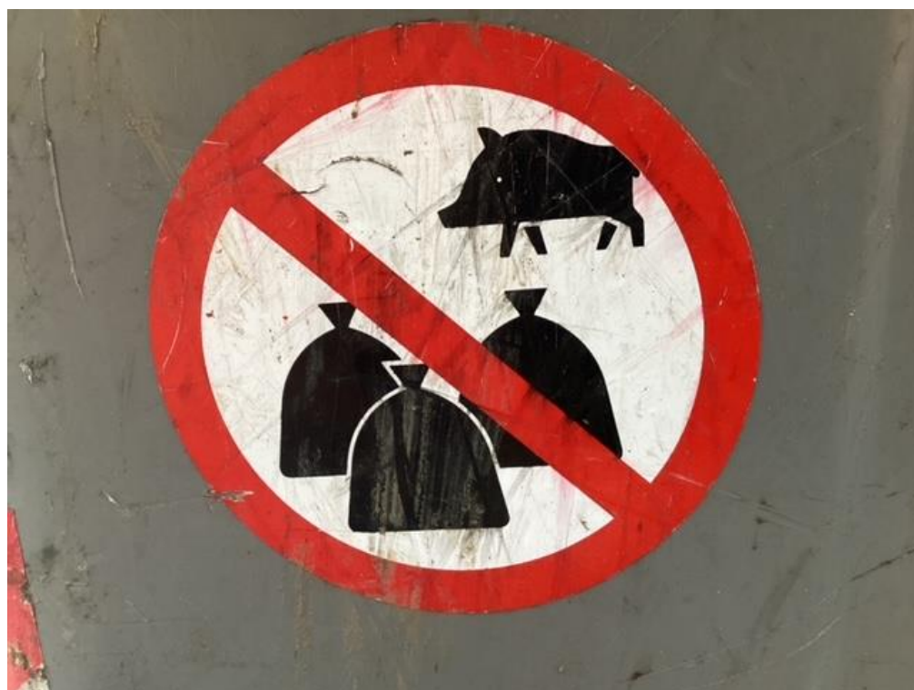
Fig. 7. Imagen en todos los contenedores de Collserola.

https://es-es.facebook.com/runnersvallvidrera/