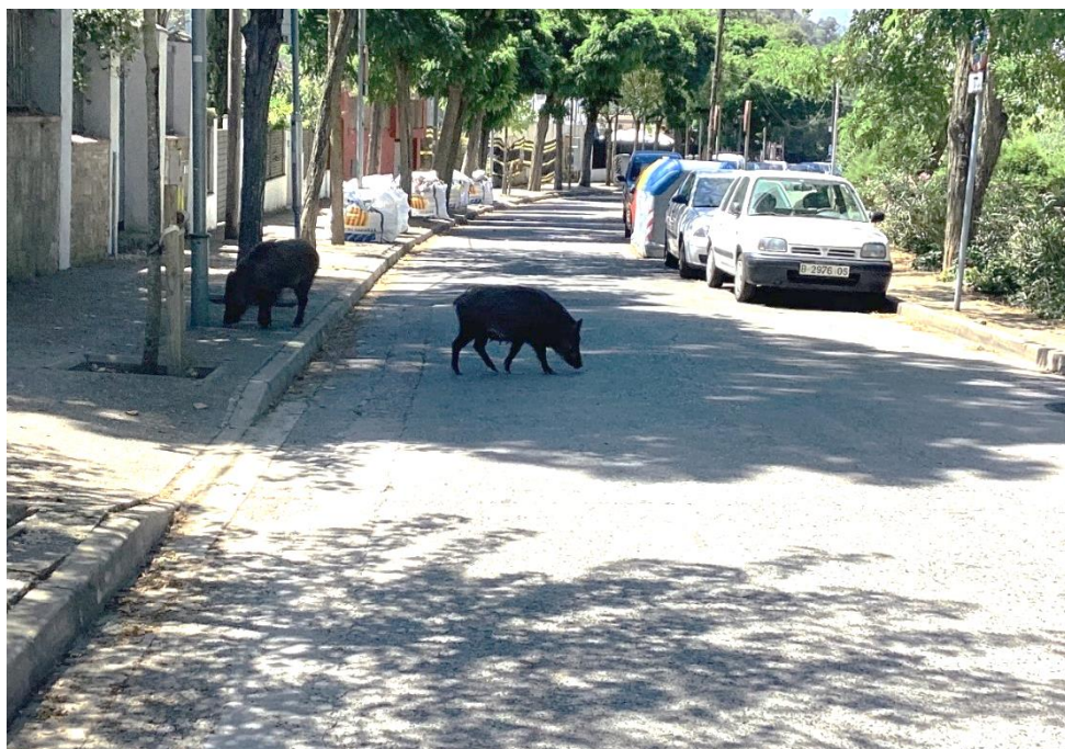
Fig. 16. Jabalies en el camino del pantano en Baixador de Vallvidrera