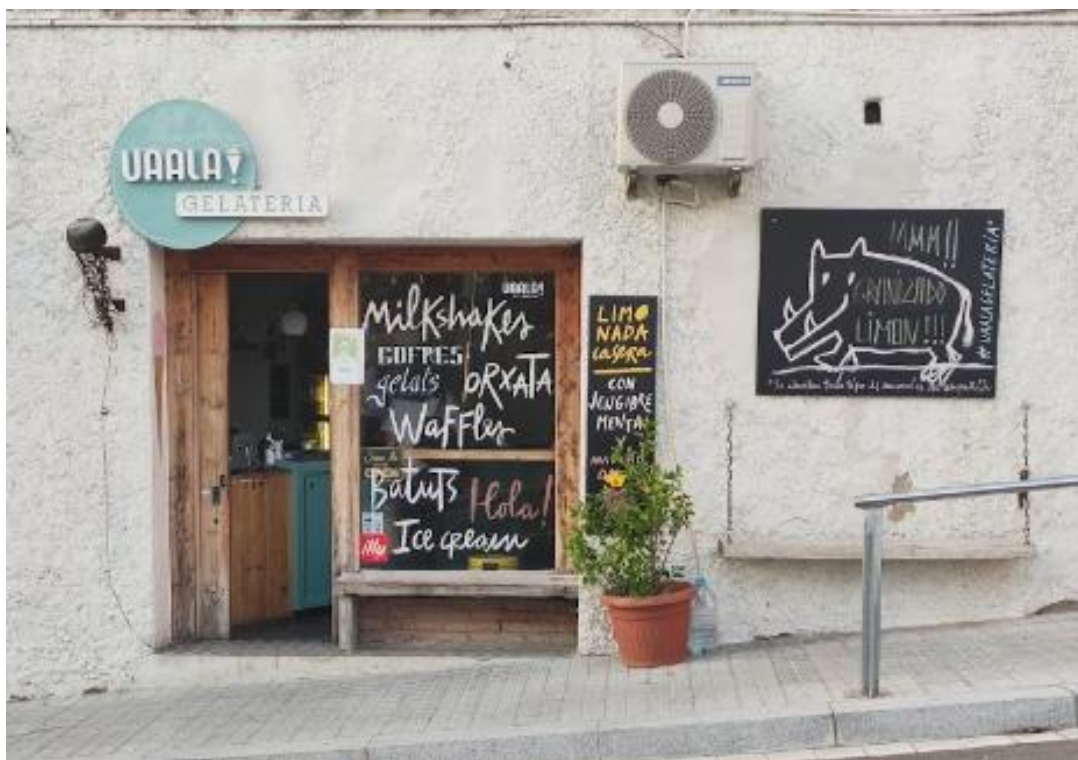
Fig. 6. Heladería en Vallvidrera Superior.