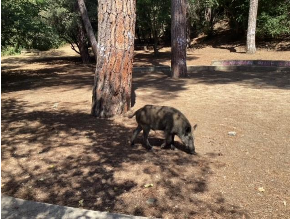
Fig. 13. Jabalí comiendo cerca del tren Baixador de Vallvidrera