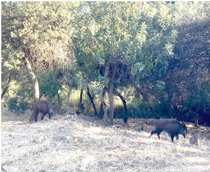
Fig. 14. Familia de jabalíes en Drecera de Vallvidrera