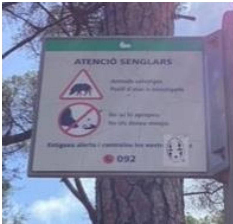
Fig. 9. Cartel de aviso de jabalíes en la zona y recomendación de no darles de comer.