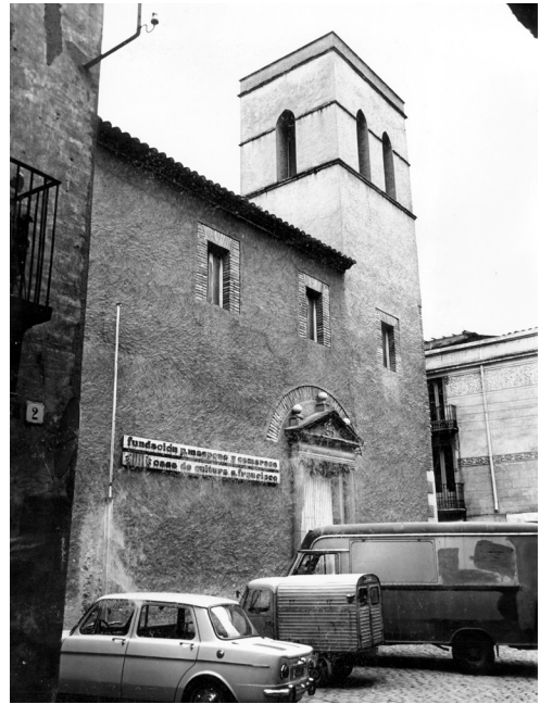
La Casa de Cultura Sant Francesc - Fundació Maspons i Camarasa, que va acollir les sessions del Centre d'Estudis en una imatge de 1968-1969.