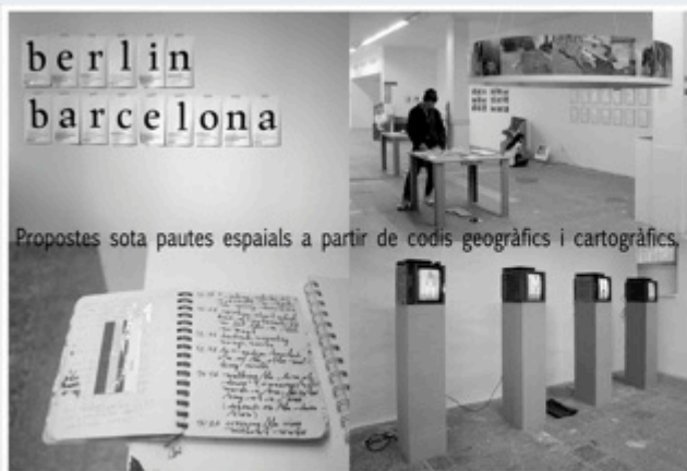
Propostes sota pautes espaials a partir de codis geogràfics i cartogràfics.