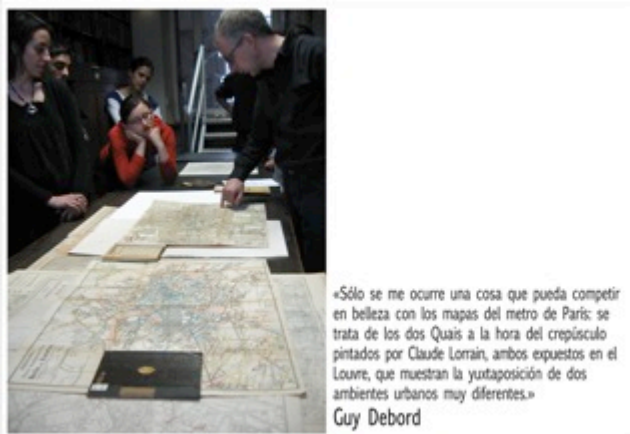
«Sólo se me ocurre una cosa que pueda competir en belleza con los mapas del metro de París: se trata de los dos Quais a la hora del crepúsculo pintados por Claude Lorrain, ambos expuestos en el Louvre, que muestran la yuxtaposición de dos ambientes urbanos muy diferentes.» Guy Debord