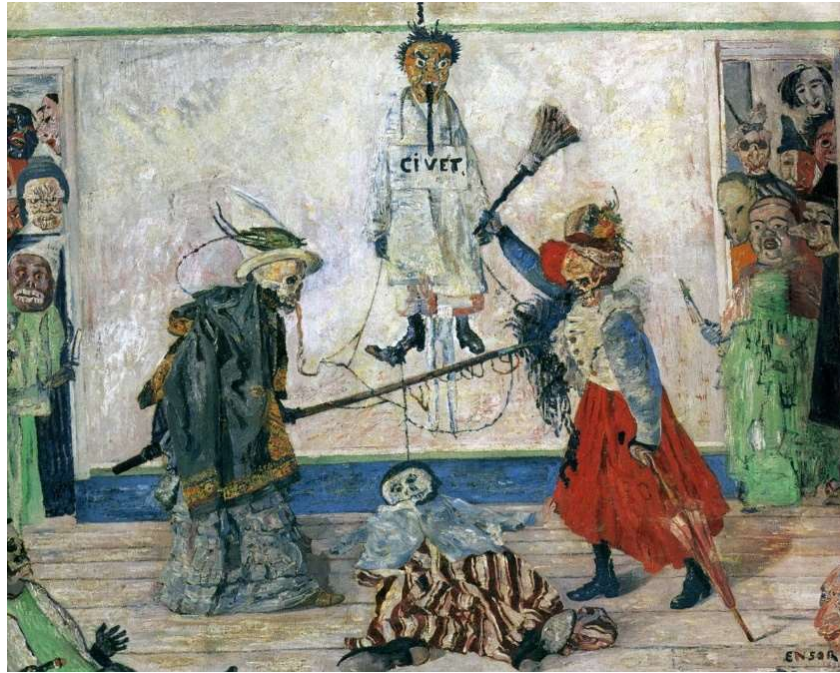
Ensor, J. (1891). Skeletons Fighting over a Hanged Man. Museo de Bellas Artes de Amberes.