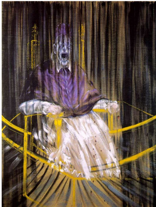
Bacon F. (1953). Study after Velázquez's Portrait of Pope Innocent X . Des Moines Art Center