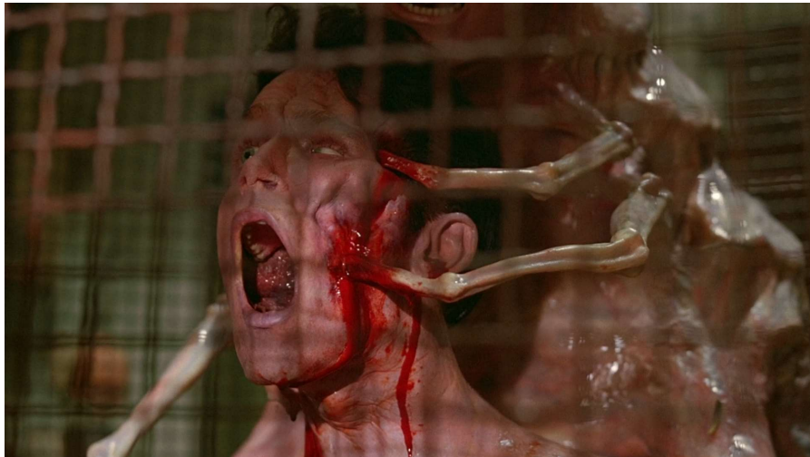
Kiki en la jaula de pájaros. Dentro de Cronenberg D. (Director). (1991). Naked Lunch [película]. 20 th Century Fox