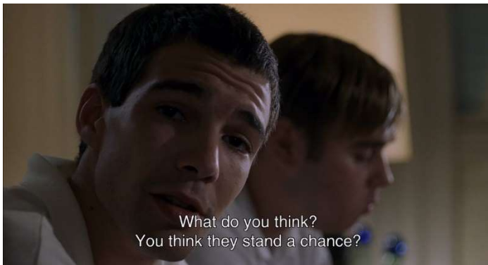
Paul dialogando directamente con el espectador. Dentro de Haneke, M. (Director). (1997). Funny games [película]. Wega-Film