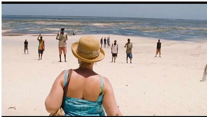
Dentro de Seidl, U. (Director). (2012). Paradies: Liebe [película]. Ulrich Seidl Film Produktion GmbH.