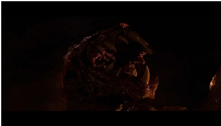
“La cosa” como extensión del cuerpo. Dentro de Carpenter, J. (Director). (1982). The thing . [película]. Universal Pictures