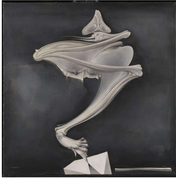
Bellmer, H. (1937). La peonza . Tate Modern, Londres