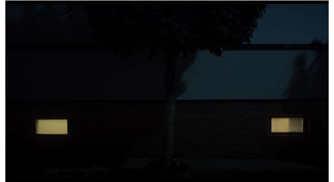
Dentro y fuera del sótano. Dentro de Seidl U. (Director). (2014). Im Keller [película]. Ulrich Seidl Film Produktion GmbH.