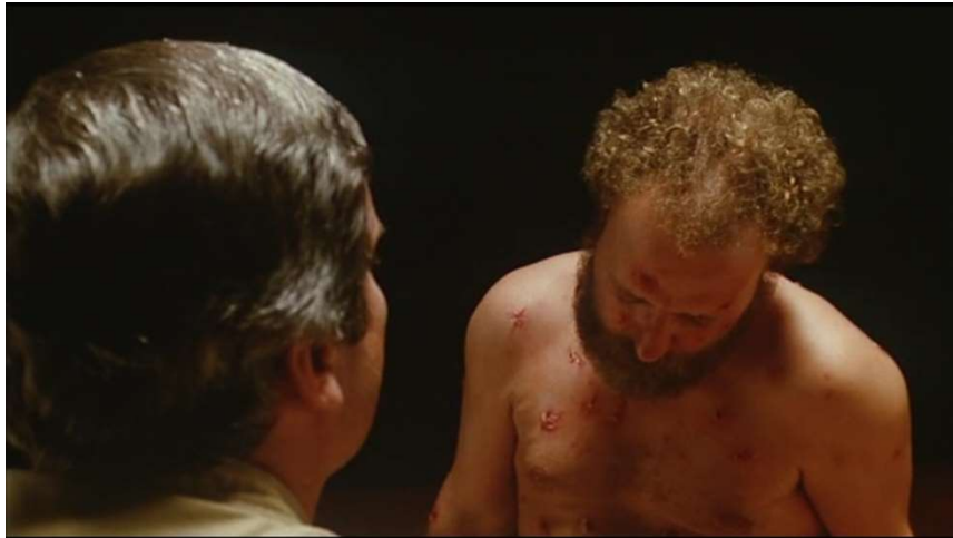
Dentro de Cronenberg, D. (1979) The Brood . [película]. Metro-Goldwyn-Mayer.