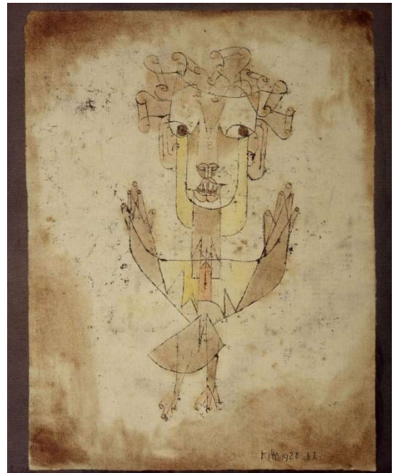
Klee, P. (1920). Angelus Novus . Museo de Israel.