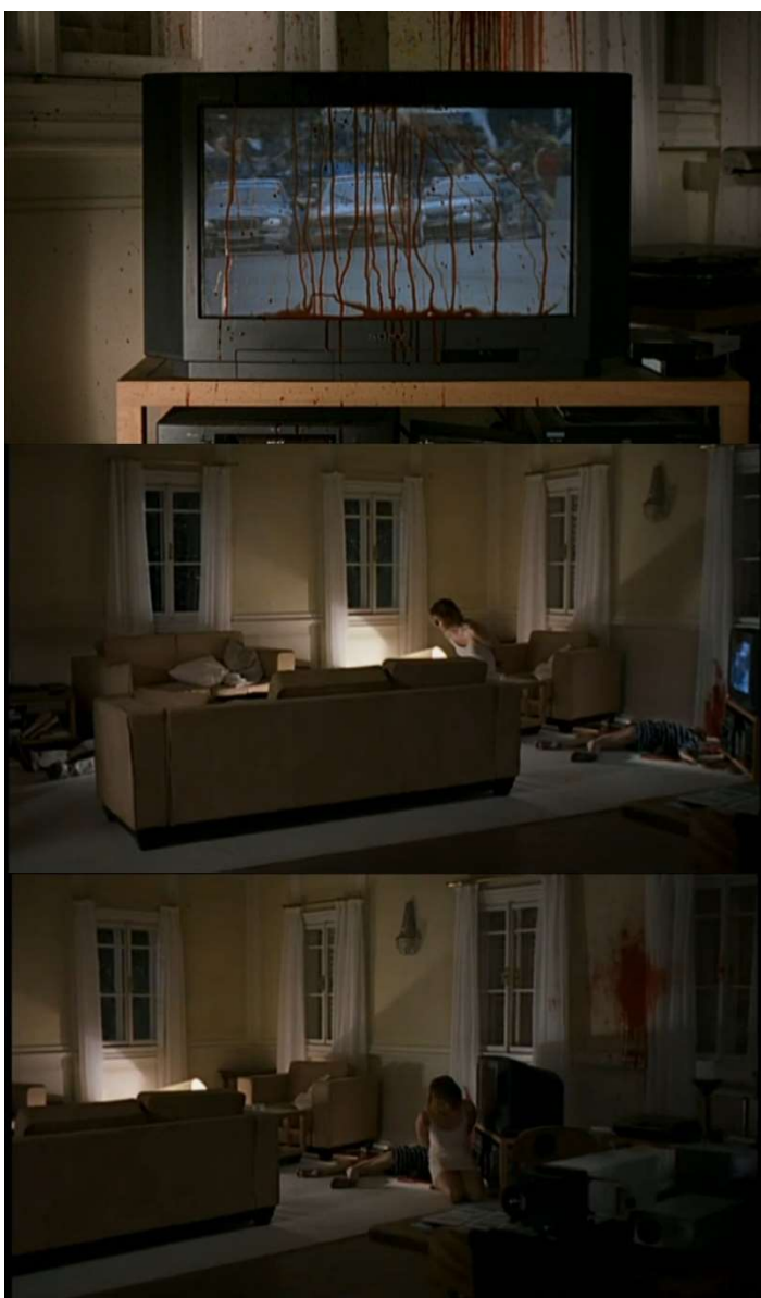
Anna apagando el televisor. Dentro de Haneke, M. (Director). (1997). Funny games [película]. Wega-Film