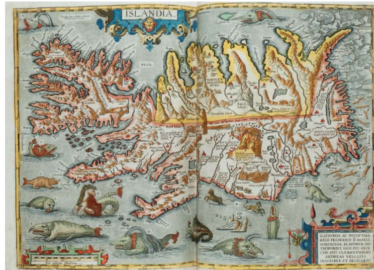
Mapa de Islandia, creado por Abraham Ortelius en 1570. Dentro de Van Duzer, C. A. (2013). Sea monsters on medieval and Renaissance maps (pp. 106). Londres: British Library.