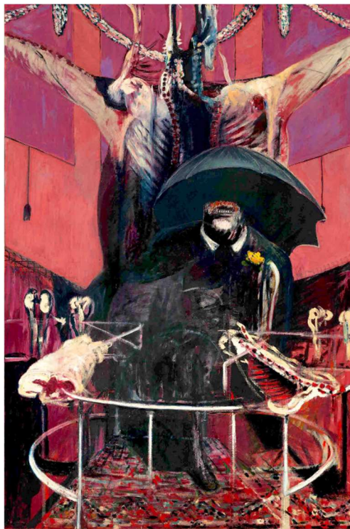
Bacon, F. (1946). Painting 1946 MoMA