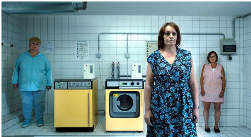
Dentro de Seidl U. (Director). (2014). Im Keller [película]. Ulrich Seidl Film Produktion GmbH.