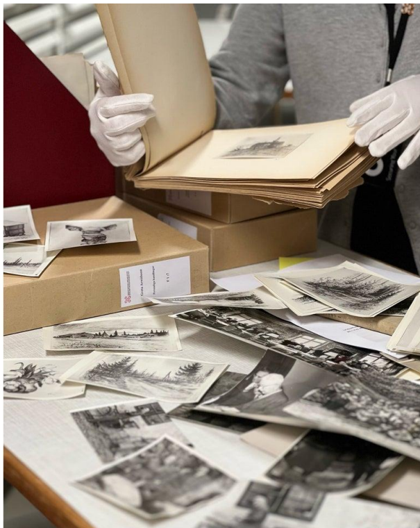
Col·leccions patrimonials a la Vitterhetsakademien's Library

Amb el personal bibliotecari de la Biblioteca de l'Agència Nacional de Patrimoni Suec vam poder intercanviar opinions i reflexions entorn de les dificultats que suposa el procés de canvi de plataforma de gestió bibliotecària doncs utilitzen el programari ALMA des de l'any 2019, així com la importància de comptar amb una comunitat de suport amb altres entitats usuàries del mateix programari ( https://www.nordic-alma.se/ )