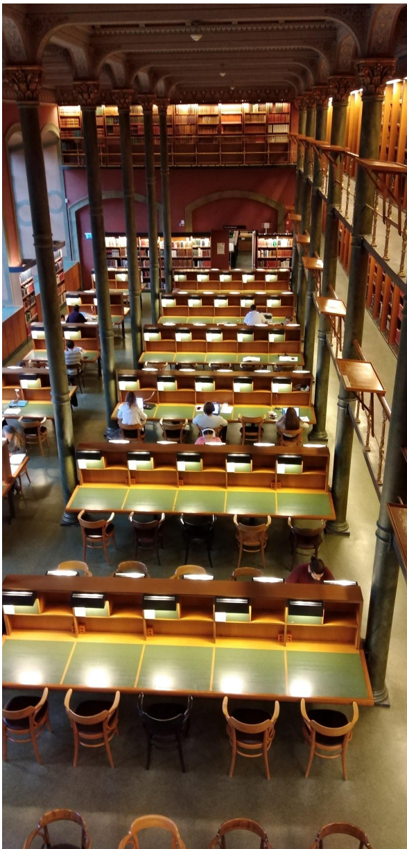
La magnífica sala de lectura principal de la Kungl Biblioteket

A més de la visita estandarditzada que va permetre conèixer les importants instal·lacions i els serveis de la Biblioteca Nacional, també va servir per a descobrir el paper de la institució pel que fa a la preservació digital, doncs l'equipament també té funcions d'agència nacional pel que fa referència a aspectes de preservació del patrimoni cultural.