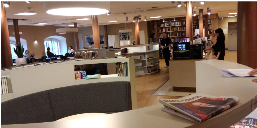
Taulell d'atenció a l'usuari a la Frescati Library

Sobre els fons patrimonials, la biblioteca de la Universitat d'Estocolm té una àmplia col·lecció de llibre antic, mapes i manuscrits, amb alguns d'aquests fons especials consultables en format digital.