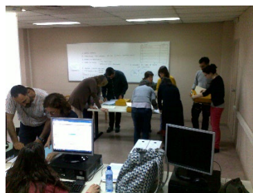
Ilustración 3 Momento de las sesiones prácticas con documentos

Actualmente se han descrito, en el marco de esta colaboración entre ambos servicios, un total de 26 fondos, de los cuales 14 están todavía en curso de identificación de series y descripción de unidades documentales compuestas (expedientes) y simples. Cuatro de ellos corresponden a personas o instituciones sin una vinculación directa con a la Universidad. A continuación, se muestra la relación de los mismos (Tabla 1) y el estado de los trabajos de tratamiento y descripción.