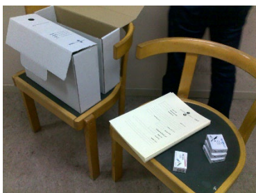
Ilustración 2 Materiales para el tratamiento de la documentación

Desde un principio, la formación se planteó como eminentemente práctica, basada en el manejo y manipulación física de la documentación. Para ello, los archiveros tuvimos la suerte de contar con el fondo documental del que fuera profesor de la UB, rector en dos ocasiones y eminente economista en la época de la España del desarrollismo Fabián Estapé. El volumen moderado de este fondo y su variedad lo convirtieron en un banco de pruebas ideal. En las posteriores sesiones de formación, que prácticamente no han dejado de sucederse desde el año 2012, los propios fondos personales tratados o que se habían recibido para ser tratados, han sido utilizados en un proceso que se podría calificar de autoevaluación, retroalimentación y aprendizaje continuo, y que ha demostrado su utilidad para crear un bagaje de conocimiento de gran valor.